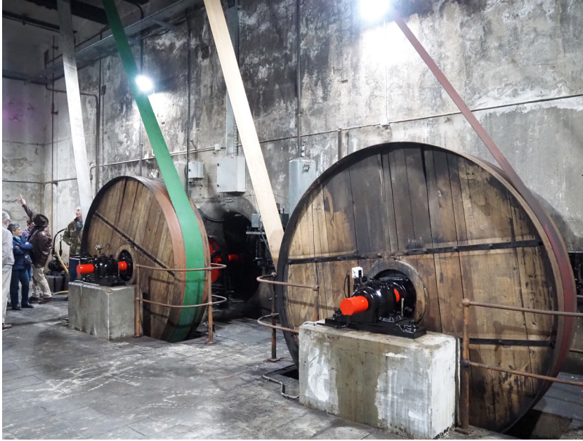
Fig. 2. Un aspecte de la central hidroelèctrica Vinyals.

Totes les visites es van fer un dissabte. Els participants havien d'inscriure's al web de l'Institut per assegurar-se un lloc, ja que el nombre d'assistents era limitat, generalment a 25 o 30 persones. Totes van ser dirigides per persones conegedores dels llocs visitats. Foren les següents: