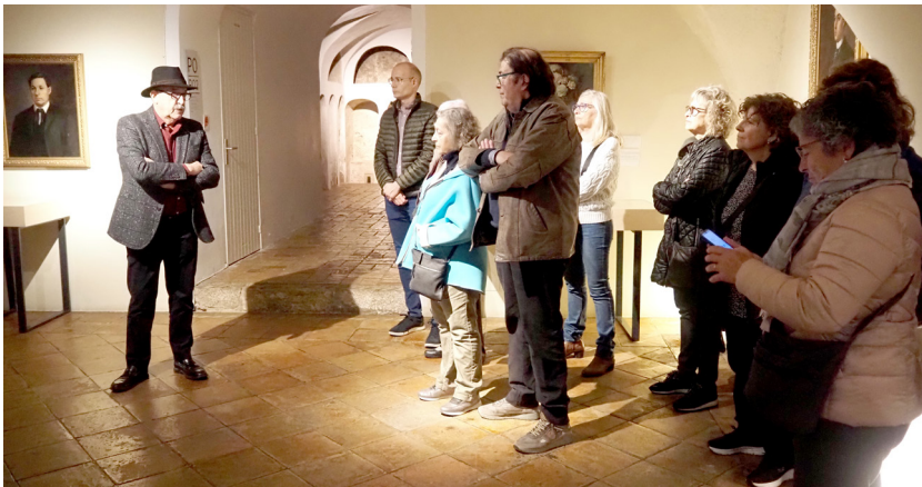
Fig. 9. La visita al Museu d'Història de la Ciutat.