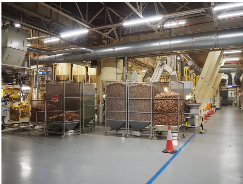
Fig. 7. Un aspecte de la fàbrica Trefinos de Palafrugell.