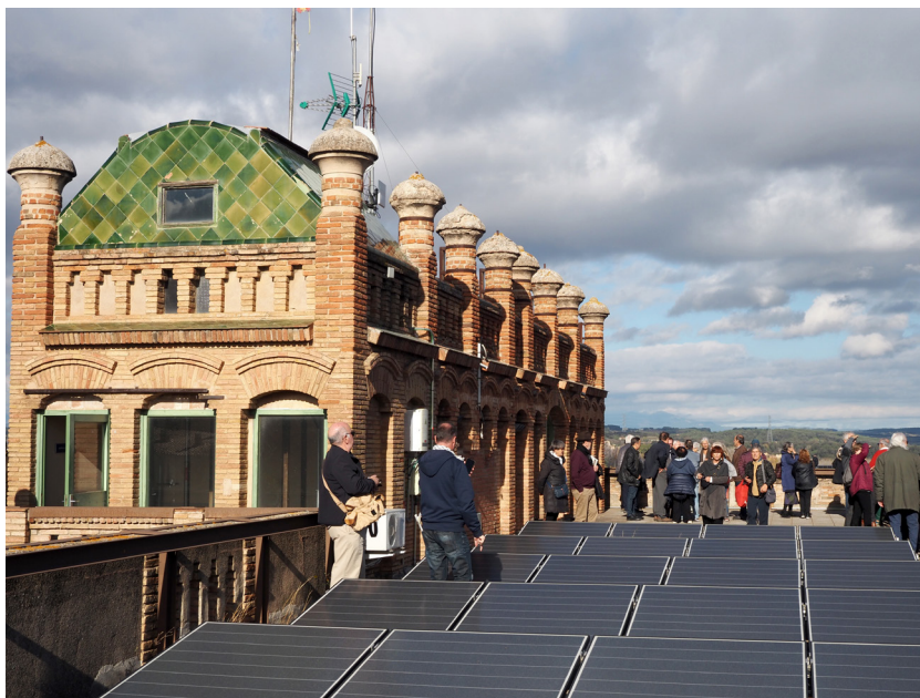
Fig. 3. Els participants a la visita a la fàbrica modernista Pagans de Celrà a la part alta de l'edifici.