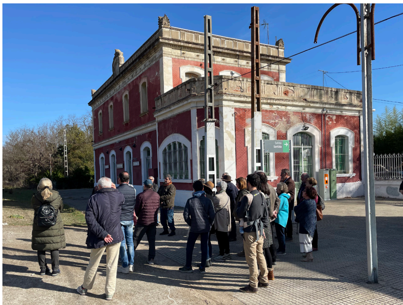
Fig. 6. Visita a l'estació de tren de Fornells de la Selva.