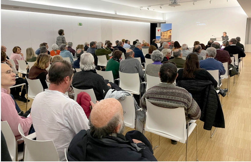
Fig. 1. La sala Enric Mirambell a la biblioteca Carles Rahola durant la conferència del dia 16 de gener de 2024.

Caresties, calamitats, adversitats, terratrèmols, pestes, aiguats, setges... El curs 2021/2022 tingueren lloc dos cicles, un sobre novetats arqueològiques, La ciutat recuperada. Converses sobre arqueologia urbana recent a Girona i un altre sobre algunes de les obres d'art que es presenten al nou museu remodelat de la catedral de Girona, Ornamenta ecclesiae. El tresor de la Catedral de Girona . Finalment el curs 2022/2023 tingué lloc el cicle ja esmentat Mirades sobre la història de la cuina i l'alimentació a Girona , dues conferències del qual foren publicades als Annals de 2023 descrits més amunt.