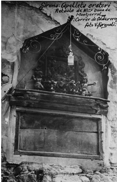
Mare de Déu de Montserrat. Capella del carrer dels Calderers.