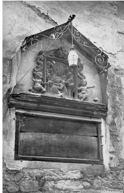
Una segona sense signar és de l'Arxiu Amatller de Barcelona. Ajuntament de Girona-CRDI.

inicial xilogràfica. Editat amb un gravat que representa la Mare de Déu de Montserrat. Signatura: Pejoan Vic. Gen. et Offic.