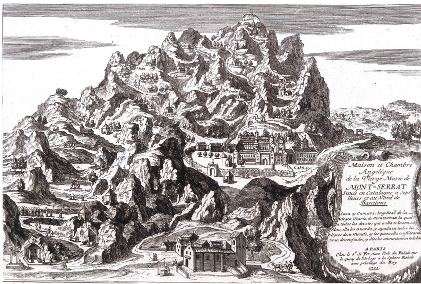
Gravat francès del monestir de Montserrat (París, 1701).

Ítem, concedeix a dits confreres, després de difunts, participen de tots los sacrificis, oracions y altres beneficis espirituals que fan en tota la Iglesia militant 10 .