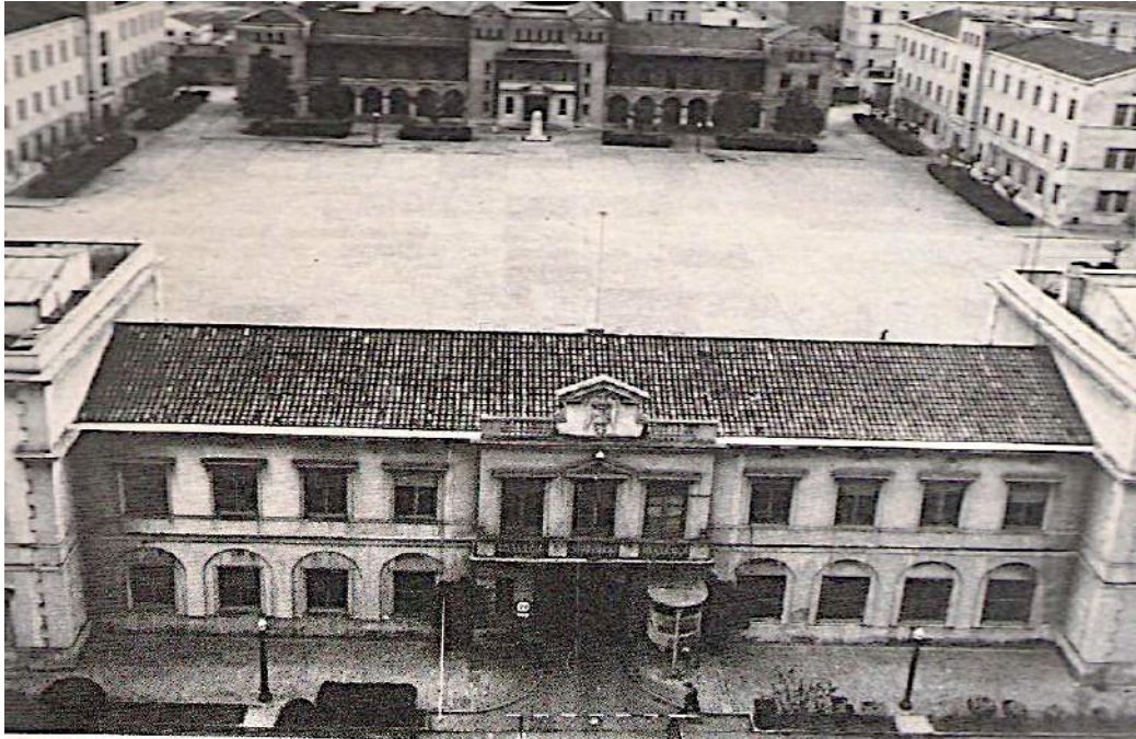
Foto: Façana principal de les casernes. Anys 80.