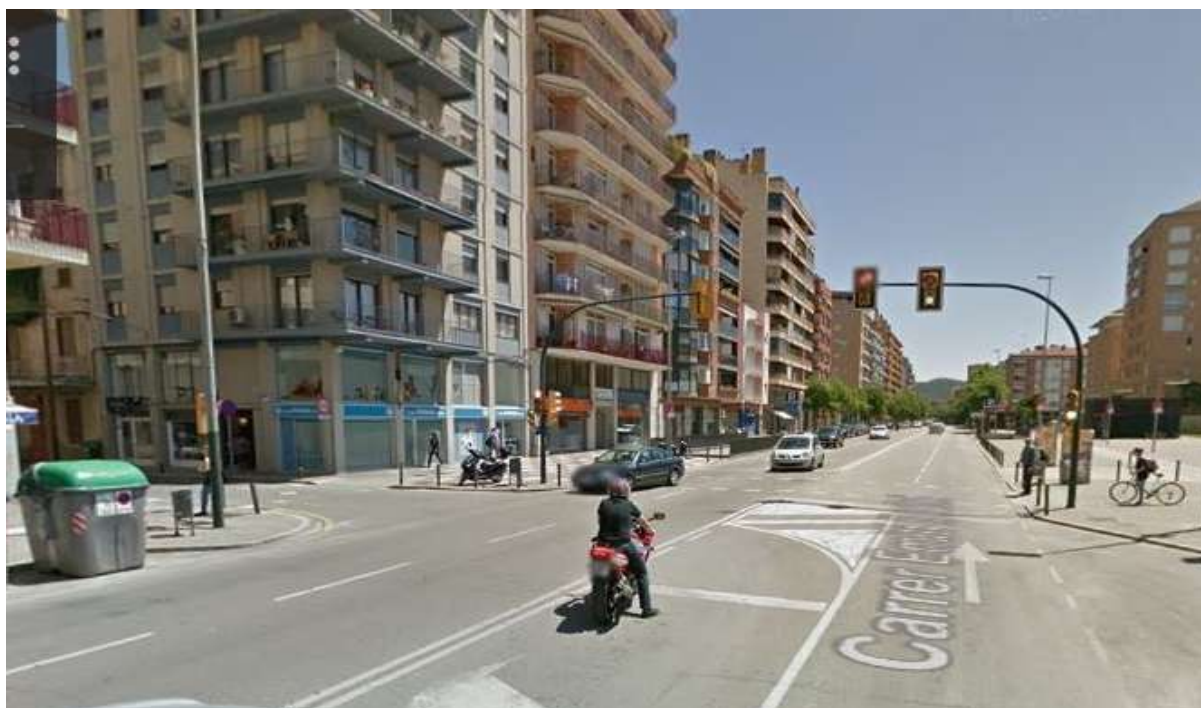
Foto. Any 2016. El mateix emplaçament amb 48 anys de diferència.