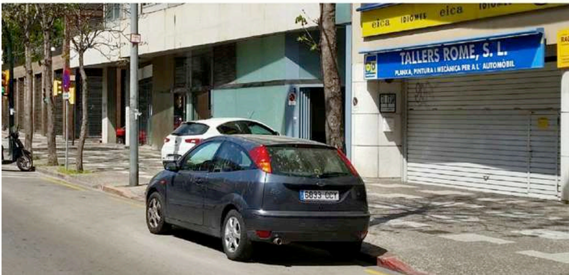
Foto: Abans i després dels Tallers Rome