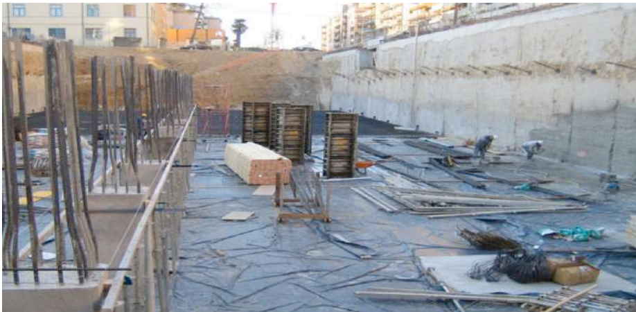
Foto. El Punt. Obres de construcció de l'aparcament soterrat a l'Emili Grahit. Any 2005

En aquest carrer l'aparcament també va patir el rebuig dels veïns però es va mantenir l'emplaçament i les obres van començar l'estiu del 2005 amb un projecte que es preveia per 326 places per a cotxes i 66 per a motos.