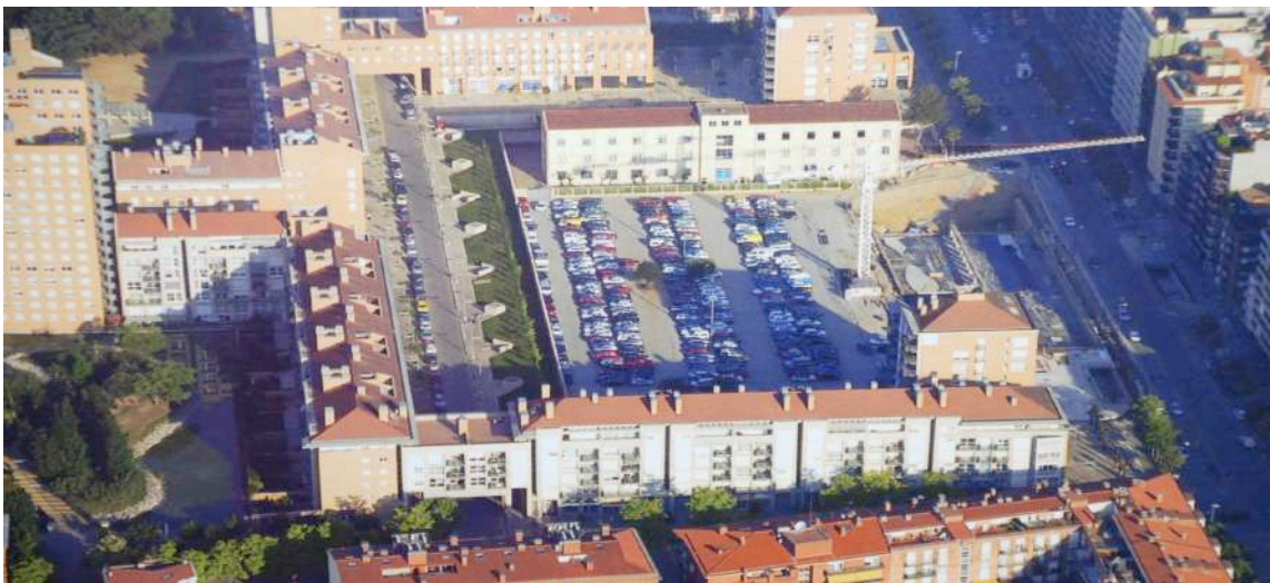
Aprofitament de l'espai. Aparcament obert a l'Emili Grahit en espera d'un soterrat . (Any 2003)

Un dels espais que deixen els enderrocs és un espai diàfan que de l'any 2000 fins al 2005 s'aprofitarà per fer un aparcament gratuït, a l'espera de fer-ne un de soterrat a la zona i que és provisional fins saber quin serà el seu ús definitiu.