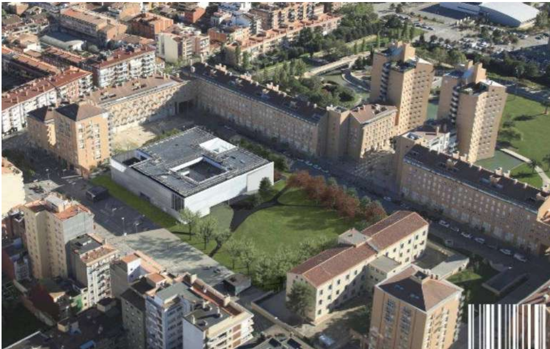
Foto: Zona casernes després de l'enderroc dels edificis militars i la urbanització de l'espai, amb la biblioteca Carles Rahola al mig. Any 2016

Amb aquest parc i la inauguració de la biblioteca s'ha acabat d'arrodonir la urbanització del carrer Emili Grahit.