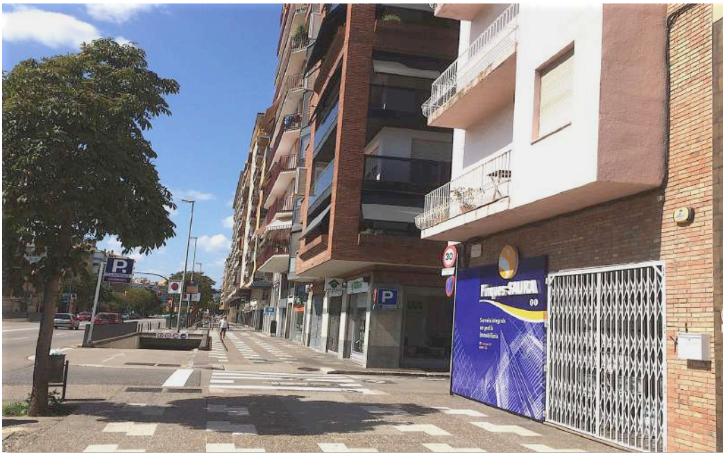
A l'actualitat, la mateixa zona.