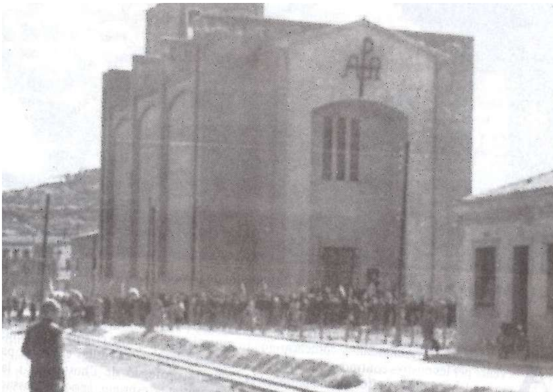
Foto: Diada consagració de l'església com a temple. Any 1954. Ajuntament de Girona. Davant es poden veure encara les vies estretes del Carrilet. CRDI

Fou considerat el primer temple modern de la ciutat i la quarta parròquia del nucli urbà.