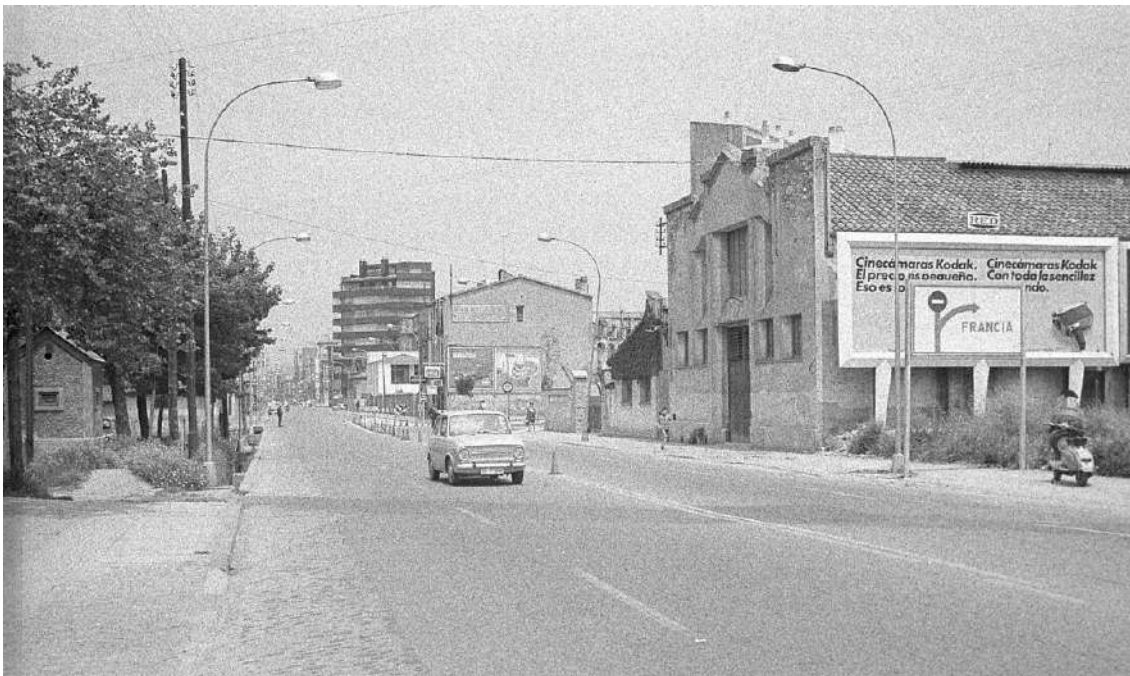
Foto: Carretera Barcelona. Any 1973. S'aprecia encara el traçat de la via estreta del tren petit que travessava per enfilar Emili Grahit.

La seva lentitud de desplaçament cada cop l'afectà més fins que a la dècada dels anys 60 patí una important disminució de viatgers durant un període de 3 anys. Això, acompanyat de les dificultats econòmiques, provocà la seva desaparició. L'últim trajecte es produí el 10 d'abril de 1969.