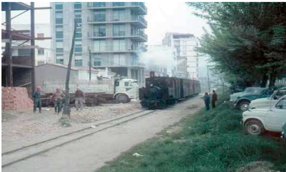
Foto: 1rs construccions a l'any 1968, encara amb el carrilet en actiu. CRDI Ajuntament Girona