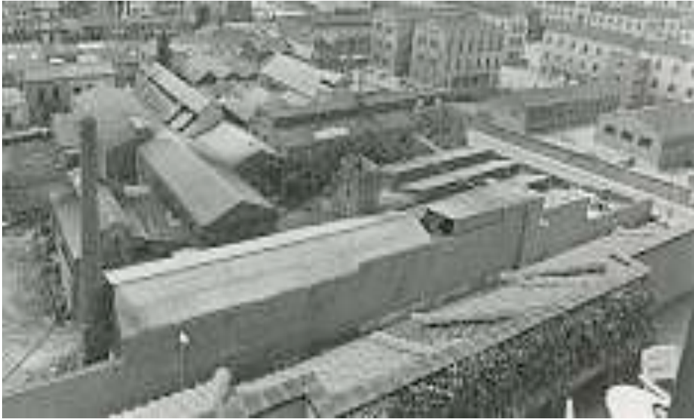
Foto: Fàbrica Pagans. Any 1979.

Tot aquest procés, que es feia a Emili Grahit , emanava una pudor que feia incompatible l'expansió del nucli urbà de Girona cap al sud amb la urbanització dels espais que envoltaven la fàbrica de Can Pagans.