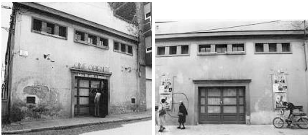
Cinema Orient. Any 1979. Poc abans de ser expropiat i enderrocat per l'ampliació del carrer.

Aquest va aparèixer encara entre mig d'horts i camps, situat entre el carrer Emili Grahit i el carrer de la Rutlla, però degut a l'època i el lloc on estava situat era conegut com un cinema de segon ordre per la burgesia.