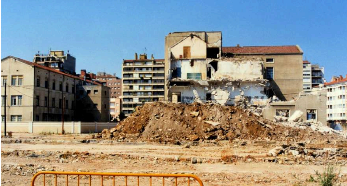
Enderroc casernes militars. Any 1998

Era l'any 1993, ara ha fet 25 anys, quan les màquines començaven a fer desaparèixer el passat militar d'un espai immens, ara sí al centre de la Girona Nova. Els últims enderrocs van continuar fins al 2004.