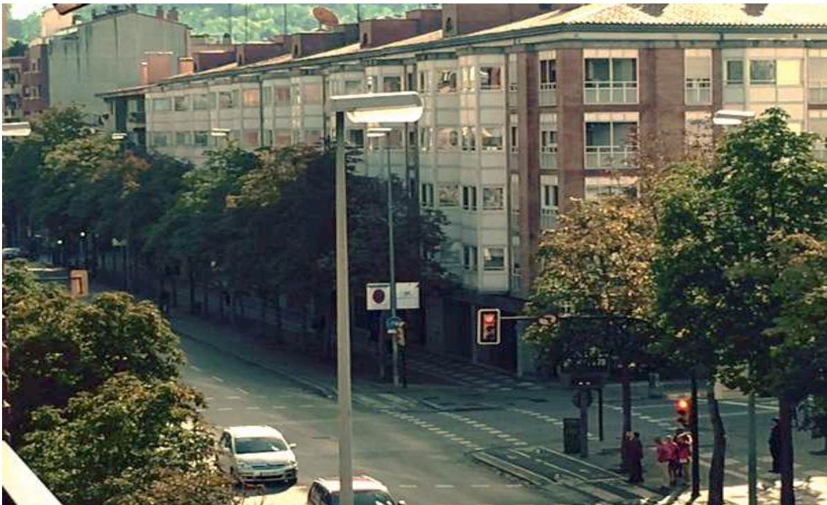
Vista de l'edifici des d'Emili Grahit