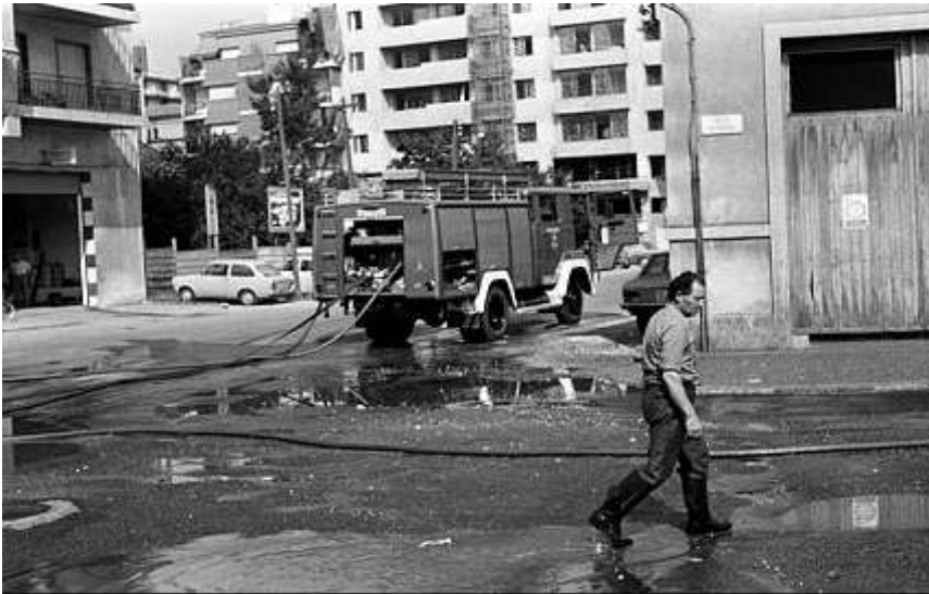
Foto: Explosió d'un contenidor a Can Pagans. Tasques de neteja Ajuntament de Girona. 22/7/78

Molts veïns del barri ja havien manifestat queixes pels olors insuportables que havien de patir mentre la fàbrica va estar en funcionament; a més patien per la incertesa provocada per un accident que es va produir estant la fàbrica enmig de la ciutat. Concretament va ser l'any 1978 que va explotar un dipòsit d'àcid clorhídric, cosa que va acabar de fer decidir l'ajuntament el trasllat de la factoria a Cervià de Ter. Aquesta operació fou executada a la primavera de l'any 1986, per tant força anys després del començament de la urbanització del carrer que havia començat cap els anys 70. D'aquí que els veïns s'hi mostressin tan a favor.