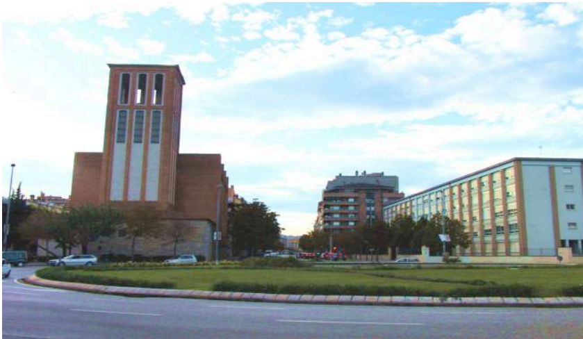
(plaça dels Països Catalans en vistes Emili Grahit) Any 2012