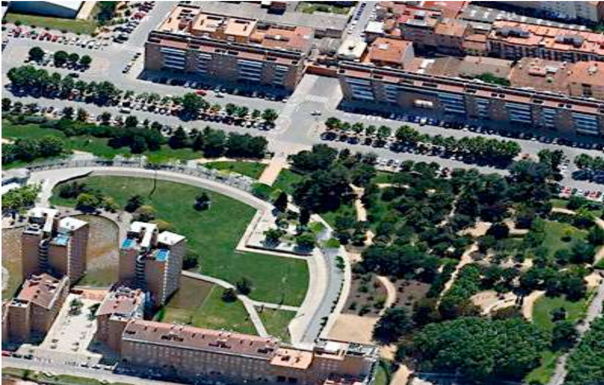
Foto: Imatge de la zona d'habitatges de les Casernes amb Emili Grahit en primer terme. Any 2004.

Habitatges de qualitat, voreres molt més amples, zona d'aparcament, una gran zona verda i un estany eren la base del projecte que es va dibuixar per l'espai Casernes.