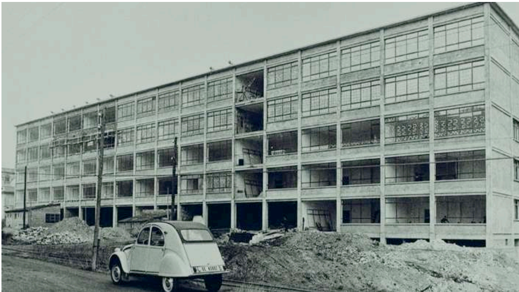
Construcció de l'Escola de mestres de Girona o Normal a l'Emili Grahit. Any 1962

Aquesta Facultat es va traslladar a inicis de 2010 al Barri Vell,