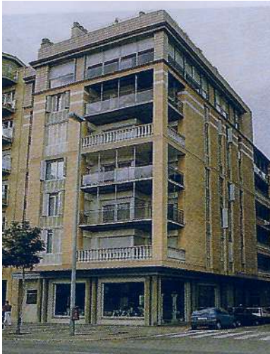
Foto: Josep M .Oliveras. Guia d'arquitectura .Col·legi d'arquitectes de Girona

Per últim un dels edificis d'aquesta generació dels 80 que més popularitat ha adquirit és el bloc Quer Vinyoles , cantonada Manel Quer amb Emili Grahit, construït per l'arquitecte Joaquim Figa.