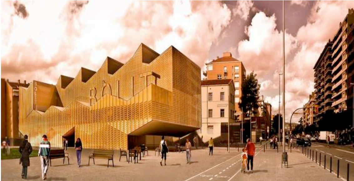
Foto: Dibuix virtual del que havia de ser el centre d'art contemporani . 'El Punt'

El Bòlit havia de ser un equipament cultural que tenia com a objectiu desenvolupar programes de recerca, producció i exhibició de projectes artístics contemporanis.