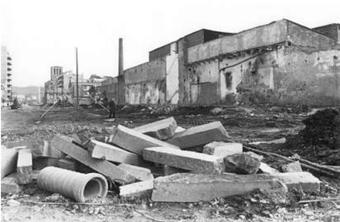
Foto: Fàbrica Pagans. Any 1982. Manel Lladó. CRDI. Ajuntament de Girona