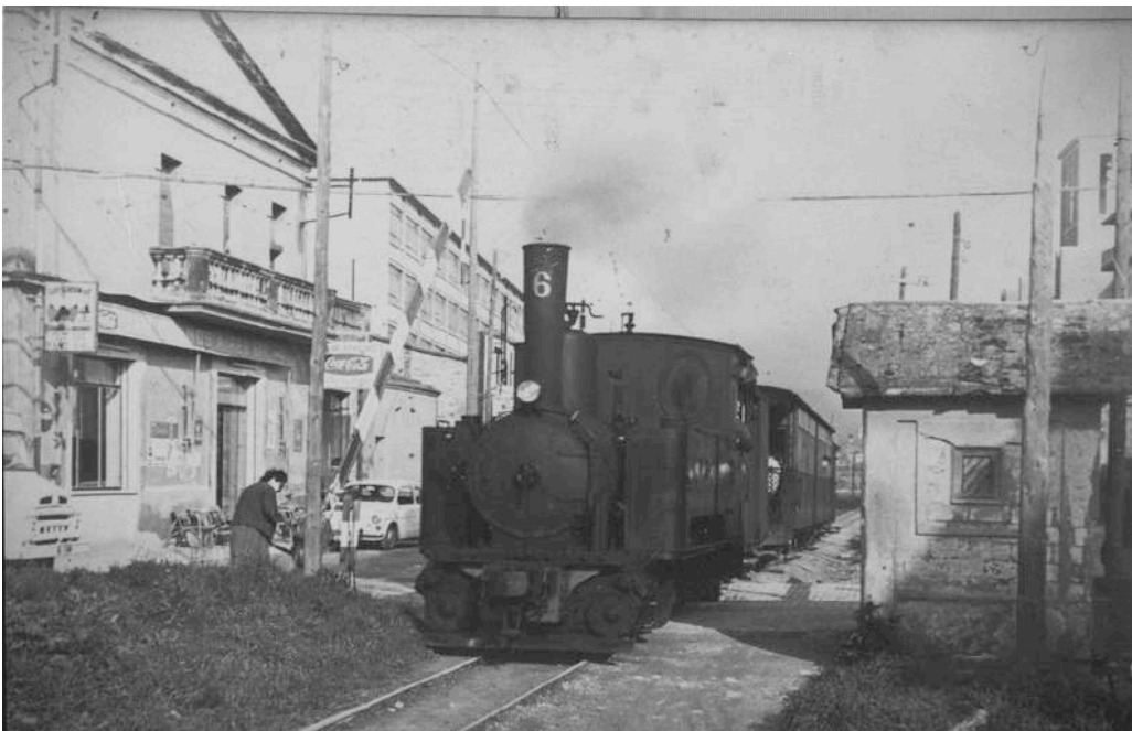
Emili Grahit altura Carrer de la Rutlla. Davant penya Bons Aires. Any 1966.(Edifici Normal al fons)