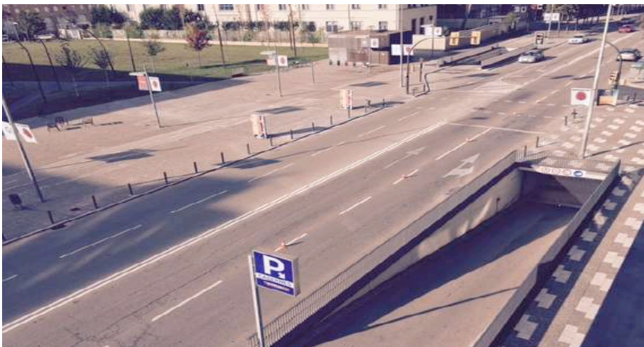
Entrada Emili Grahit cantonada C/Príncep.

L'aparcament s'inaugurà el dia de Sant Jordi de 2008.