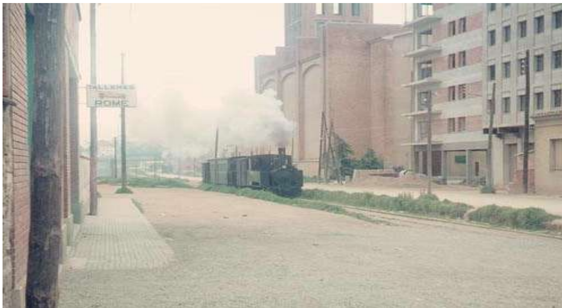
Foto: Any 68. El carrilet just passant per davant de Sant Josep. (Joan Ayala Angelats)

L'any 2002 Sant Josep va celebrar el seu 50è aniversari; per tant l'església ha sobreviscut tota la renovació de la zona . (Veure Annex 3)