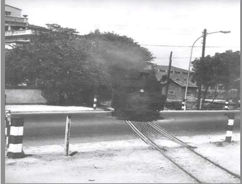
Carrilet de SFG travessant Carretera Barcelona i entrant a Emili Grahit (anys 60)

L'estació del carrilet a Girona es trobava situada al costat mateix de l'estació del 'tren gros', en l'actual plaça d'Espanya i la via travessava el carrer de Barcelona i seguia el carrer Emili Grahit.