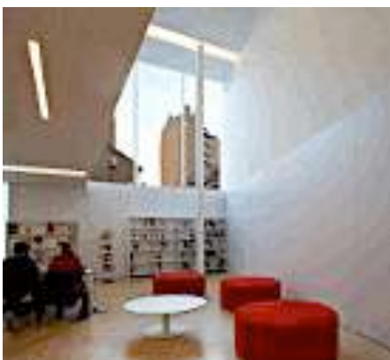
Foto: Interior de la biblioteca on la llum és la protagonista. Web Mario Corea, estudi d'arquitectura