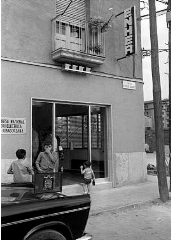
Inauguració Enher a Emili Grahit

Fins i tot ENHER (Empresa Nacional Hidroelèctrica Ribagorzana) s'estableix a Girona, amb seu al carrer Emili Grahit cantonada Migdia i invita la vinguda a Girona dels seus treballadors d'altres comunitats amb una vintena d'habitatges a baix cost o bé pagats per l'empresa, depenent del càrrec.