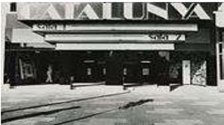
Façana principal dels Cinemes Catalunya

Aquest cinema, que al principi comença només amb una sala de projeccions, va agafant importància i renom a la ciutat fins al punt que es construeixen dues sales més, convertint-se en el primer multi-sales de la ciutat de Girona.