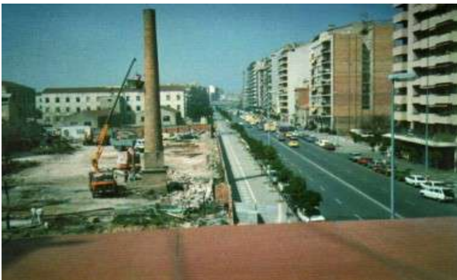
Foto: Trasllat definitiu Can Pagans 1986.