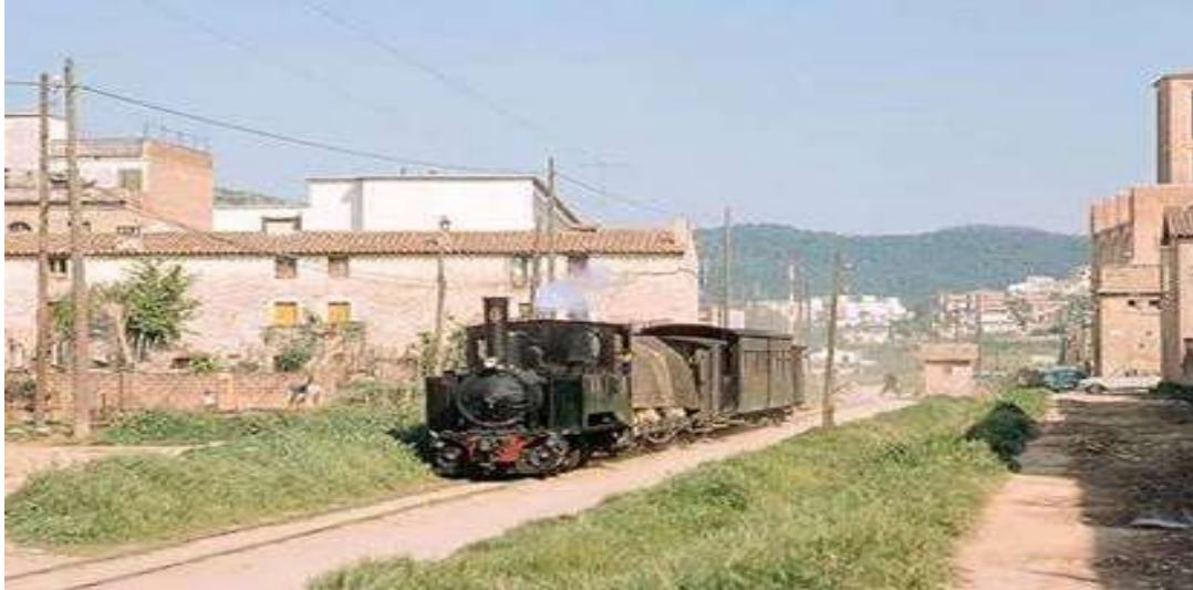
Foto: Any 66. El carrilet just passant per davant la Parròquia de Sant Josep. (Joan A. Angelats)

L'aspecte rural que hi havia al barri en el moment de la seva inauguració, ha canviat per complet: els horts i camps de conreu van ser substituïts pels blocs de pisos; els camins, per carrers; i la via del tren de Sant Feliu de Guíxols, que just li passava pel mig, per un vial de quatre carrils.