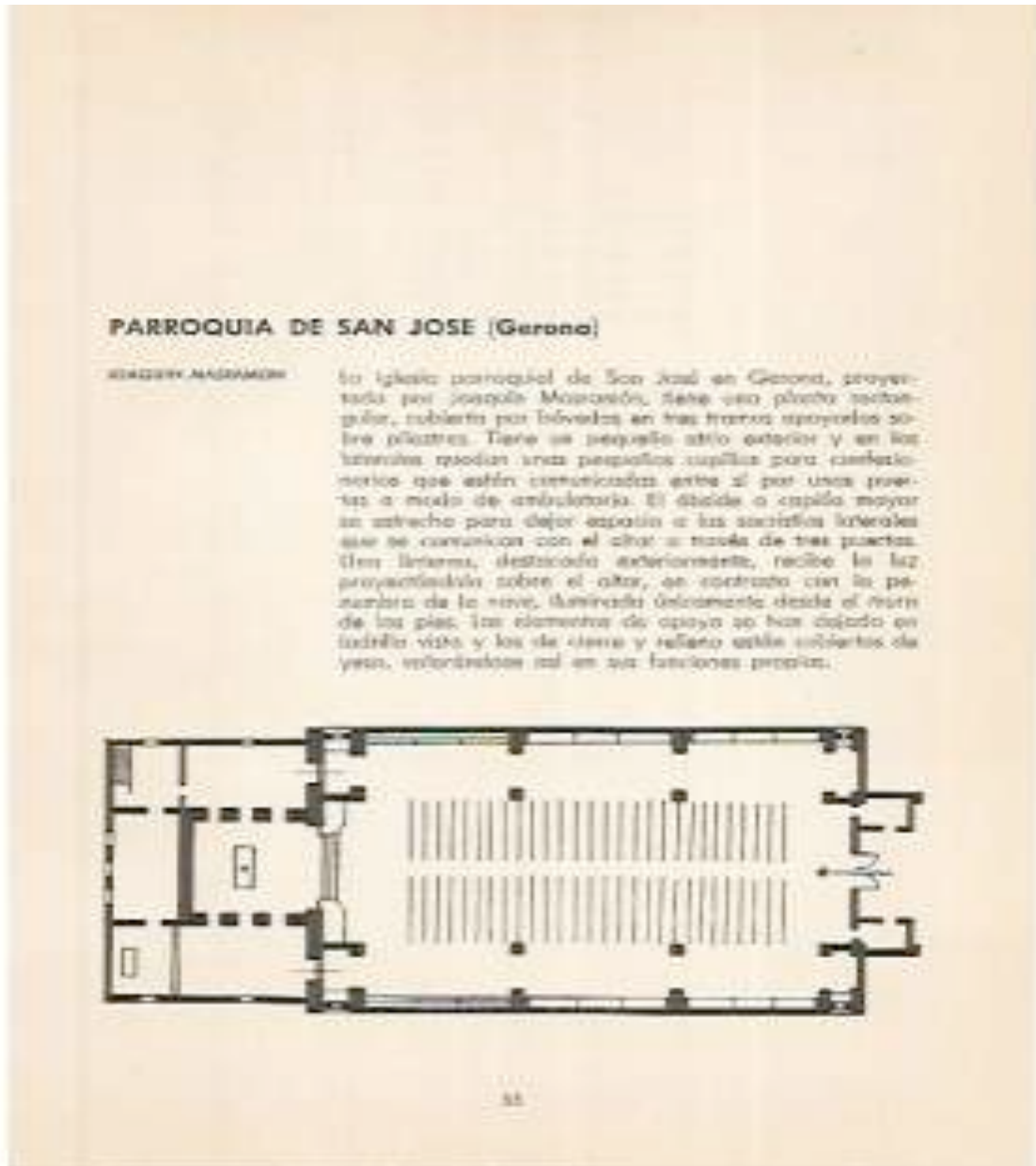
Foto: Làmina procedent de l'obra: Iglesias nuevas en España Autor: A. Fernandez Arenas Editorial: La Polígrafa SA. Fecha Edició: 1963.

Sant Josep és una església d'una sola nau de línies rectes i amb murs de maó vist . Es tracta d'una temptativa de recuperar la tradició modernista.