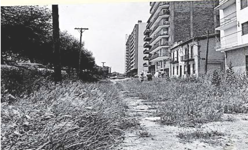
Foto :CRDI. Any 1975 (autor desconegut) La casa baixa central és el solar que ocuparà l'edifici on visc. Alçada carrer Príncipe

Un carrer que ha anat madurant en 85 anys.(1930-2016)