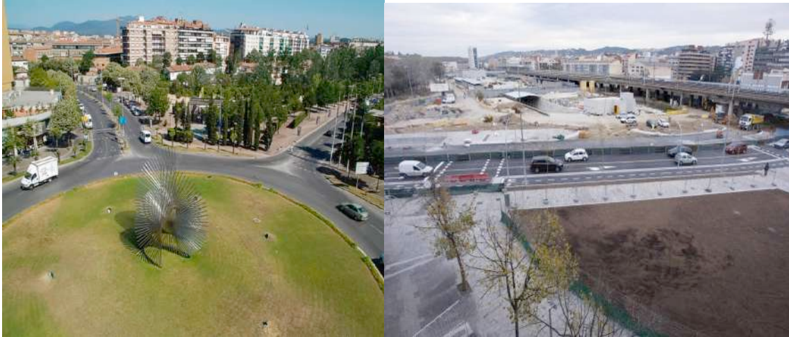
Fotos :Esquerra: Escultura del carrer a l'antiga Plaça d'Europa(Ajuntament de Girona)

Per l'altre costat de carrer, la Plaça d'Europa unia l'Emili Grahit amb el sector oest de la ciutat i comptava amb una gran rotonda.