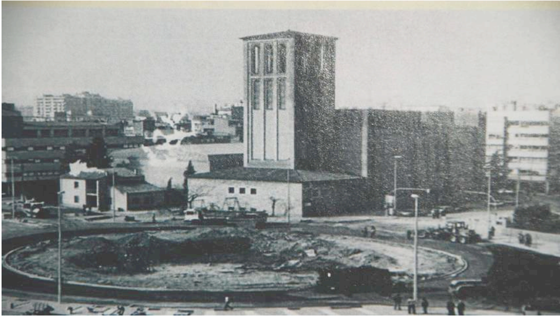
Foto: construcció rotonda Països Catalans .Any 1983.

La construcció de la Plaça dels Països Catalans, però, s'havia fet a l'any 1983 i acaba amb els últims horts que existien encara al carrer, així com obliga el soterrament d'una riera existent a aquest sector del carrer que la gent coneixia com 'el gurnau'.