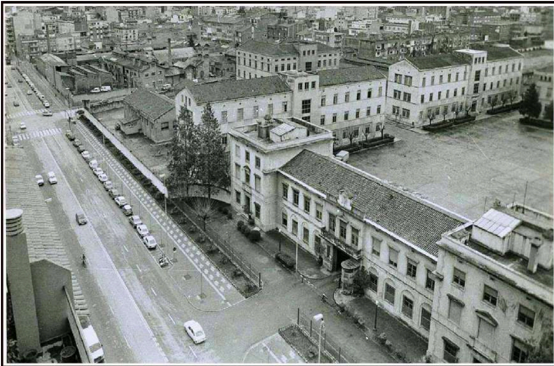
Les casernes d'Emili Grahit, cantonada carrer Migdia. Encara podem veure la fàbrica Pagans a l'altre costat.

Antigament, just en la seva inauguració, el quarter havia rebut el nom de Regiment Alcàntara 33. D'aquí que en l'actualitat i des dels anys 60 trobem el conegut Bar Alcàntara a Emili Grahit número 41, tocant el carrer Migdia.