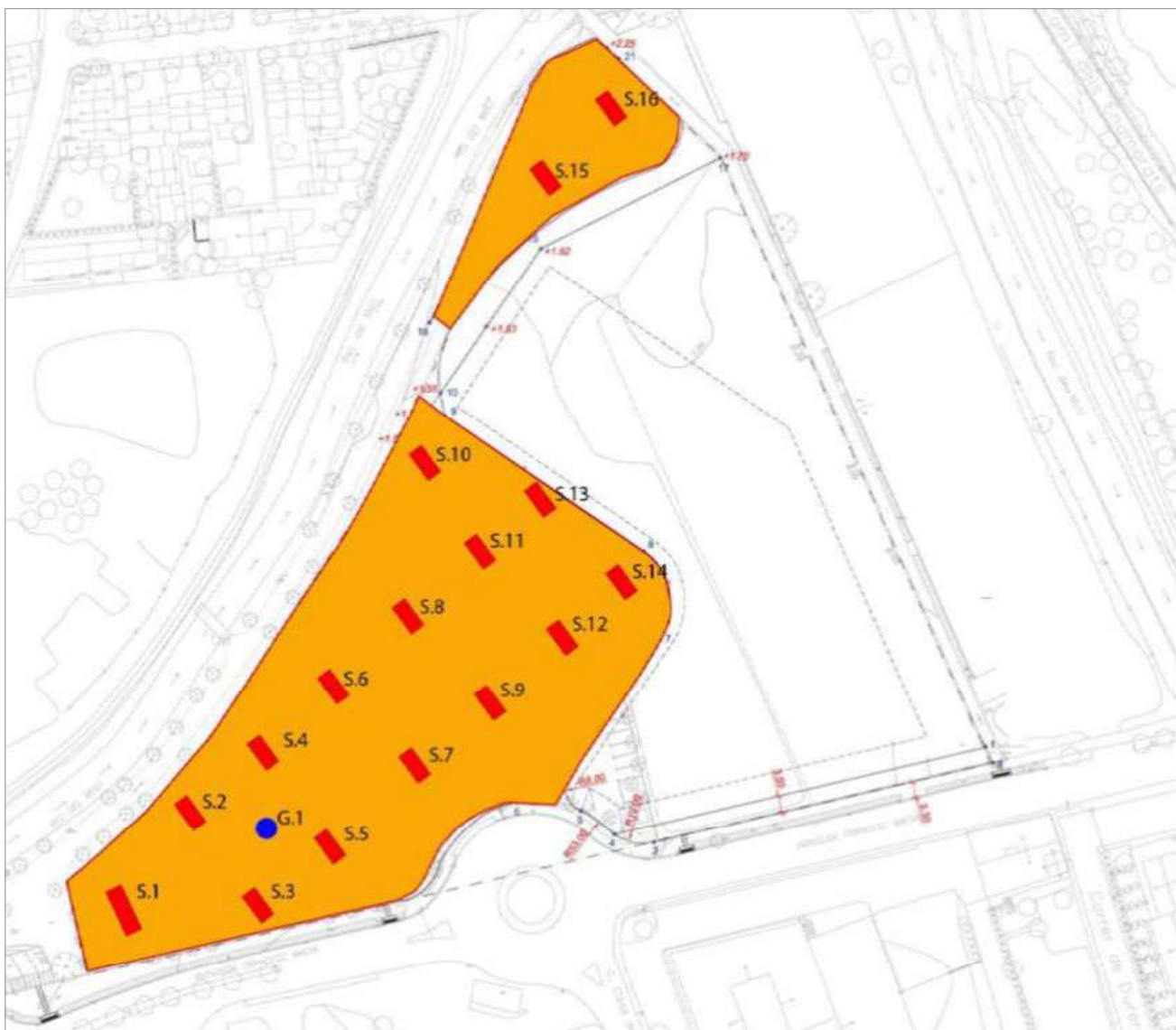
Figura 1. Planta dels sondejos d'Horta d'en Pere.