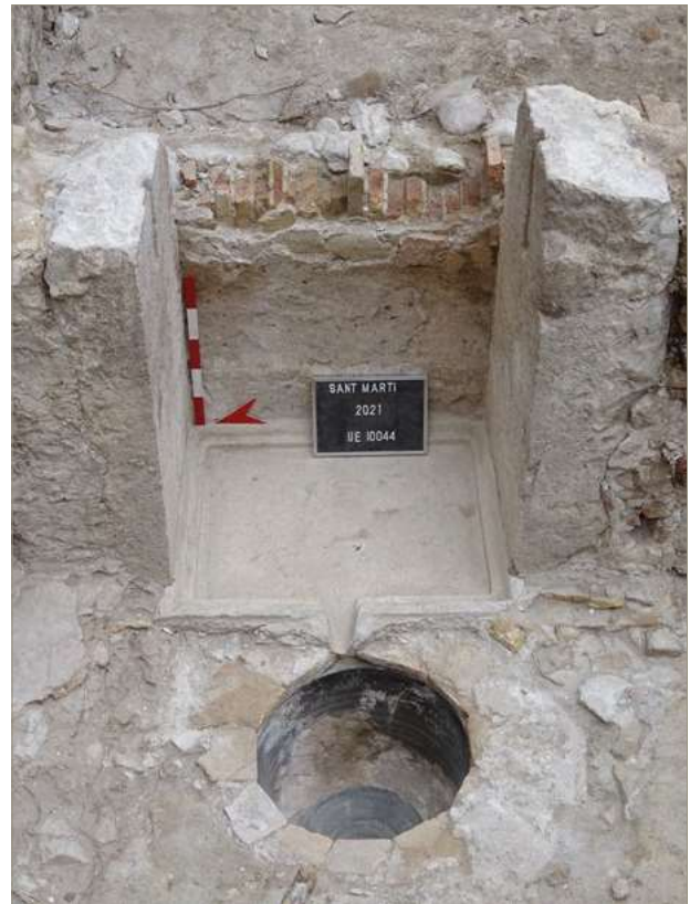
Figura 2. Detall de la premsa d'oli de la casa moderna. Com es pot apreciar es conservaven encara els dos blocs laterals i un bloc horitzontal amb un bec com a vessador. Inclòs es conserva el recipient ceràmic on es dipositava l'oli.

La casa moderna, molts dels seus murs encara en peu, és l'element clau d'aquestes cronologies. Segurament