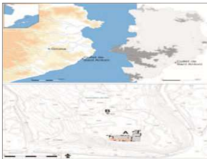
Fig 1. Situació de la vil·la

El jaciment ja es coneixia des de finals del segle XIX quan s'hi havia fet troballes casuals de diferent índole. Per exemple, part d'un mosaic romà així com un conjunt de ferros d'època tardoantiga. No fou, però, fins a principis del segle XXI, quan s'hi van fer una sèrie de sondejos arqueològics, rases, que van detectar l'existència d'estructures. Tot i això, no es va continuar excavant el jaciment. En canvi, sí que es va excavar, per una sèrie de construccions que amenaçaven el jaciment que avui en dia es coneix com el Collet Est, una terrisseria associada a la vil·la romana i que, un cop abandonada, serví també de necròpolis dels treballadors de la vil·la.