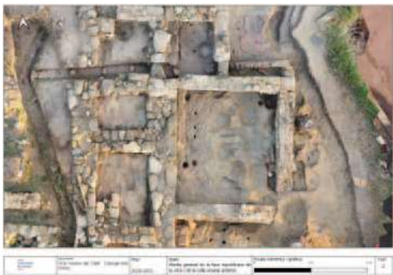
Fig. 2 Planta del magatzem de dolia

Abans de l'existència de la vil·la va existir al Collet un establiment rural dedicat a l'explotació vinatera. Aquest primer moment del jaciment es coneix principalment a través de la descoberta d'una vintena de forats circulars que són els encaixos per recolzar-hi dolia . Aquests grans contenidors ceràmics, una espècie de tines molt usades en època romana, servien per fermentar el most i convertir-lo en vi. No es coneixen els límits arquitectònics d'aquest establiment, tot i que és possible que no en tingués. Per tant, es podria considerar que el que hi havia era un petit celler desvinculat encara d'una vil·la o d'una explotació rural pròpiament dita.