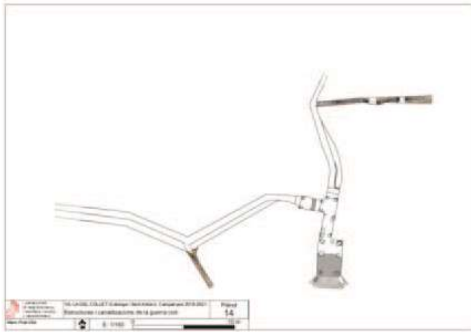
Fig. 5 Planta de la trinxera de la Guerra Civil

s'han pogut recuperar arqueològicament traces del conflicte, com per exemple bales, morters, granades, etc. També es recuperen molt fragments del filferro espinós que en dificultava l'accés, així com elements del dia a dia de la vida dels soldats, com ampolles de vidre, llaunes de conserves, etc.