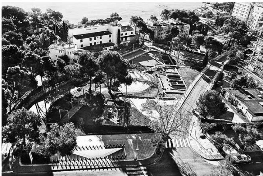
Fig. 1. Vil·la romana de Pla de Palol (Castell-Platja d'Aro). Institut Català de Recerca en Patrimoni Cultural.

Les excavacions arqueològiques efectuades a la vil·la han testimoniado una primera fase de la primera meitat del segle I aC caracteritzada per material i una sitja d'època republicana (Burch et al. , 2010, p. 247-248) en un context històric caracteritzat per un canvi substancial en el sistema d'explotació del camp vinculat a un nou model de poblament i a la integració del territori del nord-est de la península Ibèrica al món romà (Nolla, Palahí, Vivo 2010). La vil·la com a tal fou construïda entorn del canvi d'era. Tal com succeeix arreu, des d'aquesta vil·la se centralitzà la producció agrícola del seu fundus , en el qual es conreaven els productes que com a mínim havien de garantir la subsistència dels seus habitants i l'obtenció d'excedents destinats al mercat. Ben aviat es vinculà a la viticultura amb l'objectiu d'exportar el vi produït en el seu fundus . La troballa d'àmfores vinàries de producció local, la presència d'un celler, la localització d'un segell per marcar taps d'àmfora amb el nom de Porcianus (o Porciana ) i la propera terrisseria de can Lloverons són indicis prou clars d'aquest fenomen. No obstant, el vi no era l'únic producte elaborat en aquesta vil·la ni tampoc la vinya n'era l'únic tipus de conreu. Per tant, el conreu de cereals, fonamental en l'ali-