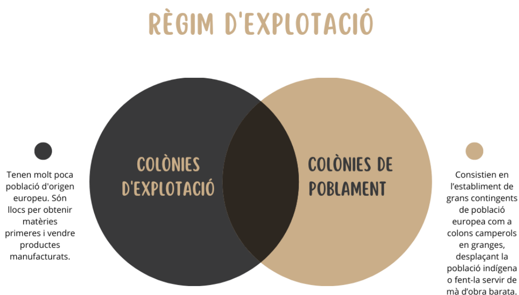
Imatge 2: Règims d'explotació de les colònies

Classificació de les colònies pel règim d'explotació de les mateixes: