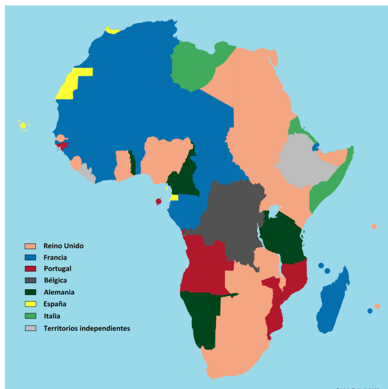
Mapa 1: Possessions europees a Àfrica, amb base als acords presos a la Conferència de Berlín (1885)

Etiòpia (Abissínia), Libèria i els estats lliures d'Orange i Transvaal van ser els únics territoris que van poder escapar de la gana voraç dels països europeus. El Congo, territori objecte dels reclams de tots, va ser lliurat al rei dels Belgues a títol de "propietat privada" (sota la ficció jurídica d'Estat Lliure del Congo), encara que els altres estats hi poguessin comerciar lliurement. Espanya i Portugal, els territoris dels quals estaven també a la mira dels britànics, francesos i alemanys, van poder mantenir-los i fins i tot ampliar-los (Little, 2011).