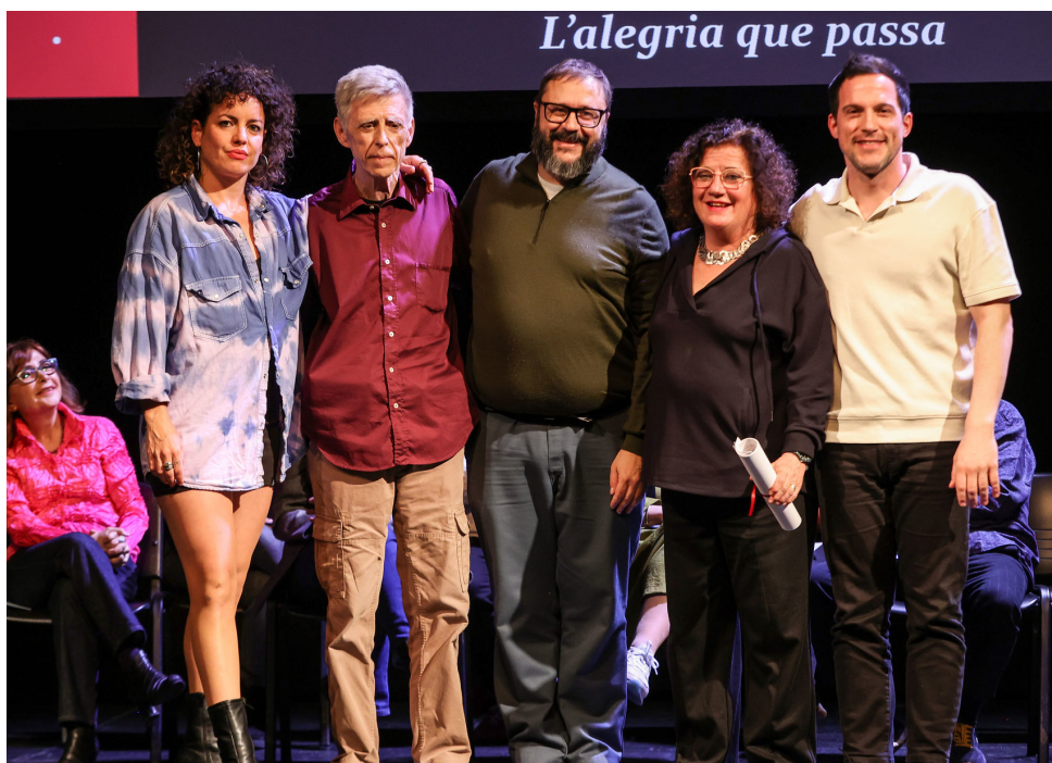
Equip de L'alegria que passa als premis de la Crítica

Ara, el panorama teatral català s'omple de nostàlgia i reconeixement mentre celebrem el cinquantè aniversari i la baixada de taló d'una de les companyies més emblemàtiques de la nostra cultura. Però aquest adeu no és un comiat trist. És un moment per celebrar l'herència que deixen en rere i per reconèixer els nous talents i les noves generacions que prenen el relleu de la feina feta, que ha inspirat molts joves a formar-se en aquestes disciplines (el teatre, la música, la dansa i la dramaturgia) i a no deixar de perseguir els seus somnis. Figures com, per exemple, enfocant-nos en l'últim espectacle de la companyia,