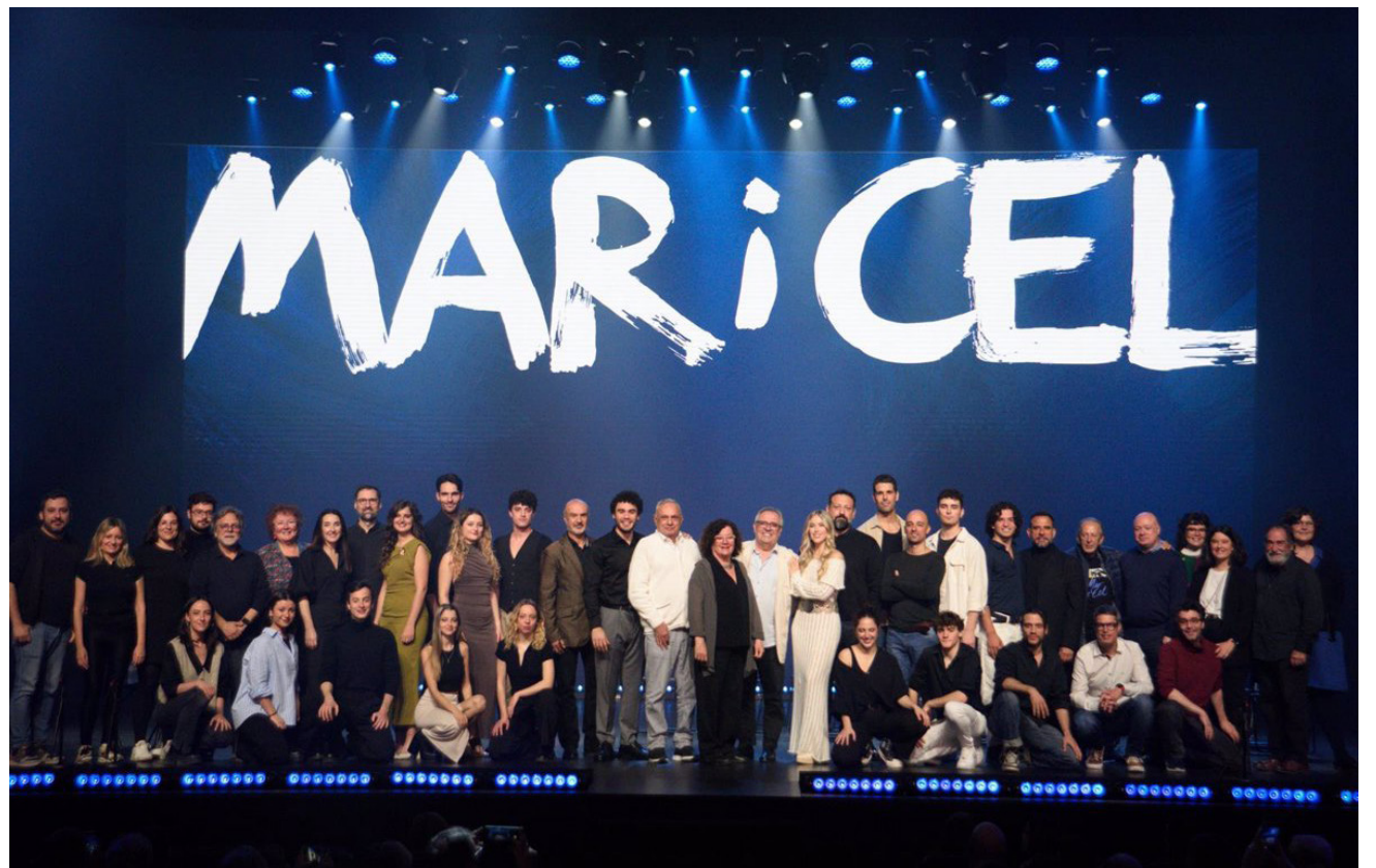
Repartiment de Mar i cel 2024

La història se centra en el conflicte entre cristians i musulmans a l'Espanya del segle XVII, un moment de gran tensió entre cultures i que va acabar amb l'expulsió del regne d'Espanya de 300.000 moriscos decretada per Felip III l'any 1609. Saïd, un pirata musulmà, és el capità d'un vaixell algerí que ha capturat una nau cristiana. Durant la lluita per l'abordatge del vaixell hi ha hagut diversos morts i ferits, però el botí i els presoners són de gran valor, per tant, podran vendre'ls o demanar-ne un rescot. Entre els capturats, hi ha el personatge de la Blanca, una jove cristiana, a qui en un moment donat Saïd demana que li curi les ferides. Mar i cel és una història d'amor impossible. Un "Romeu i Julieta" número dos. Un corsari morisc i una noia cristiana. Un món vist des d'orient i un món vist des d'occi-