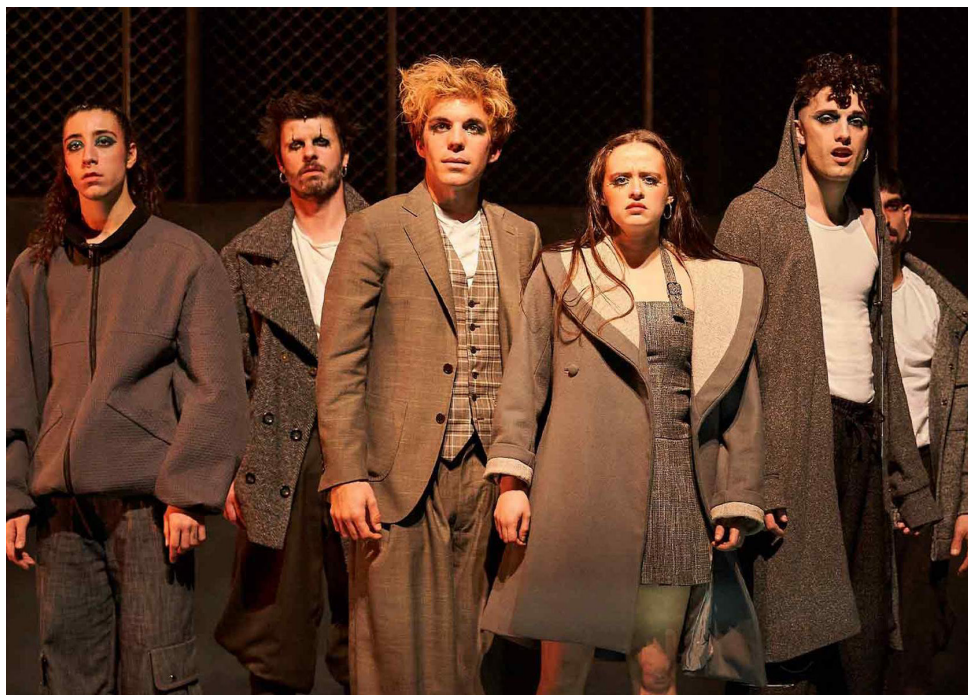
L'alegria que passa