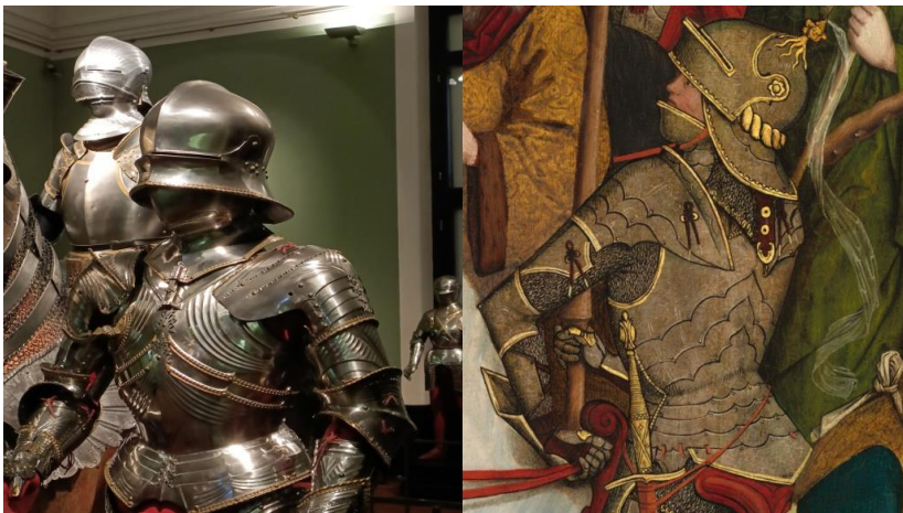
L'arnès de Maximilià I (1485) fotografiat per Jaume Alcoy al Kunsthistorischesmuseum. Detall del calvari del mestre de Münster (1470-80) National Gallery of Art.

Tot i cert nivell d'abstracció i introducció d'elements fantàstics o simbòlics amb els que hem de vigilar, podem reconèixer un nivell gran fidelitat en aquestes representacions pictòriques si comparem amb escrits i fonts arqueològiques. Per aquests motius he consultat la crònica Primer Nueva Corónica del Buen Gobierno de Felipe Guamán Poma de Ayla, un noble quítxua. Les seves il·lustracions no són coetànies als esdeveniments car que l'obra és publicada l'any 1615, però funcionen en tàndem amb altres fonts (arqueològiques i escrites) per investigar l'armament de la conquesta, cosa que també s'aplica als queros colonials que representen el passat pre-hispànic. Això també es dona a Europa. Algunes representacions reproduïxen l'anatomia o els detalls i proporcions de l'equipament amb més fidelitat que altres, però es innegable que la gran majoria representen el que els artistes percebien al seu entorn.