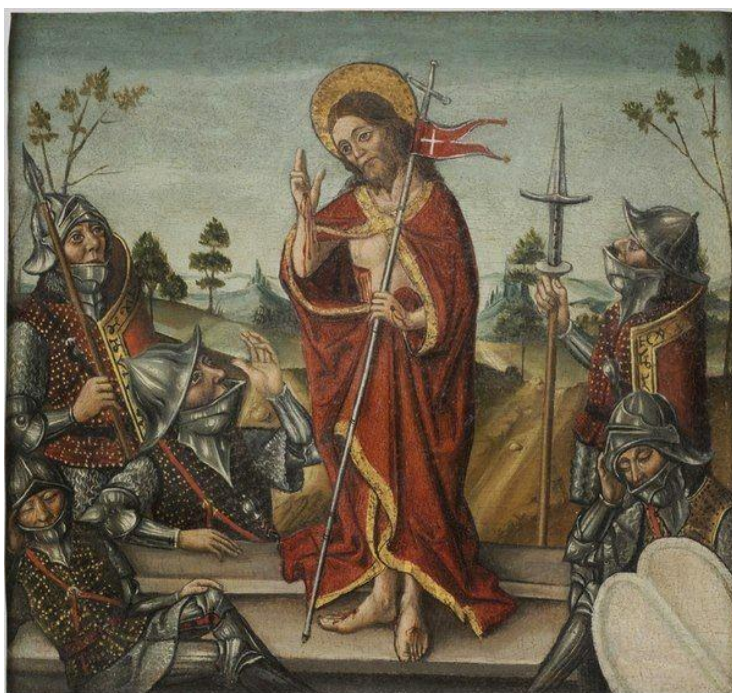
Guerrers equipats amb l'armament associat a la cavalleria jineta . La Resurrecció , segle XV, anònim, Philadelphia Museum of Art (1977-167-1043).