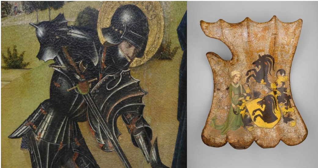
Detall del Georgsaltar (1465), fotografiat i cedit per Roel Renmans. Targa (1450) de torneig o cavalleria, Metropolitan Museum of Art (25.26.1).

identificables. Coincideixen amb el gran bacinet de Frederick III d'Habsburg guardat a l'armeria Imperial de Viena.