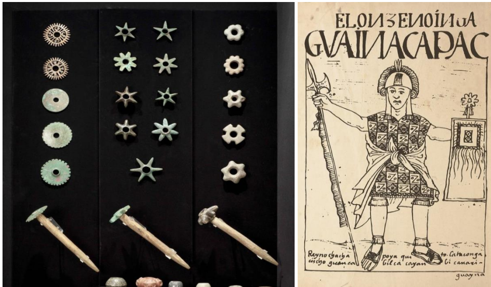
Maces Inques al llarg de la història, Museo Larco. Representació de Huayna Capac, armat amb atxa, maça (mà dreta) casc i escut. A Nueva Crónica del Buen Gobierno , (1615).

Les “porres” que anomena Cieza, estrictament parlant, haurien de descriure les maces d’aleacions de coure, plata i or, sovint forjades en forma d’estrella de 6 o 8 puntes. Aquestes peces podien estar muntades sobre pals de diverses longituds, per fer servir amb una o dues mans. Si bé Guamán Poma les descriu com armes secundàries això no implica que no fossin essencials o de gran utilitat. 47 Amb macana , Cieza pot estar descrivint qualsevol arma contundent 48 o una tipologia d’espasa o garrot de fusta presumiblement esmolada, és a dir, un arma de tall. Francisco de Xerez també parla de maces o porres, però para més atenció a les atxes, que segons ell eren més grans (que les porres) i les compara amb les alabardes. 49 Aquest arma apareix constantment als queros , en mans de soldats i comandants.