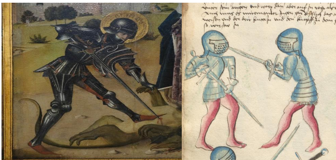
Detall del Georgsaltar (1465) fotografiat i cedit per Roel Renmans. Ampliació del foli 21v Eyb Kriegsbuch (1500) Universitätsbibliothek Erlangen-Nuremberg (MS B.26).

Fins i tot obres on el context és completament fantàstic, com la llegenda de Sant Jordi, acostumen a ser valuoses. Tenim l’exemple del “Georgsaltar” del mestre de la llegenda de Sant Jordi de Colònia. En aquesta obra el sant està equipat amb una representació perfectament rigorosa d’un model concret de l’arnès baixmedieval, però a més dona el cop de gràcia al drac amb una tècnica d’esgrima (muntar l’espasa al rest o al menys abraçar-la amb l’aixella per donar una estocada més sòlida estructuralment). Aquesta tècnica apareix escrita a varis tractats d’esgrima, com el de John Wilhalm i representada a d’altres com el Kriegsbuch de Ludwig von Eyb zum Hartensetein.