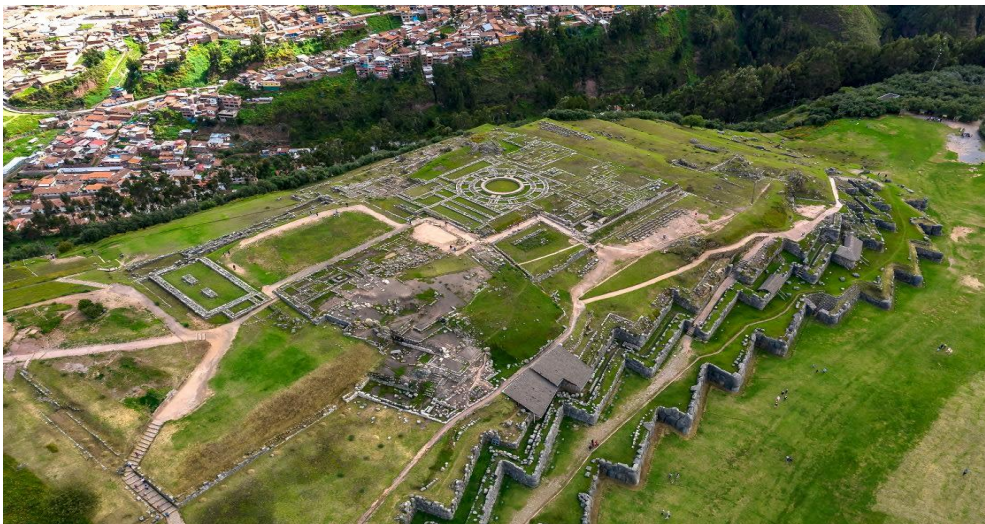
Les ruïnes del Sacsayhuamán, a prop del centre de la ciutat de Cusco.

tot si els setges no protagonitzaven les campanyes. Al llarg de tot el Tawantinsuyu, es fortificaven campaments i assentaments (sovint en cims o altres posicions de difícil accés) des dels quals s'organitzaven atacs i on s'hi refugiaven tropes en cas de necessitat. 57 Si bé podien servir com a refugi a la població civil la seva funció principal era fer de bases d'operacions. 58