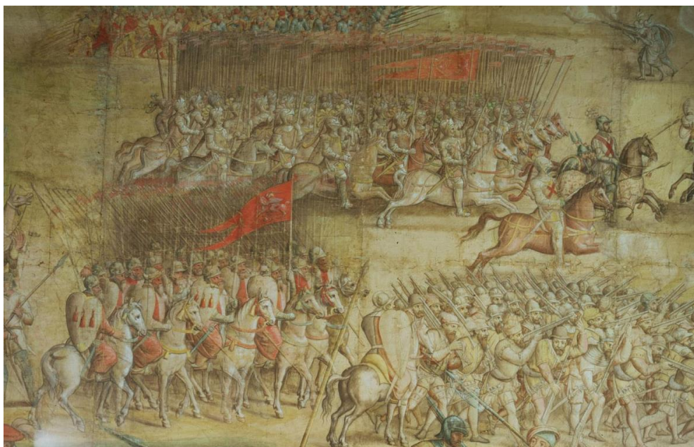
Formacions de mitjans de segle XVI, a l'esquerra un grup de cavalleria a la jineta , a sobre homes d'armes o cavalls lleugers. Feldschlacht auf dem Marsch nach Tunis , 1548-1550, Kunsthistorisches Museum .