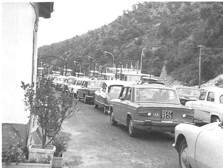
Pas dels turistes per la frontera del Portús, els anys 60.

edificacions que renuncien al territori i tenen un fort impacte visual, motivat per la necessitat de construir importants murs de contenció, a fi de salvar els forts pendents que caracteritzen la difícil geografia de la Costa Brava (Donaire, Fraguell, Mundet i Vicente, 1999).