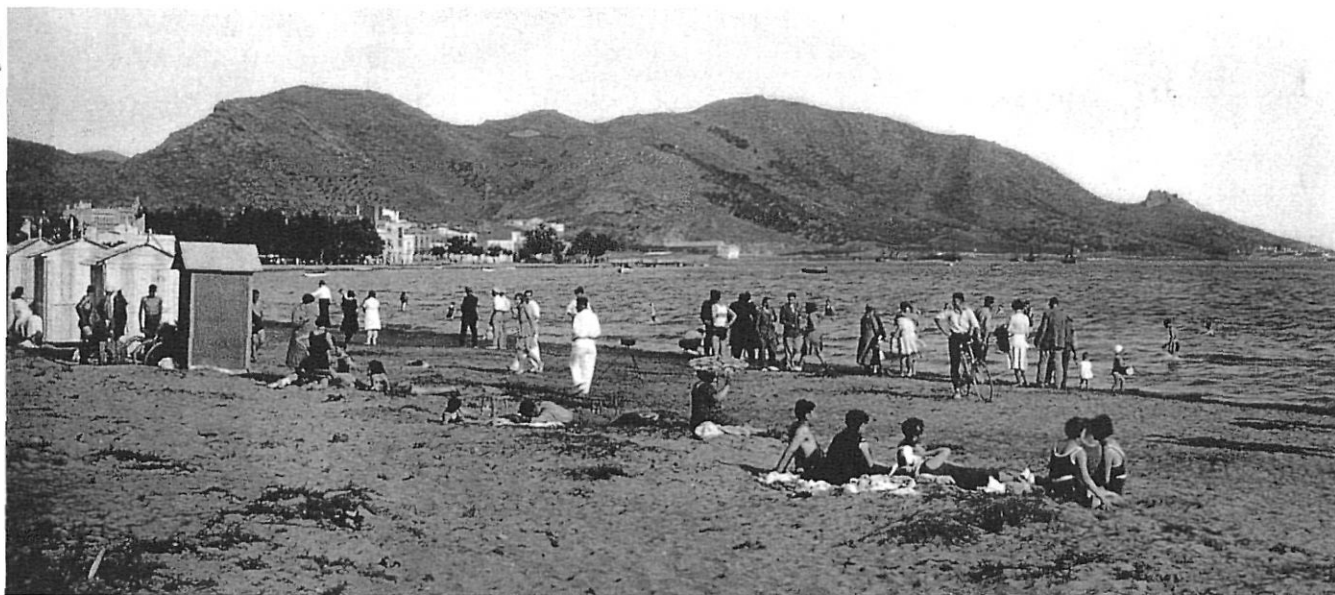
La platja de Roses, a començament de segle.