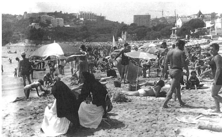
La platja de Sant Pol, de Sant Feliu de Guíxols, els anys 60.

que es diferencia clarament de l'anterior i que, a la vegada, es subdivideix en dues etapes. La primera, el fordisme artesanal, es distingeix per la improvisació i la provisionalitat de l'oferta, amb una minsa participació del capital estranger. En la segona etapa, el fordisme industrial, s'entra clarament en l'estructura capitalista internacional, a la vegada que s'agreugen totes les contradiccions que el model ha anat generant.