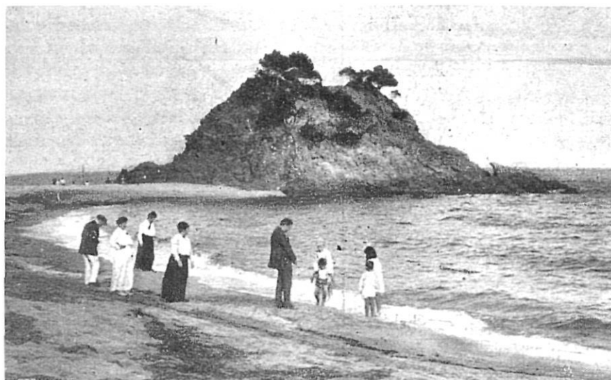
La cala Rovira, de Platja d'Aro, a començament de segle.

El model turístic que podríem anomenar com a fordisme artesanal fa la seva aparició després de la llarga postguerra, al principi de la dècada dels 50 i s'allarga fins el 1965. És important remarcar que no significa un retorn dels turistes d'abans de la Guerra Civil, sinó que comporta l'aparició d'un nou model turístic, el fordista,