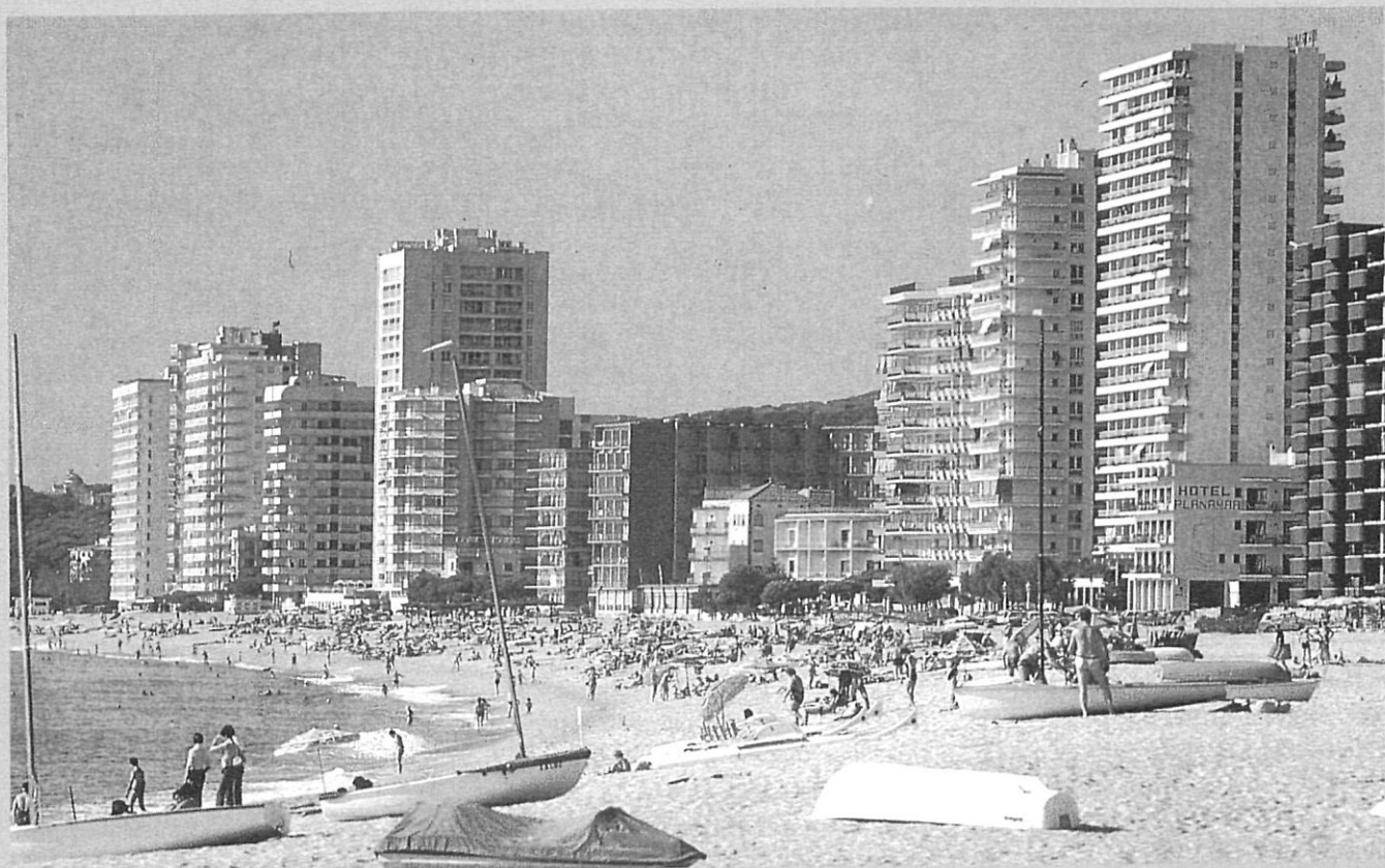
La platja gran de Platja d'Aro.