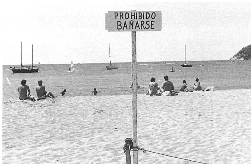
La platja de Castell, els anys 70.