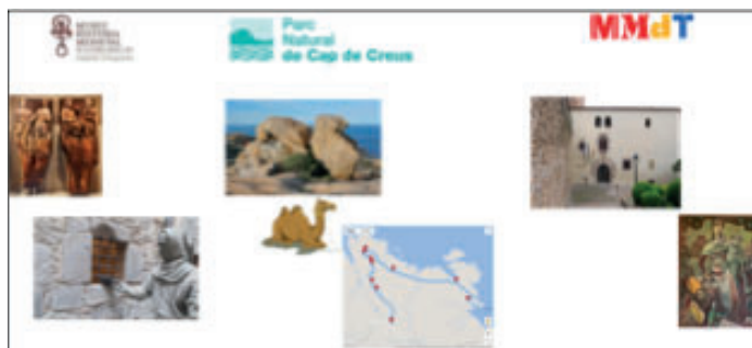
Fig. 2 Escenario de las pruebas piloto.

El objetivo de este artículo es presentar las pruebas piloto de co-creación de contenidos realizadas por expertos en patrimonio en el Museu d'Història Medieval de la Cúria-Presó, s. XIV de Castelló d'Empúries; en el Parc Natural del Cap de Creus; y en el Museu Municipal de Tossa de Mar (Fig. 2). Estas pruebas se han desarrollado dentro del proyecto PECT "Costa Brava i Pirineu de Girona: Natura, Cultura i Intel·ligència en xarxa" en colaboración con los responsables de las mencionadas instituciones patrimoniales.