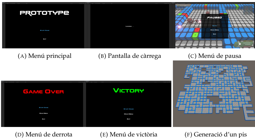
FIGURA 2: Captures de pantalla dels menús i generació del pis