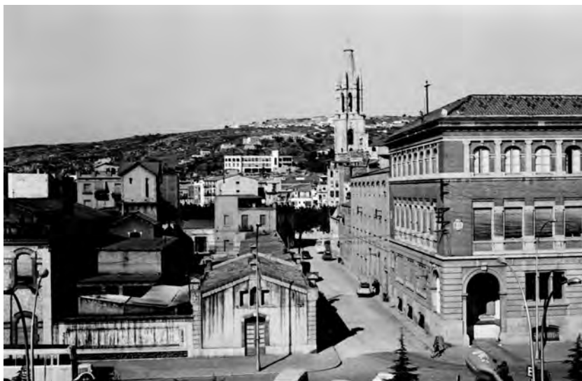
La Central Lletera Municipal, inutilitzada el dia 20 de juliol de 1936 en els aldarulls de principis de la Guerra Civil. 1966.

mesos de la guerra fins al final de la retirada afegia nous reptes humanitaris. L'estat de les infraestructures de transport i de les xarxes comercials impedí ben aviat la lliure circulació de les mercaderies imprescindibles.