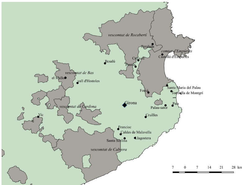
Mapa 1. Mapa d'elaboració pròpia sobre les bases Esri, USGS, NOAA.

Afegim encara que les terres patrimonials d'aquestes vescomtesses formen una ruta d'abast geogràfic reduït (mapa 1). Cal admetre que no disposem de dades precises sobre els respectius llocs de residència habitual i que, com els seus marits i el conjunt de la reialesa i l'alta noblesa, devien itinerar pels seus dominis. En qualsevol cas, el recorregut que proposa Cerverí es podria fer en un o dos dies a cavall en cada etapa, tot formant una ruta circular, tal com, d'altra banda, suggereixen les indicacions que ell mateix dona a Cortesia.