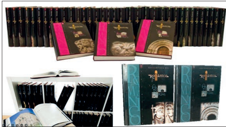
Figura 14. Enciclopedia del Románico en la Península Ibérica.