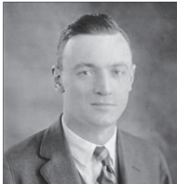
Figura 3. Kenneth John Conant

En agosto de 1927 Schapiro (*1904) (Figura 4) invirtió tres o cuatro días en investigar en el archivo y biblioteca de Silos (Williams 2003; Esterman 2009). De esa fugaz estancia acabará extrayendo un eruditísimo y sagaz artículo algunos años después (Schapiro 1939). En estas inspiradoras páginas, por