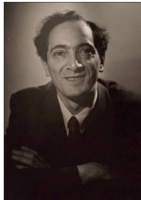
Figura 4. Meyer Schapiro

Con la contienda civil en pleno fragor, en 1938 fue publicada la primera monografía de Gaillard (*1900), cuyas tesis aparecieron ampliadas y profundizadas (1946) un año después del fin de la II Guerra Mundial. Lo cierto es que la Guerra Civil cambió el estudio de la cultura española fuera de las fronteras. Una parte muy importante de la academia internacional –con la salvedad