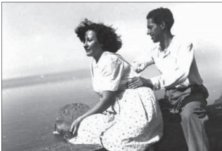
Figura 7. Juan Antonio Gaya Nuño

de la Guerra Civil y comenzó a concebir el volumen IX de la enciclopedia del arte universal, dedicado al arte de los siglos XI y XII. El libro fue publicado en 1944. Pijoan vierte allí un esfuerzo extremo y sin precedentes, solo realizable merced al acceso a las inagotables bibliotecas norteamericanas en las que había trabajado intensamente. Por primera vez un solo autor elaboraba un inventario sistemático del arte románico en todos y cada uno de los países de Europa (Pijoan 1944, VIII), contenido en seiscientas páginas y publicado en español 11 . Este enorme salto cualitativo, por su carácter realmente extraordinario, reseñado por Cook una vez sofocados los rescoldos de la Guerra (Cook 1951), no va a tener continuidad en ningún país europeo en los siguientes años.