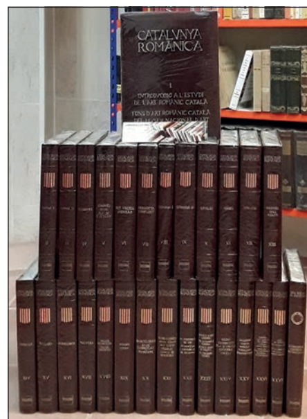
Figura 11. Catalunya Romànica. Enciclopedia