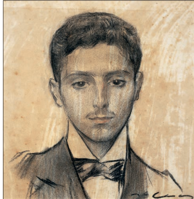
Figura 5. Josep Puig i Cadafalch