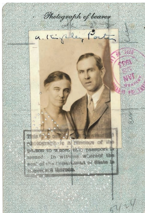
Figura 2. Arthur Kingsley Porter

comenzaba a interrogarse por la partida de nacimiento del románico mesetario (Torres Balbás 1918). Corría la segunda década del siglo XX y Porter (*1883), desde Harvard, estaba a punto de imprimir un giro copernicano en el estudio del arte románico (Porter 1918), muy particularmente el español (Brush 2018), que comportó una conocida querrela con Mâle (Porter 1919) y la historiografía francesa (Mann 1997; Olañeta 2011a).