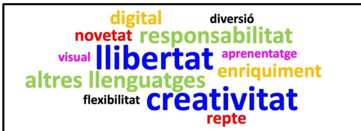
Figura 1. Nube de palabras de las categorías más importantes

A partir de aquí, si acometemos el análisis cualitativo de las respuestas ofrecidas, y focalizamos en el peso de las diferentes categorías emergentes que hemos encontrado, podemos ver en la Figura 1 lo siguiente: