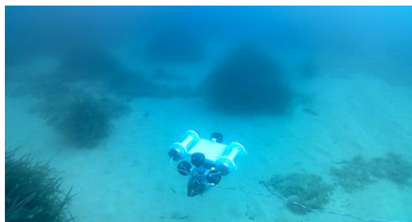
Figura 2. Prova al mar amb el Girona 25.