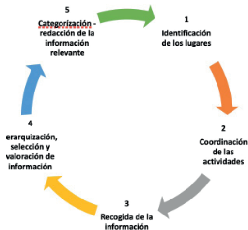
Figura 1. Diagrama de flujo que describe la etapa de recolección de información utilizando la Etnografía.

organización social de las actividades, los recursos simbólicos y materiales, y las prácticas interpretativas que caracterizan a un grupo particular de individuos”. La recogida de la información siguió el proceso que se describe, a continuación: