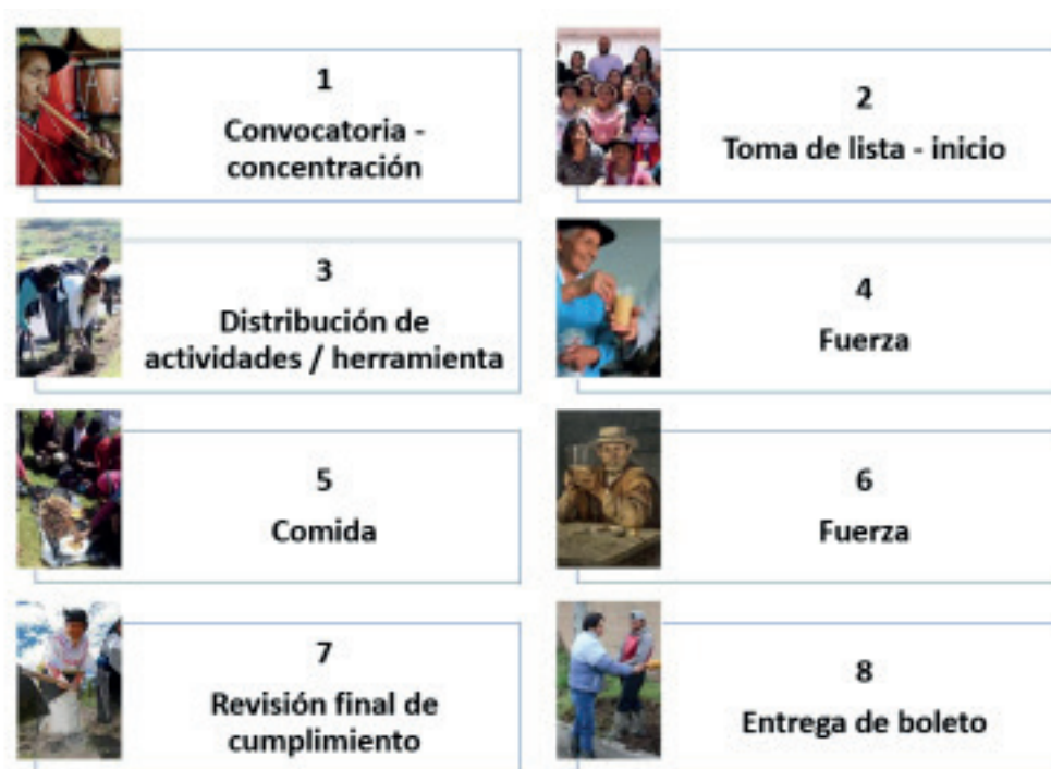
Figura 4. Hoja de ruta de la observación de la minga en Tixán y Totorillas

Sin embargo, la técnica de Observación invita a comprender las etapas que tiene como un proceso completo y continuo, de involucramiento individual y colectivo de los habitantes de las parroquias estudiadas. Se resume en la Figura 4.