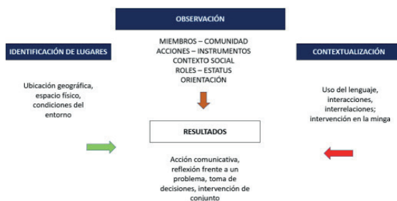
Figura 2. Diagrama de flujo que describe la etapa de recolección de información utilizando la Etnografía.

b) Observación: es comprender el comportamiento y las experiencias de las personas en su medio natural, mediante un riguroso registro de actividades evitando, en lo posible, las interferencias (Bravo, 2022). Fagundes et al. (2014, p. 75) definen a la observación participante “como una investigación caracterizada por interacciones sociales profundas entre investigador e investigado, que ocurren en el ambiente de estos y promocionan la recogida de informaciones de modo sistematizado”.