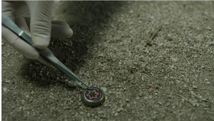
Imatge 9: Escena pista xapa (Temporada 2 La Casa De Papel)