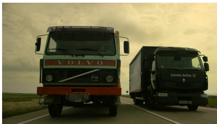
Imatge 19: Escena persecussió camions (Temporada 4 La Casa de Papel)