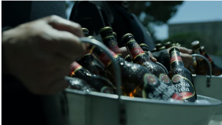
Imatge 17: Escena entrada policia (Temporada 4 La Casa de Papel)