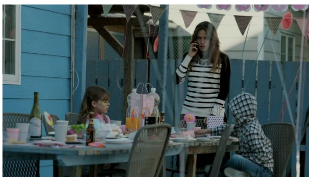
Imatge 1: Escena aniversari de la filla de l'inspectora (Temporada 1 La Casa De Papel)