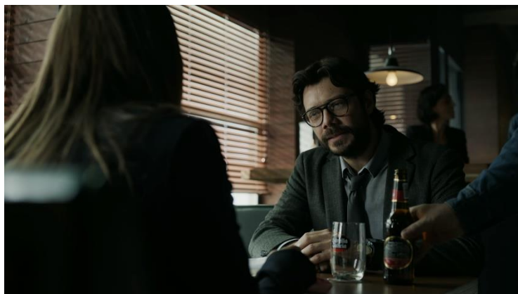
Imatge 11: Escena bar professor i inspectora (Temporada 2 La Casa De Papel)