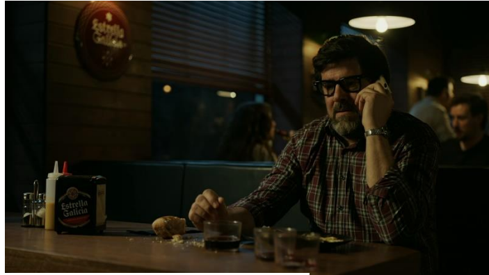
Imatge 6: Escena bar Ángel (Temporada 1 La Casa De Papel)