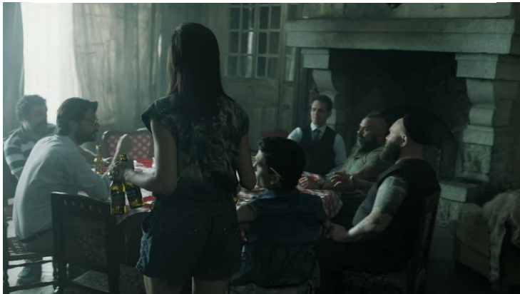
Imatge 10: Escena Nairobi reunió (Temporada 2 La Casa De Papel)