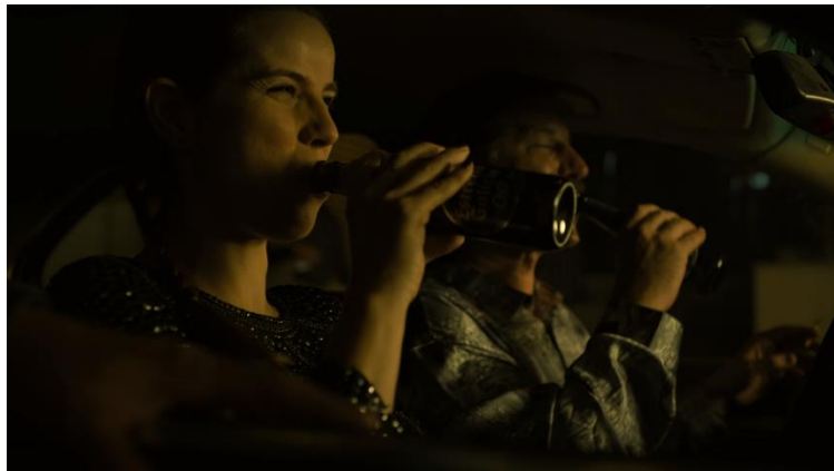
Imatge 18: Escena personatges amb ampolles de cervesa sense alcohol (Temporada 4 La Casa de Papel)