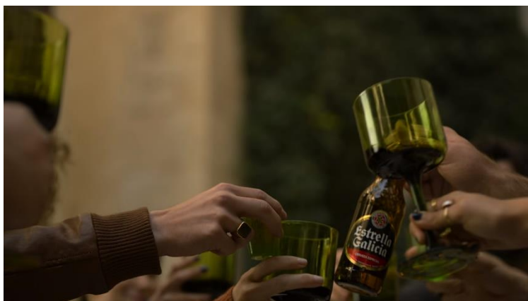
Imatge 14: Escena brindis santuari (Temporada 3 La Casa de Papel)