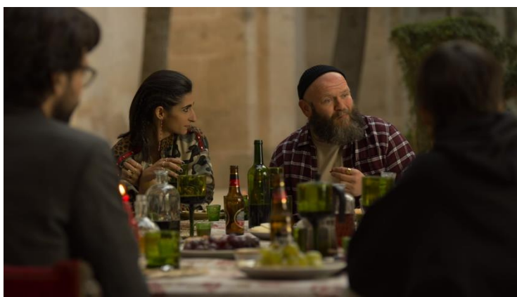
Imatge 13: Escena dinar santuari (Temporada 3 La Casa de Papel)