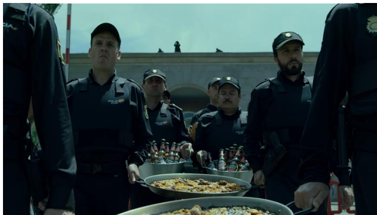
Imatge 16: Escena entrada policia (Temporada 4 La Casa de Papel)