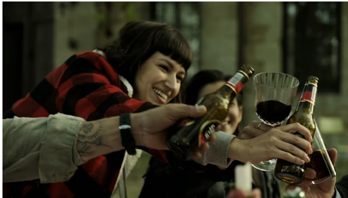
Imatge 7: Escena Tokio y altres brindant (Temporada 1 La Casa De Papel)