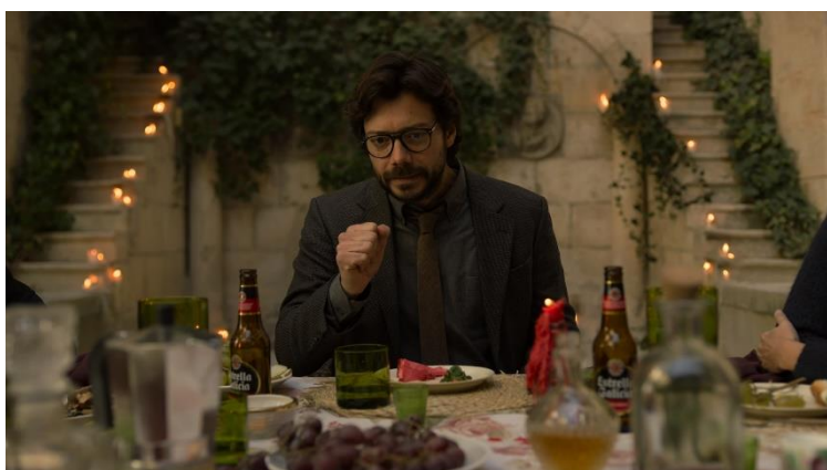
Imatge 15: Escena santuari professor (Temporada 3 La Casa de Papel)