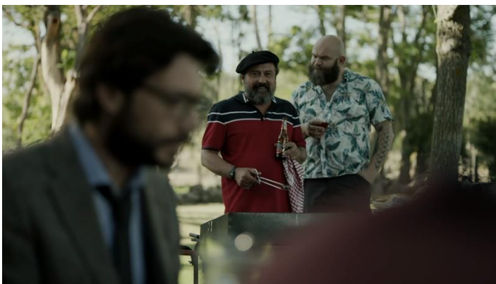
Imatge 8: Escena Moscú amb ampolla Estrella Galicia (Temporada 1 La Casa De Papel)