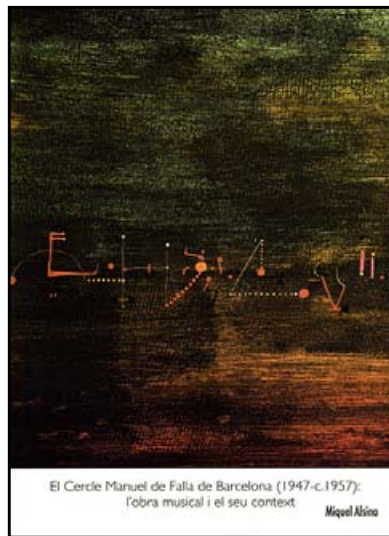
El Cercle Manuel de Falla de Barcelona (1947-c.1957): l'obra musical i el seu context

Així comença el pròleg de La força d'existir , el darrer llibre del filòsof francès Michel Onfray; un pròleg d'una quarantena de pàgines en les quals l'autor reviu els anys dolorosos de la