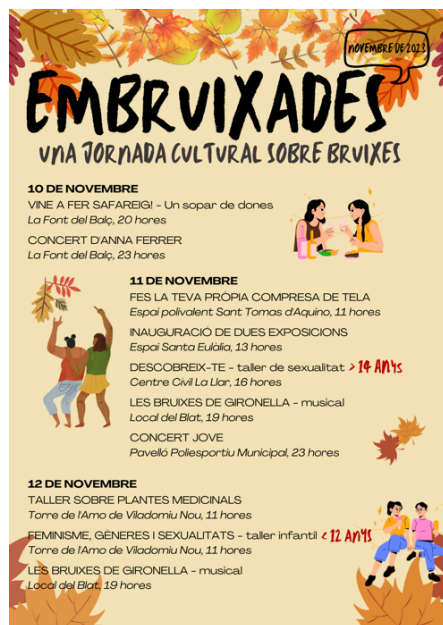
Imatge 2: Cartell principal de la jornada