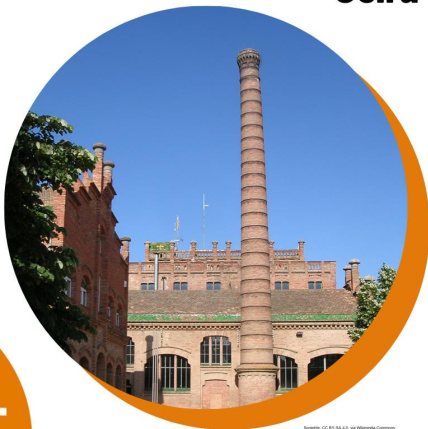
Sonkette, CC-BY-SA 4.0, via Wikimedia Commons