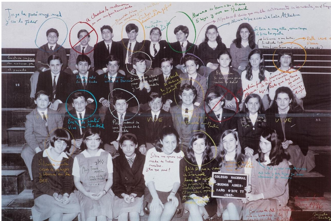
Figura 3. Buena memoria, 1994 de Marcelo Brodsky. CPM. Museo de Arte y Memoria

insereix sobre el blanc i negre una gamma de colors vius, els quals atorguen veu a les imatges mudes. Sobre els pigments grisos es troba un missatge, bafarades, cercles, paraules...; el cromatisme de l'obra dibuixa el missatge que vol transmetre. La sèrie Buena Memoria comença amb la imatge d'una classe de primer curs de secundària, de l'any 1967, on l'autor és un dels protagonistes, acompanyat dels seus companys i companyes. A sobre dels rostres, Brodsky descriu que ha passat amb cadascuna de les vides que configuren la imatge, després de la repressió militar de la Junta. Cada persona té inserit un futur, menys tres, els quals un cercle amb una línia transversal els tapa els rostres: són mortes, la dictadura els va prendre la vida. El missatge és clar, la interpretació és personal, però la veritat, la memòria s'hi troben representades.