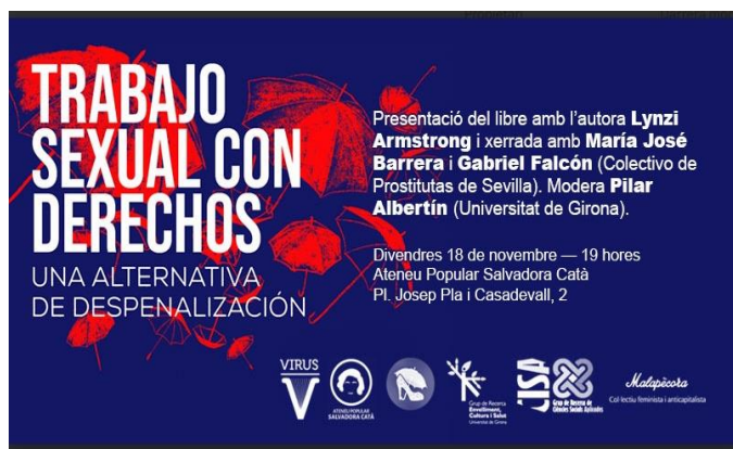
Gràfica 4: Presentació del llibre

-Organització de la Presentació del llibre: Gillian Abel y Lynzi Armstrong (2022). Trabajo sexual con derechos. Una alternativa de despenalización . Barcelona: Virus, que es va realitzar amb col·laboració de l'editorial, del Col·lectiu de Prostitutas de Sevilla, de l'Ateneu Salvadora Catà de Girona i el grup feminista Malapècora, així com la participació de la UdG. Va ser un acte comunitari realitzat a Girona.