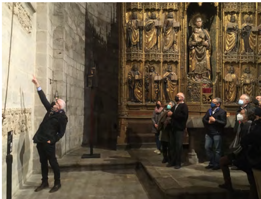
Fig. 2: L'itinerari o visita dels sarcòfags pagans i paleocristians del presbiteri de Sant Feliu.