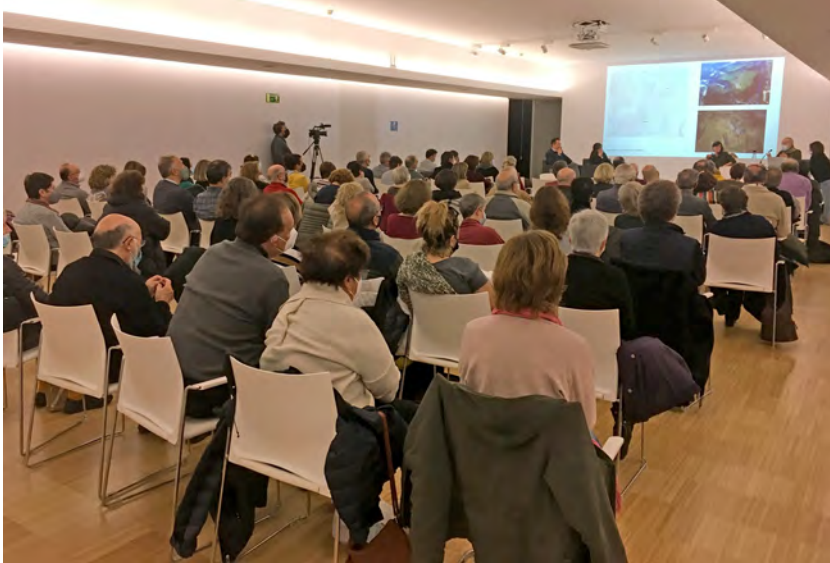
Fig. 5: Aspecte de la sala en una de les conferències sobre Arqueologia Urbana.