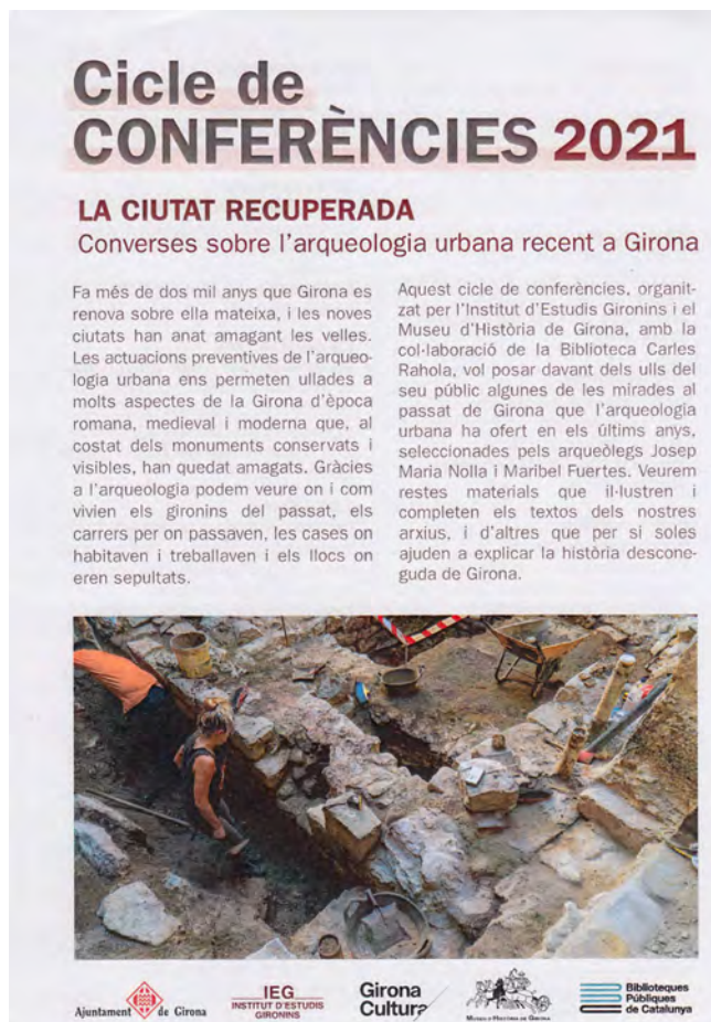
Fig. 3: Fulletó del cycle de conferències «La ciutat recuperada» .