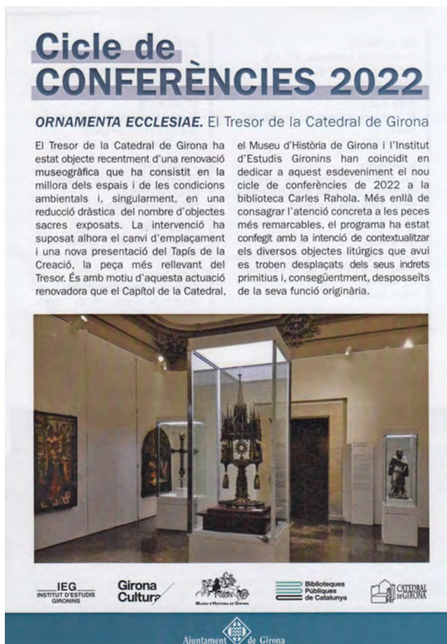
Fig. 4: Fulletó del cicle de conferències «Ornamenta ecclesiae».

24 de maig: Pintures sobre taula i brodats d'època gòtica , per Rafael Cornudella.