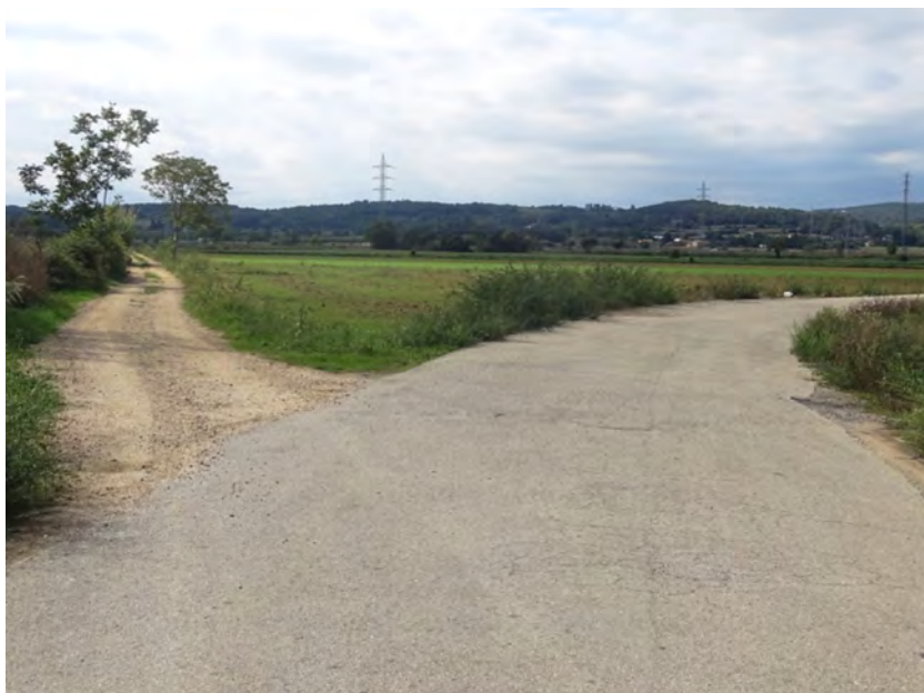
Figura 4. Bifurcació després de la rotonda. La branca de la dreta és el camí de Montfullà, també conegut com el camí dels Carlins.

d'afrontació de peces de terra 7 . Al bosc de la Maçana s'ajunta amb la carretera de Vilablareix a Salt amb la qual comparteix el traçat fins a la carretera del Perelló al temple parroquial. No passa, per tant, ben bé al costat de l'església, que queda a uns 100 metres a la banda de ponent.