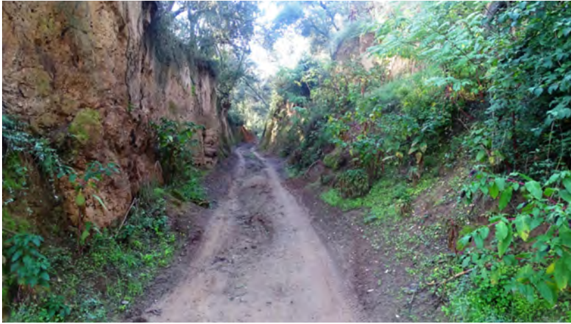
Figura 6. Camí fondo passat cal Curt.

banda esquerra. A l'altura de can Talaia de Baix girava a la dreta, travessava la carretera i entrava al nucli urbà. Pujava per l'actual carrer de les Escoles fins a la plaça de la Constitució, situada al davant de l'església (cf. figura 7).