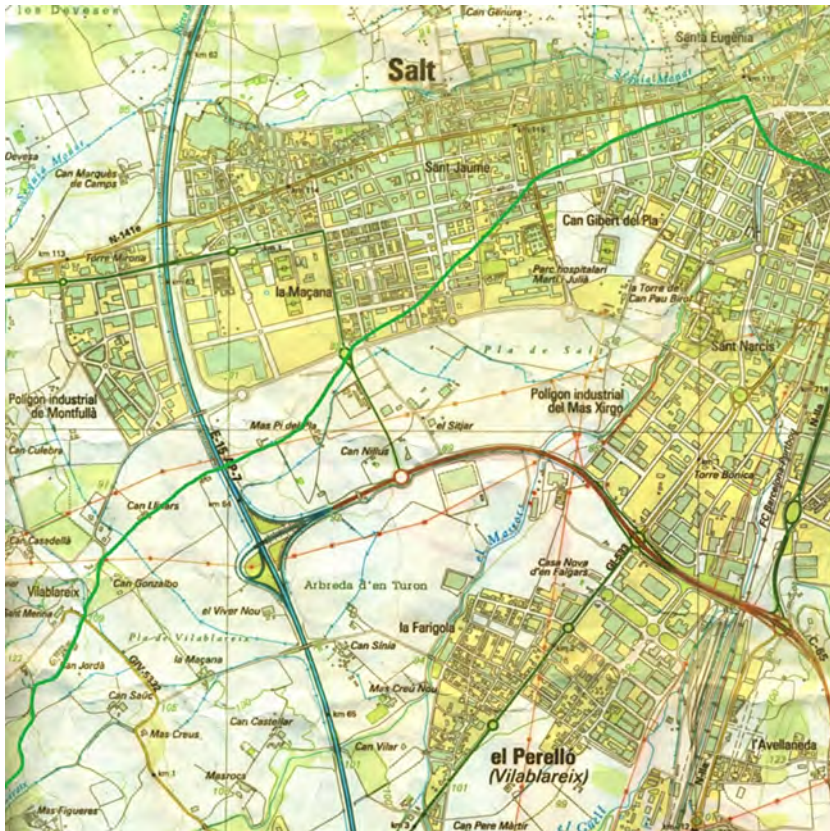
Figura 2. Traçat des de l'antic pont del Dimoni a Vilablareix.

només camps i horts. Entra al municipi de Salt per l'actual carrer de Mn. Sebastià Puig. Tampoc aquí no hi havia edificacions, fora de can Mota i can Pou, situades al peu mateix, a la banda de ponent (cf. figura 3). A partir d'aquí, rec i camí han quedat sota carrers i edificacions fins a l'altra banda de l'avinguda de la Pau on es creuava amb el camí del Sitjar 5 . El pas del camí de Vilablareix per aquest indret ja el trobem documentat l'any 1184, es tracta de l'establiment fet pel monestir de Sant Daniel als Sitjar, senyors del mas homònim, d'una feixa en el pla de Salt, que afrontava a orient amb