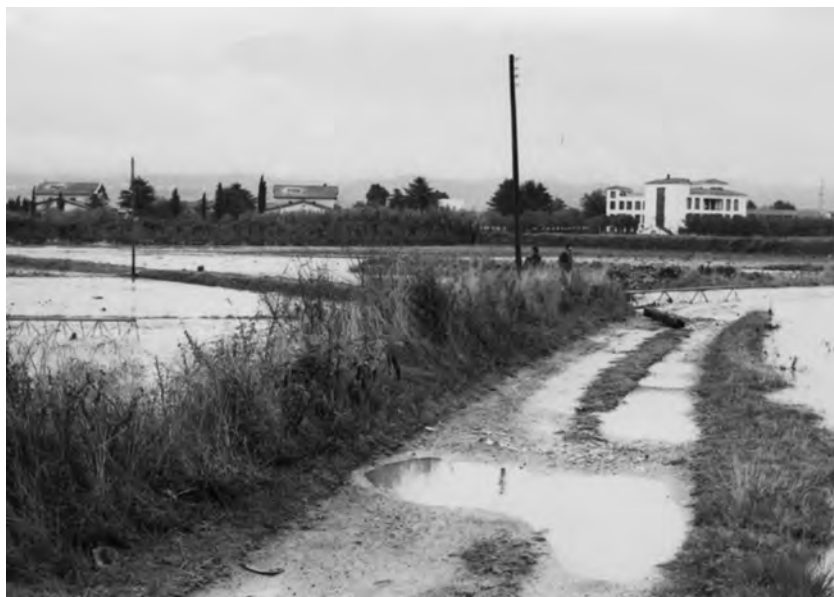
Figura 1. Prolongació del carrer del Doctor Ferran, en direcció sud cap a la zona del Pla de la Maçana, inundat pel desbordament de la Maçana (1971-09-20)