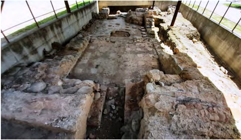
Figura 9. Vil·la romana de Vilablareix.

nou” durant un cert temps, fins que el segon va substituir definitivament el primer 11 . Si bé la distància dels dos fins a Aiguaviva és, aproximadament, la mateixa –6,5 kilòmetres–, el que passa pel Perelló és de més bon fer (cf. figura 8).