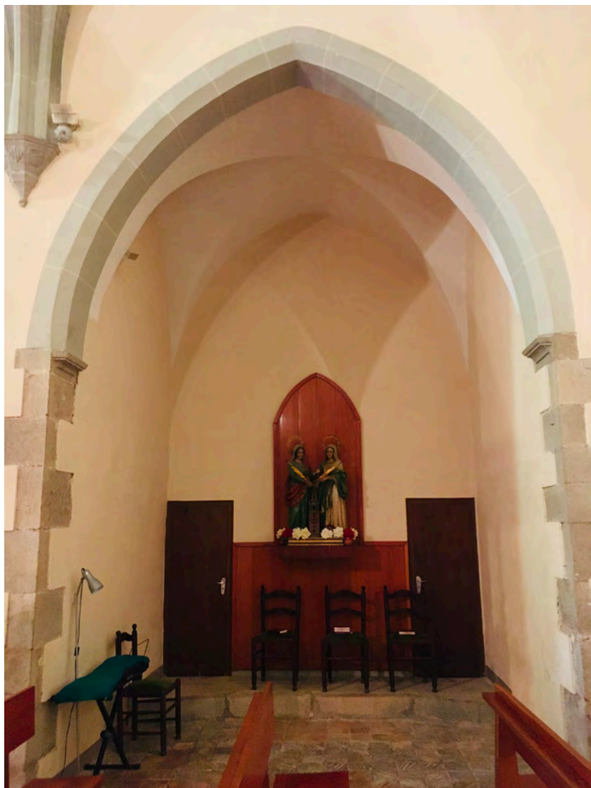
Fig. 4 Capella de les Santes Justa i Rufina en l'estat actual.

el que deixen de comptant a la caixa, en alguna ocasió detallen les despeses.