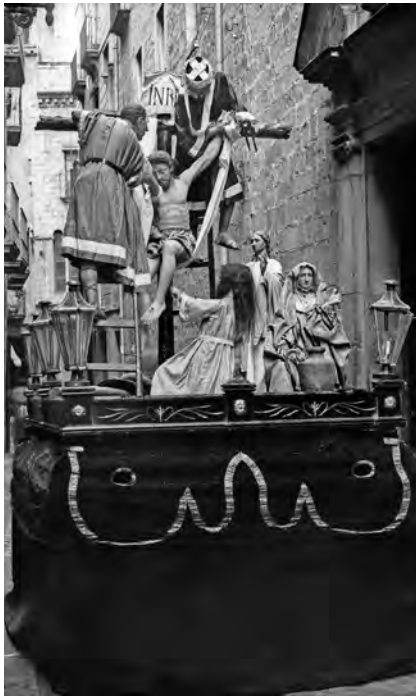
Figura 6. Pas del Davallament , 1920, (església de l'antic convent del Carme de Girona), Fotografia: Valentí Fargnoli, Arxiu Mas-C34246.