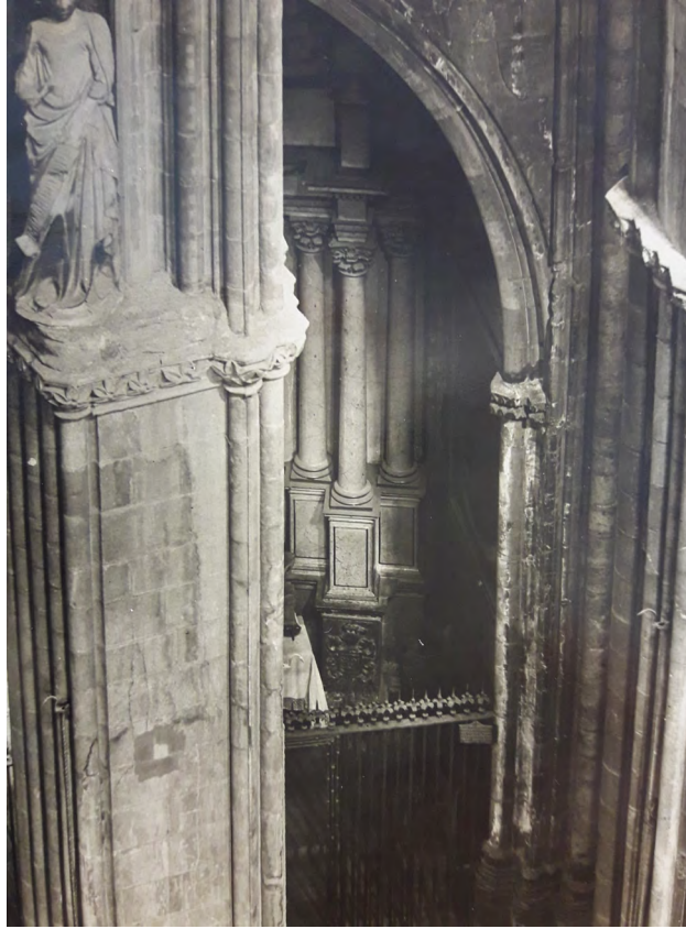
Figura 5. Vista parcial de la capella del Roser de la catedral de Girona amb l'antic retaule.

los campers de color de blau fi de smalt”. El termini d’execució s’acabava per la festa de Tots Sants –1 de novembre–, i havia de ser reconegut per “dos personas pràcticas y expertas, y si acars dita obra no hi haurà tara, pugan a gastos y despeses de dit Croses fer-la refer y adobar retenint-se de la quantitat baix escrita lo que aqueix respecte se gastarà”. El preu convingut eren 45 lliures –en dues pagues: la primera amb 15 lliures, i l’última de 30 lliures–, en les quals s’inclòia el transport del sagrari amb l’aportació del “sr. rector y Miquel Terrats [de] dos cavalcaduras per aportar-lo ay allí se haze de fer la dita regonexensa y visura de aquell, y si acàs se gastave per lo camó o faltave alguna cosa en la perficció de dita obra corre per compte de dit Crosas y a gastos seus com dalt està dit ho pugan fer refer y adobar”. 38