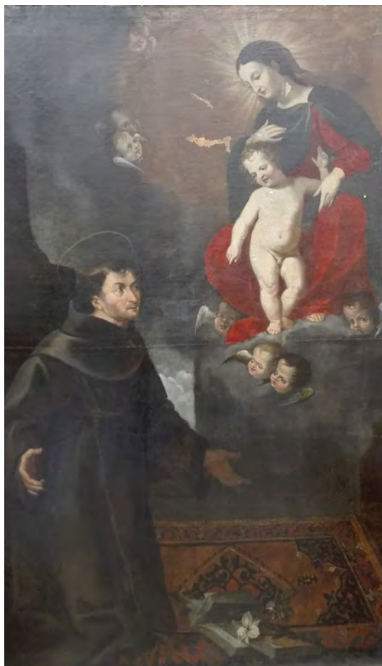
Figura 4. Anònim català, Aparició de la Mare de Déu a Sant Antoni, catedral de Girona.