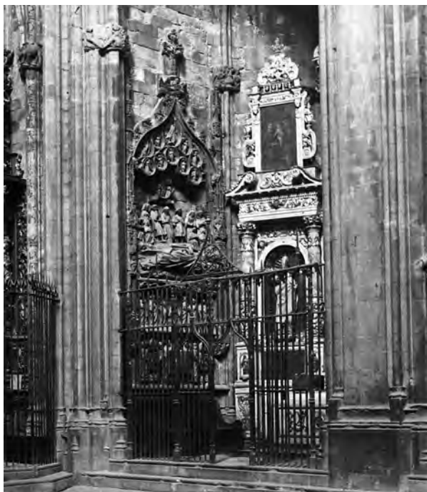
Figura 16 i 16a. Pau Sunyer (atribuït), Retaulle de la capella de Sant Pau , Catedral de Girona (perdut). Fotografia: Arxiu Mas, referència 04384007.