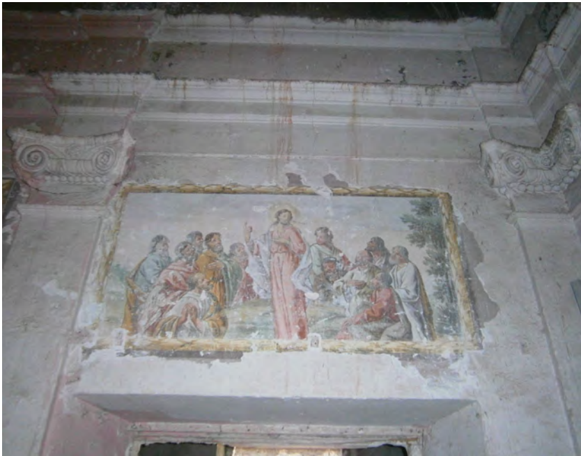
Figura 8 i 8a. Vista general de la capella i de l'interior del cambril de la capella del Roser del convent de Sant Domènec de Girona.