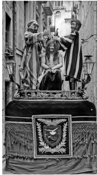
Figura 7. Pas de la Coronació d'Espines , 1920, (església de l'antic convent del Carme), Fotografia: Valentí Fargnoli, Arxiu Mas-C34245.

La confraria de la Puríssima Sang de Jesucrist s'havia establert a Girona el 5 de setembre de 1566 a la capella de Sant Miquel del claustre del convent del Carme; al cap de dos anys ja organitzava la solemne processó del Sant Enterrament durant el dijous de la Setmana Santa ( figura 6 ). Els gremis i les confraries devocionals van ser convidats a participar-hi. 42 Sabem que dues d'elles, segons decisió de la junta, havien decidit construir els seus passos o misteris; malauradament no sabem quins artesans –fusters o escultors– les realitzaren, en el cas que es fessin contractes notariais. El 26 de febrer de 1649 la confraria del Roser del convent de Sant Domènec –que un dia abans