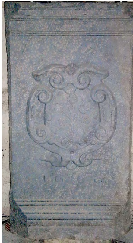
Figura 14. Joan Cisterna, Fragment del pedestal de l'antic retaule major de la capella del Roser, cambril de la capella.

o goigs –el número tradicional de goigs rosarians, com és sabut, era de quinze, organitzats en misteris de dolor, goig i glòria–. El primer cos, articulat per columnes d'ordre corinti vinyollesc de setze pams –a efectes pràctics vol dir que tots els elements de l'ordre hi són representats– dibuixaven un total de cinc carrers amb quatre plafons per als relleus i una pastera central, de 12 pams, per encabir-hi la talla de la Mare de Déu. Aquest primer cos constava de deu columnes amb les respectives pilastres projectades al rerepillar (traspilastres) i estípits entre les columnes i els relleus (soportals antropomorfs). Com passa a Tiana, les columnes devien aparèixer de tres en tres a cada banda del nínxol central i només d'una en una en els restants carrers. El segon cos, de proporció més reduïda –ara l'ordre disminueix a 11 pams– presentava una peculiaritat