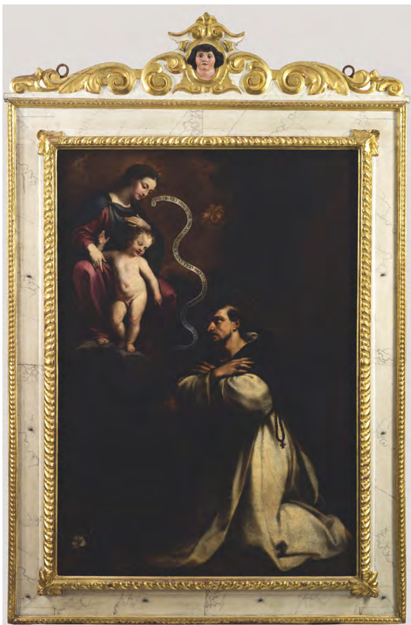
Figura 3. Escola espanyola (Juan Carreño de Miranda?), Aparició de la Mare de Déu a Sant Jacint, catedral de Girona.