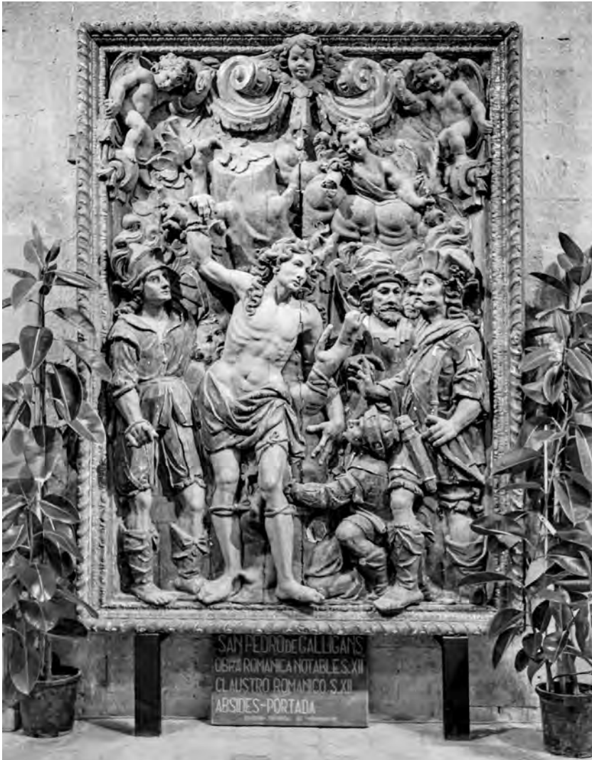
Figura 15. Josep Tramulles (escultura) Josep Duberós (policromia), Martiri de sant Sebastià (exvot contra la pesta), Museu Arqueològic de Girona a Sant Pere de Galligants.

Nou de Santa Caterina i des d'allí a Sant Pere de Galligants (figura 15) i a l'actual Museu d'Art de Girona, que l'ha restaurat permetent apreciar la rica dauradura aplicada per Josep Duberós. 67