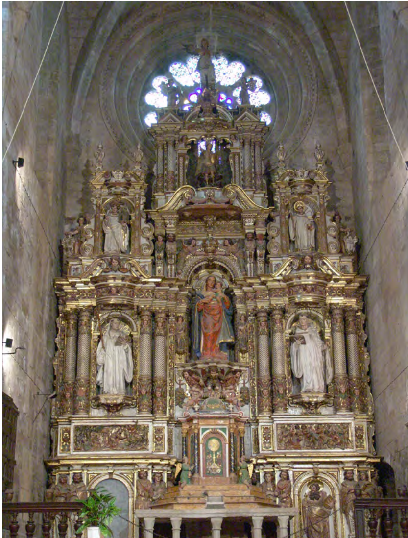
Figura 11. Josep Tramulles, Retaule major del monestir de Santes Creus .

imaginaire. El fuster o “arquitector”, en aquest cas, s’ocupava de l’execució de l’arquitectura del retaule i dels elements decoratius d’aquest, per a l’ocasió servint-se de la gramàtica vignolesca dels ordres clàssics i dels repertoris ornamentals dissenyats per Tramulles. Com es veurà, alguns dels elements formen part del repertori habitual de l’escultor en obres cabdals