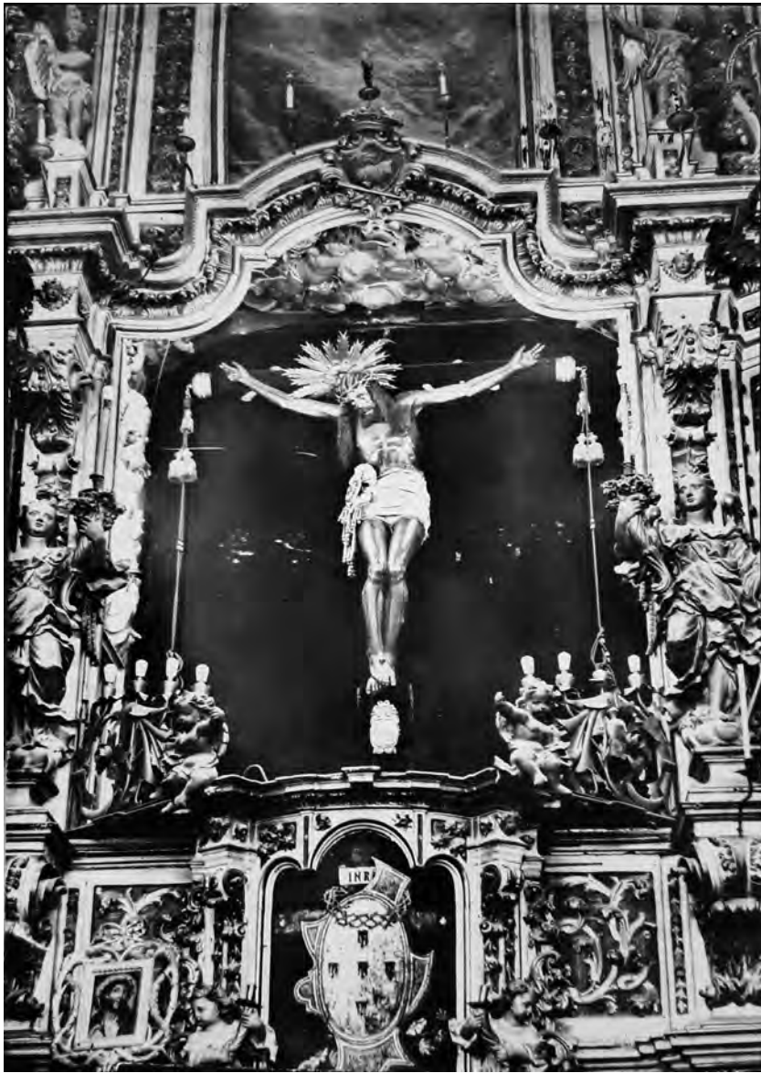
Figura 2. Crist de l'arxiconfraria de la Passió i Mort (església del convent del Carme de Girona), Fotografia: MAC-Girona.

és de 120 lliures –amb una paga inicial de 52 lliures i 10 sous, i la resta un cop s'hagués lliurat el retaule–, i el termini de fabricació i col·locació del retaule és el Nadal de 1647.