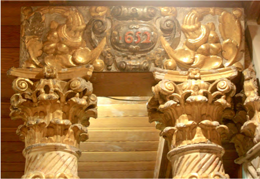
Figura 18. Fragment de fris del retaule de la capella de Sant Pau de la catedral de Girona, avui a la Fundació Mauri de La Garriga.

conserven un grup de dues columnes, petits fragments de frisos amb caps de minyons i una cartel·la amb la data inscrita de 1652 (figura 18). L'estil dels elements de la talla, la robustesa naturalista de l'escultura del sant Papa del nínxol lateral, i el fet que la vídua de Dídac de çarriera contractés Pau Sunyer per al sepulcre són arguments de pes per atribuir-li també aquest retaule desaparegut de la catedral de Girona.