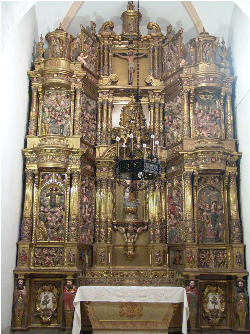
Figura 10. Josep Tramulles, Retaule major de Sant Cebrià de Tiana , Fotografia: Joan Bosch.

subcontractació de Josep Tramulles al fuster Joan Cisterna, tan ric en detalls com el primer document i serveix, també, per comprendre el funcionament d'aquest tipus de contractes en els quals l'escultor s'encarregava de la part de disseny de l'obra, mostrada mitjançant una o més traces i "rasgunyos", i de les imatges de "bulto; és a dir, allò tocant pròpiament a l'ofici d'un