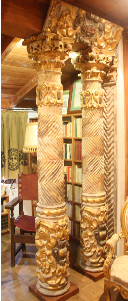
Figura 17. Columnes del retaule de la capella de Sant Pau de la catedral de Girona, avui a la Fundació Mauri de La Garriga.

rava hereu espiritual. 71 D'aquell retaule, sor-tosament, se'n conser-ven alguns elements i alguna imatge molt poc coneguda en la qual es pot entreveure una part de la seva composició, que alternava elements escultòrics i pintura de tela en una arquitectura d'inspiració vinyolesca (figura 16). Els caractèrístics fusts de les columnes d'estries en zig-zag que s'aprecien a la imatge, amb el terç inferior esculat, han permès identificar-les a la Fundació Mauri de la Garriga (figura 17), que conserva un conjunt d'elements provinents de la catedral, entre els quals una part significativa del cor medieval. D'aquest retaule se'n