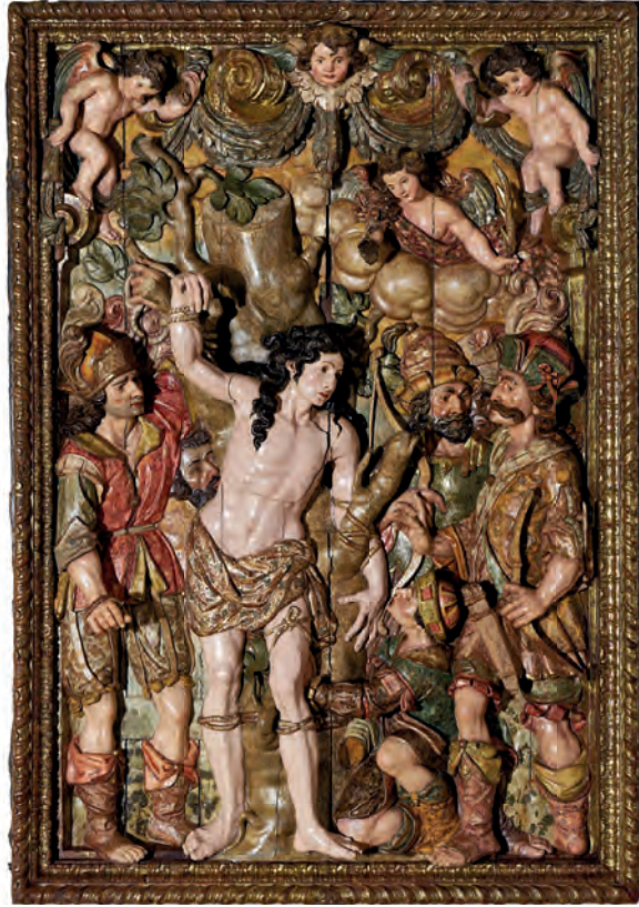
Figura 9. Josep Tramulles (escultura) Josep Duberós (policromia), Martiri de Sant Sebastià (exvot contra la pesta), Museu d'Art de Girona. Núm. reg. 251.709 Fons d'Art Diputació de Girona.

de l'arquitectura del fustam, que havia de seguir els prestigiosos models de Jacopo Barozzi da Vignola del tractat de les Regole ( Regles dels cinc ordres d'arquitectura , 1562). Tramulles ja havia construït un altre retaule dedicat a la Mare de Déu del Roser a l'església parroquial de Sant Cebrià de Tiana (1645-1655) i poc després faria, segurament per la bona acollida del present, el de Sant Sebastià de l'església del Carme de Girona pagat per la ciutat com a exvot contra la pesta (figura 9).