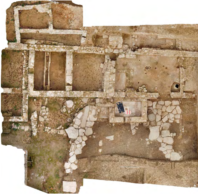
Fig.3. Ortofotografia del sector nord de la vil·la del Pla de l'Horta (Sarrià de Ter).

va amortitzar el que ara sabem que eren una combinació de tres dipòsits que estarien connectats entre ells i que, el que es troba més al sud i el següent dipòsit immediatament al nord d'aquest, van ser tallats i amortitzats per la següent fase constructiva. Els nivells d'abandó i els materials (terra sigil·lada africana A) trobats a l'interior del dipòsit situat més al sud ens indiquen un moment a finals del segle II de la nostra era. Aquest conjunt de dipòsits pertanyents a, com a mínim, dues fases constructives, s'assenten sobre un enllosat de grans dimensions que fou amortitzat al moment final de la vil·la. Per bé que tenim ben fixat el moment final del jaciment romà (finals del segle IV després de la nostra era), els nivells d'abandó sempre ofereixen materials que demostren freqüentacions de la zona i és on trobem materials tals com ceràmiques paleocristianes i fins i tot ceràmica grollera carolíngia, fet que ens trasllada des de finals del segle IV fins als segles V i VI de la nostra era.