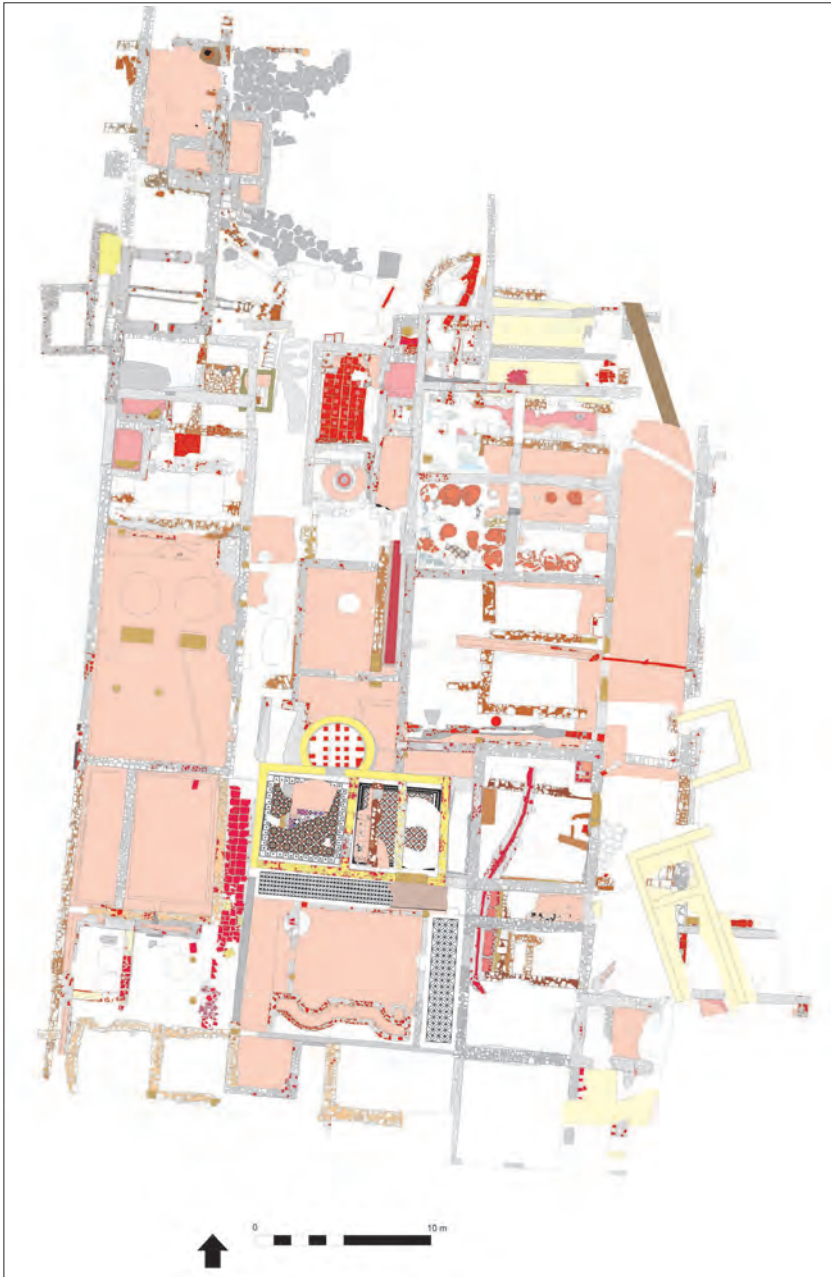
Fig. 1. Planta general de la vil·la del Pla de l'Horta (Sarrià de Ter).