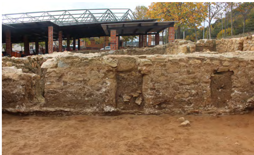
Fig. 4. Vista des del nord del mur que limita pel sud l'Àmbit 62.

En aquest cas es tracta d'un as emporità (moneda 1), un antoninià (moneda 2) i un radiat a nom de Maximià (moneda 3). En tractar-se de nivell d'abandó i remocions possiblement posteriors, es fa difícil en aquest cas datar l'estratigrafia de manera concisa i, a més, les monedes estan en cronologies que ja queden contingudes en l'espectre general del jaciment, de tal manera que aporten en aquest cas poca informació arqueològica. Evidentment, en estudis quantitius o que incideixin en altres aspectes la documentació d'aquestes peces, serà també remarcable però no és el cas del treball que plantegem aquí.