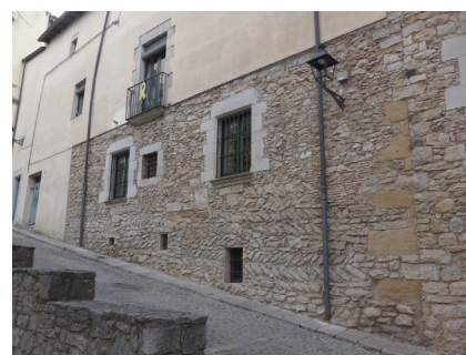
Figura 4. Actual plaça dels Lledoners, costat de migdia. Mur in situ d' opus spicatum d'un edifici alt-medieval.

De l'antic casal que la comtessa Ermessenda i son fill donaren a Santa Maria el 1020 ( supra ) se'n conserven vestigis suficients com per poder-se'n fer algunes idees sobre les seves peculiaritats. La part conservada dibuixaria un cos rectangular d'uns 28 m de llargària (nord-sud) amb una amplada desconeguda amb seguretat, però que podria aproximar-se als 8-9 m, amb murs d'excel·lent factura, molt gruixuts, a base de petits macs definint filades rectes. Conserva, al mur de ponent que dona a la galeria est del claustre actual, dues finestres de mig punt de doble esqueixada, a 4 m d'alçada del paviment actual, i no hi ha indicis segurs d'on se situaria una possible porta. No hi podríem veure l'estança noble il·luminada per aquelles (i altres) finestres, bastida damunt d'un celler o rebost que ocuparia el nivell inferior més aviat irregular per l'accés natural del subsol geològic en direcció a llevant? La documentació posterior sembla deixar clar que la coberta no seria de volta (Sureda 2008, 607-609).