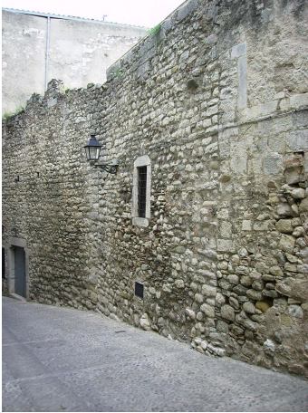
Figura 5. Façana meridional de l'edifici del segle XI del carrer Rocabertí / jardí del Museu d'Art.

Així doncs, aquell edifici senyorial s'alineava perfectament al vell decumanus que ha estat substituït pel carrer de Rocabertí i, per l'altra banda, ho faria amb un altre decumanus que surt esmentat amb el nom de carreró del Palau a la baixa edat mitjana (Canal et al. 1998, 43) i, per llevant, amb un cardo minor . Tindria la façana principal a llevant i a ponent hi hauria un pati, una curtis . Una escala exterior facilitaria l'accés a la sala principal, obrada damunt la volta. L'existència d'un badiu no és altra cosa que una possibilitat. L'estança coberta podria haver funcionat de celler. No tenim cap notícia de qui en fou propietari. Segons M. Sureda, des de ben aviat hauria estat d'un clergue d'alt nivell que cercaria la proximitat al conjunt episcopal.