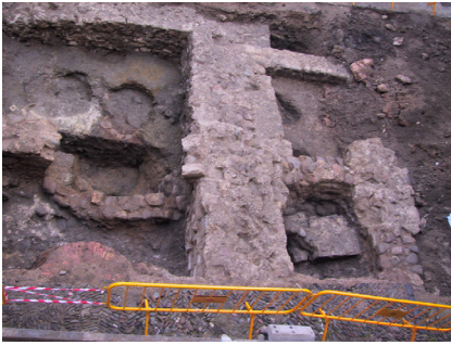
Figura 3. Actual plaça de la Catedral. Excavacions del palau del comes ciuitatis . Es poden observar algunes sitges del cellarium de la fase alt-medieval.

de celler, amb desenes de sitges obrades al subsol (Canal et al. 2010, 227-229, fig. 3). Hem proposat, a tall d'hipòtesi, que la concentració de cellaria en aquell sector podria ser conseqüència de l'aprofitament dels criptopòrtics forals que haurien fet servir els constructors per salvar els pregons desnivells naturals d'aquell sector de la ciutat 20 .