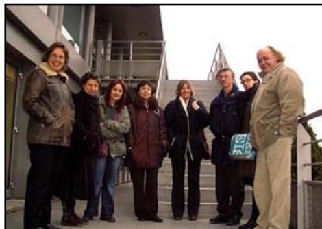
El grup de la UdG durant la visita a l'INSA (Institut Nacional de Ciències Aplicades) de la Universitat de Tolosa de Llenguadoc