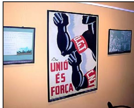
Una de les imatges de l'exposició

Es va poder visitar a la sala d'actes de la FEP del 15 de març al 16 d'abril. L'exposició va anar acompanyada d'altres actes: el mateix 15 de març es va celebrar l'acte acadèmic "La República i el magisteri", a càrrec de Salomó