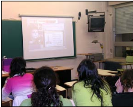
Un moment de la videoconferència