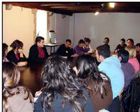
Imatge del Col·loqui al Palau dels Reis de Mallorca

Un any més, els estudiants de francès dels Estudis de Mestre van fer una sortida a Perpinyà en el marc de l'assignatura Idioma estranger i la seva didàctica (francès). Va ser