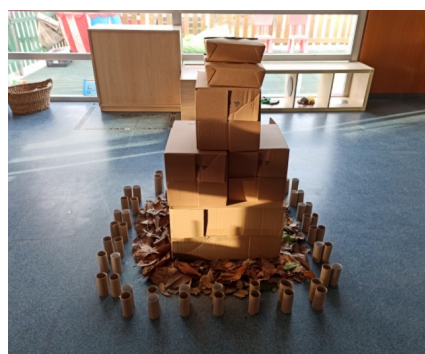
Imatge 3: Instal·lació de material inespecífic i monocromàtic

La tercera instal·lació la vaig voler enfocar en la temàtica de material inespecífic i monocromàtic per veure si el fet de no haver-hi colors vius afectava l'experimentació dels infants i al seu interès. Primerament, tal com les altres instal·lacions, vaig buidar els mobles i estímuls innecessaris i vaig col·locar els materials de la instal·lació. Aquest cop, vaig posar les fulles i els