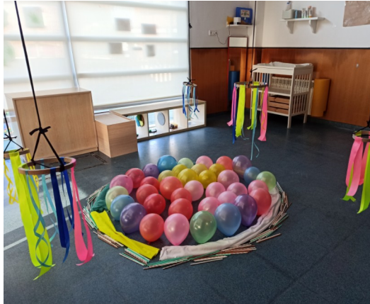
Imatge 2: Instal·lació del buf

La instal·lació és una proposta molt lliure, però amb alguns objectius concrets que en aquest cas s'han complert, ja que els infants han reconegut els objectes, han sabut comunicar tant amb gestos com amb petites paraules les seves adquisicions, i han sabut identificar on hi havia llum, entre altres.