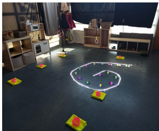
Imatge 1: Instal·lació llum i foscor

La primera instal·lació estava pensada per treballar la llum i la foscor a l'aula, amb materials que tenien llum pròpia com les llumetes LED i amb objectes que brillessin a la foscor. En primer lloc, tal com vaig plasmar a la fitxa d'activitat, vaig buidar la classe dels estímuls innecessaris i vaig reorganitzar els mobles. A més, vaig tapar les finestres amb teles fosques, ja que a