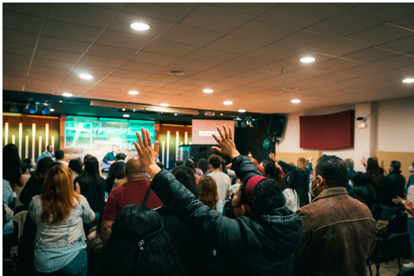
Una fidel evangèlica canta durant la pregària inicial al CCFEAM. Salt, 10 d'abril de 2022.