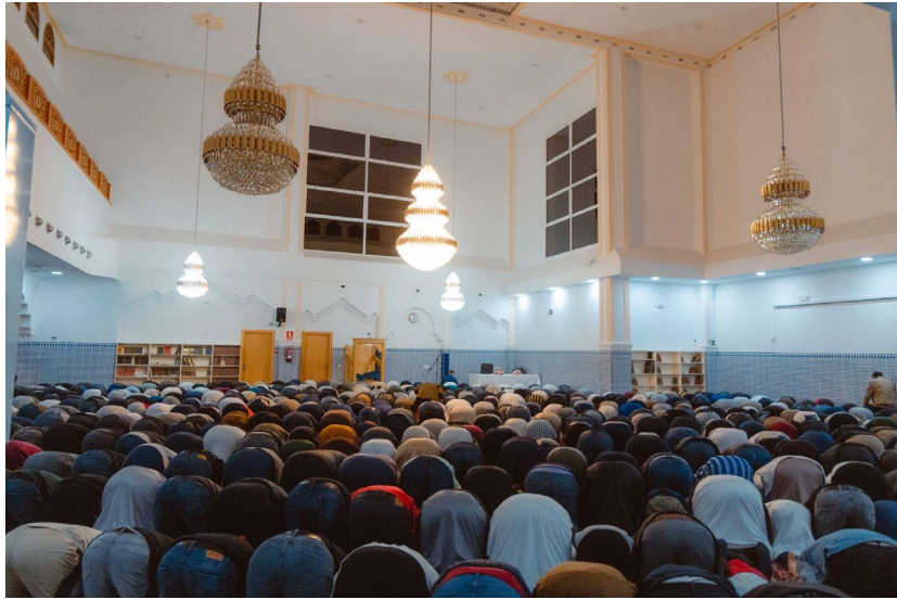
Els fidels musulmans realitzen la pregària nocturna durant el Ramadà. Salt, 16 d'abril de 2022.