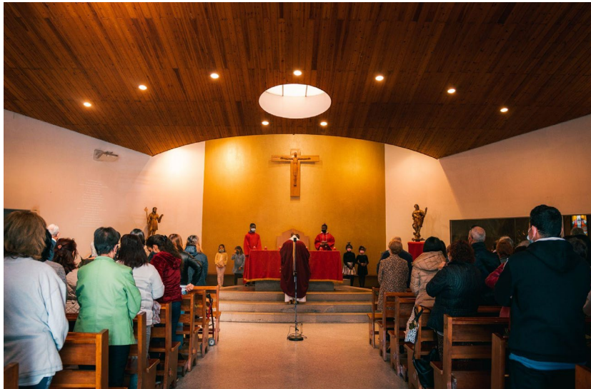
Celebració del Diumenge de Rams a l'Església de Sant Jaume. Salt, 10 d'abril de 2022.