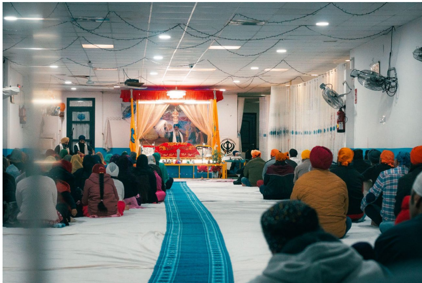
Els fidels sikhs al Gurdwara Sikh Kalghidar Sahib. Salt, 3 d'abril de 2022.