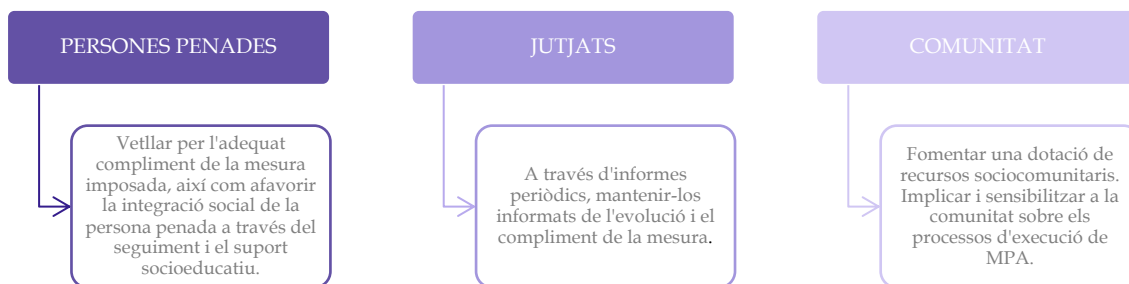
Gràfic 2. Les principals funcions dels/de les DEM.

Font: Elaboració pròpia a partir de Generalitat de Catalunya, 2009.