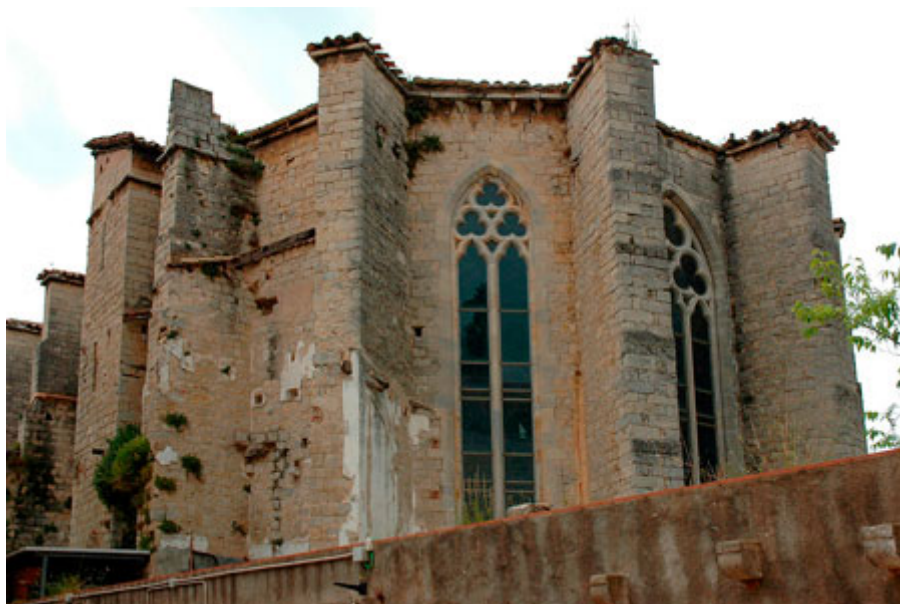
Il·lustració 4 Capçalera de l'església del convent dominic.

Boto posa en relació les capçaleres de Sant Domènec de Girona i la de Santa Maria dels Turers de Banyoles. Observant la morfologia del presbiteri, els contraforts exteriors i els finestrals, conclou que es tracta de dues capçaleres anàlogues i que, per tant, cal situar-les en un marc temporal coetani. D'aquesta manera, com que la capçalera de Banyoles està datada entre les últimes dècades del segle XIII i la primera del XIV, la capçalera dels dominics s'ha de moure entre unes dates semblants, és a dir, a partir de l'últim quart del segle XIII. 97