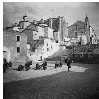
Il·lustració 2 Fotografia del segle XIX de l'escalinata i accés al convent. monestirs.cat

No se sap quan es va construir, probablement entre els segles XIV i XV quan s'amplien