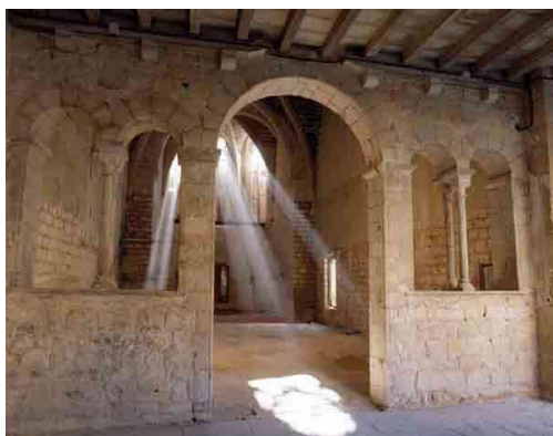
Il·lustració 5 Portada d'accés a la sala capitular.

Per a defensar això tenim que l'esquema de la porta d'accés ja el trobem en els convents cistercencs 119 i és estilísticament molt diferent a tota la resta. La rosassa que hi ha la podem relacionar amb el mestre Bartomeu perquè en conservem els caps que servien de mènsules del guardapols. I aquests són molt semblants als dels àngels de la