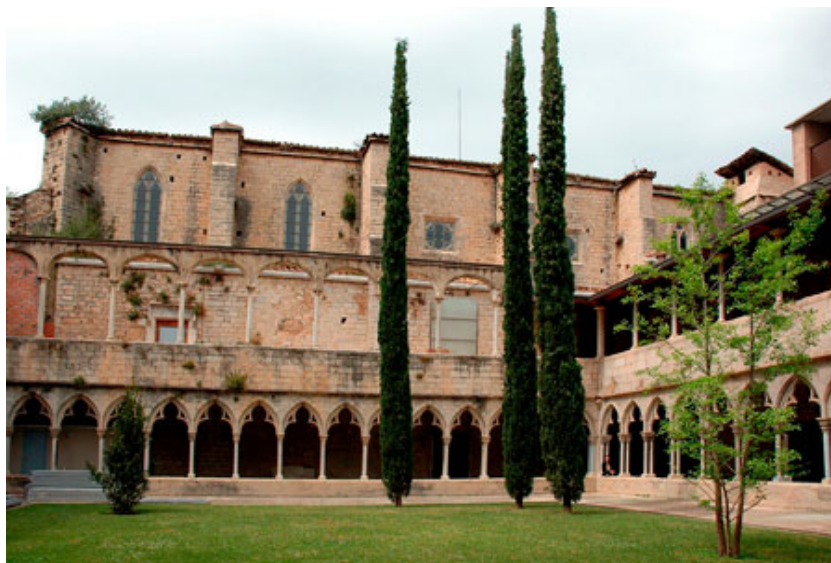
Il·lustració 3 Galeria nord i finestrals de l'església des de l'exterior.

L'església, per tant, consta d'una única nau coberta per voltes de creueria que formen cinc trams i acaba amb una capçalera poligonal de set cares. Entre els contraforts s'hi obren capelles que Gibert, deixa oberta l'opció a què, tal com passa al convent de Balaguer, s'anessin eixamplant en profunditat i en nombre a mesura que avançava la construcció cap als peus. 91 Aquesta tipologia arquitectònica és la més comuna durant el gòtic català. 92