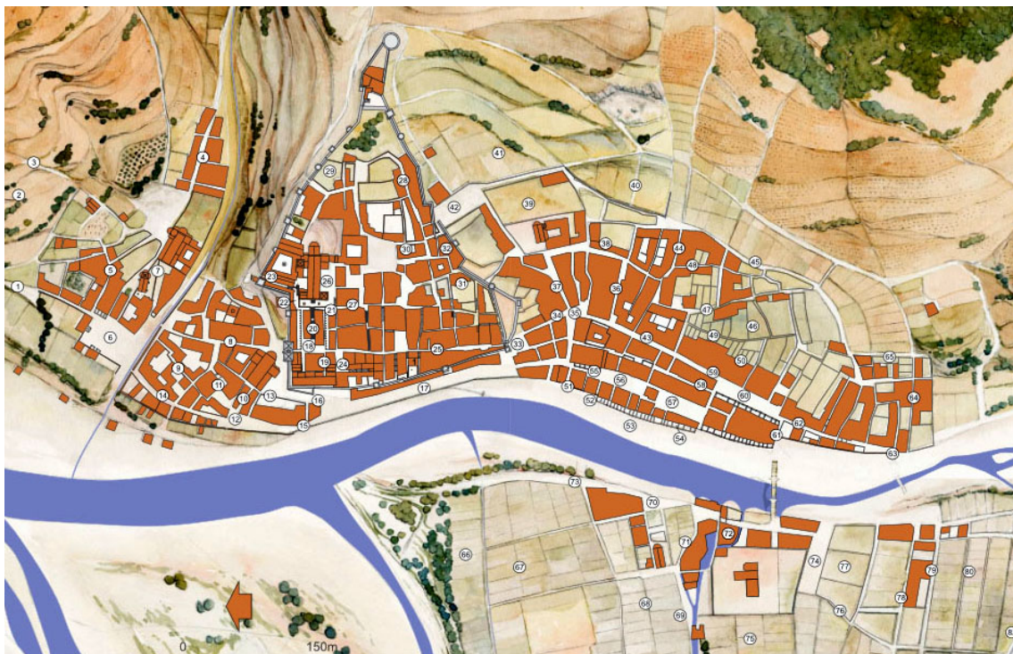
Il·lustració 1 Girona abans de la fundació del convent dominic. Girona en el segle XIII. Josep Maria Nolla et. al.

L'aparició, per tant, d'ordes mendicants que s'apropessin a la vida urbana i fossin atentes a les necessitats materials dels més pobres, que restessin fidels a l'església i l'ajudessin a combatre l'heretgia, esdevenien un element imprescindible per posar fi a la crisi que vivia l'Església. Els ordes mendicants més conegudes són les dels franciscans i dominics, tot i que n'hi hagué més. En el cas que ens ocupa ens centrarem en els seguidors de Sant Domènec els quals són, alhora, els que més i millor van lluitar per fer front als problemes plantejats.