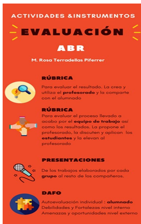
Fig. 4. Sistema evaluación Retos.