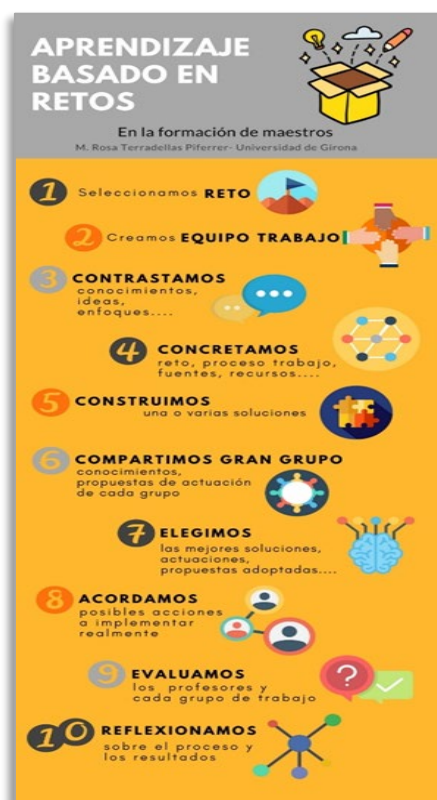
Fig. 3. Fases del proceso de ABR.