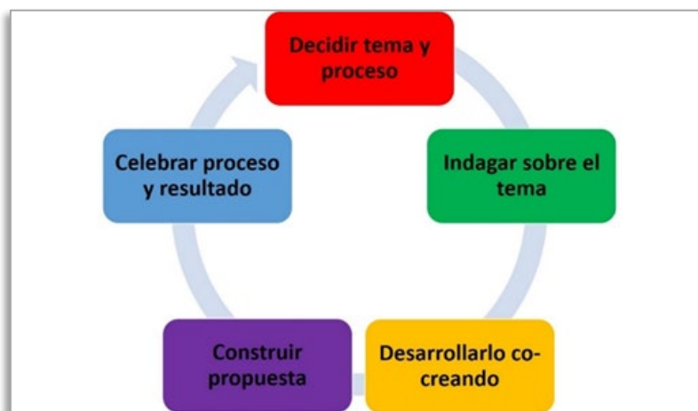
Fig.2. Fases para llevar a cabo procesos de cocreación.