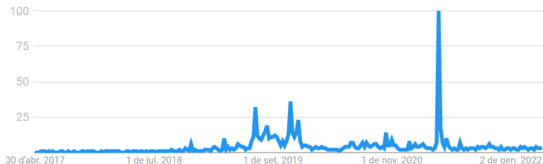
Gràfica 3: Volum de cerques del terme 'MENAS'

Algunes d'aquestes dates estan marcades per diferents esdeveniments que van succeir i els quals van aixecar polseguera, no només a nivell mediàtic, sinó també en altres àmbits de la nostra societat com ara en la política i en la justícia. Fets com els atacs reiterats al centre d'Hortaleza a Madrid que van des del llançament d'una granada a principis de desembre de l'any 2019, fins els incidents provocats per la tensió que hi havia al barri. Un cas similar és el del Masnou, que la primera setmana de juliol de l'any 2019 van haver-hi diferents concentracions que el veïns i grups d'extrema dreta havien organitzat, els quals també van acabar amb incidents. Finalment, del 18 al 24 d'abril del 2021, quan van haver-hi més cerques a Google, va ser durant la campanya electoral de les eleccions de la Comunitat de Madrid, on el partit polític ultradretà de Vox va penjar en una de les sortides de l'estació de Renfe de la Puerta del Sol de Madrid un cartell amb propaganda on es podia llegir "Un mena 4.700 euros al mes, tu abuela 426 euros de pensión/mes".