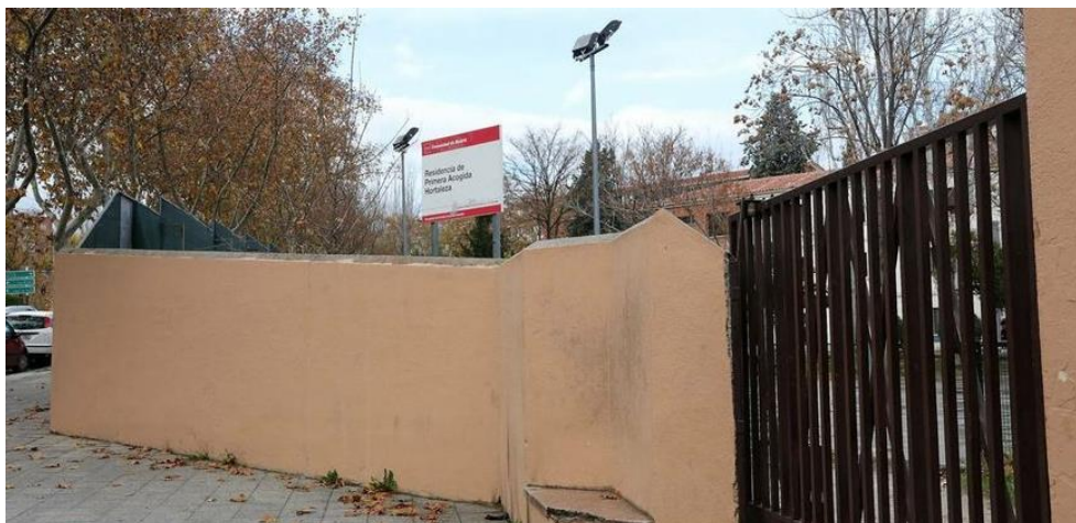
Font: Ara (4/12/2019)