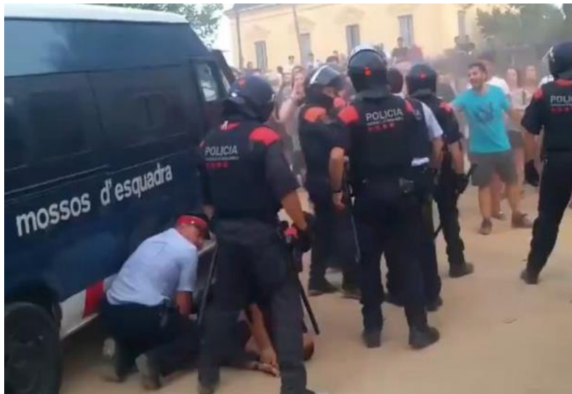
Font: El Nacional (4/7/2019)