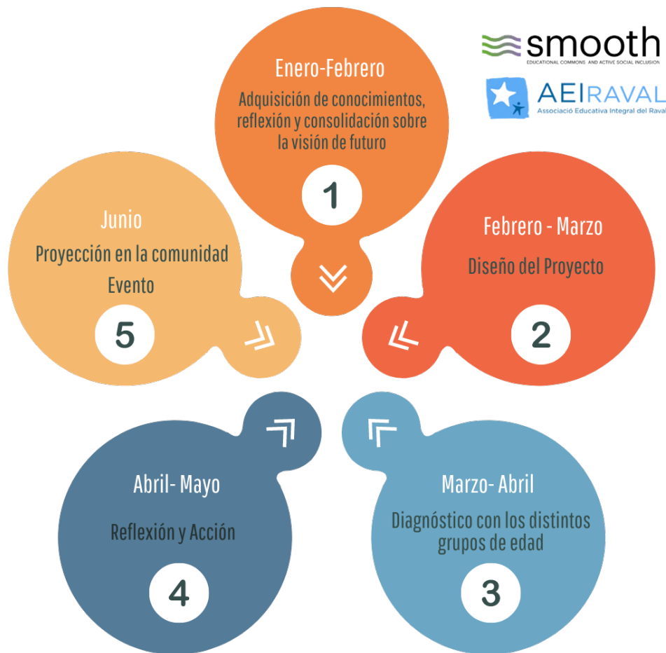
Diagrama elaboración propia

El trabajo investigativo está dividido en 5 etapas, como se presentan en el diagrama a continuación. Cada etapa está dividida en talleres programados una vez por semana. Se trabajará con los dos grupos que asisten al Aula Oberta, uno lo hace los días lunes y miércoles, el otro los días martes y jueves. Se decide trabajar la segunda sesión de la semana, miércoles y jueves respectivamente.