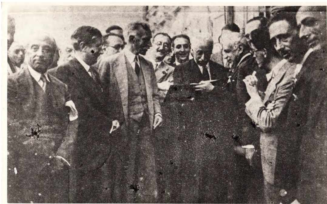
Amadeu Hurtado sostenint l'Estatut d'Autonomia de 1932 davant els presidents Macià i Alcalà Zamora, i en presència, entre d'altres, de Lluís Companys, Manuel Serra i Moret i Álvaro de Albornoz.