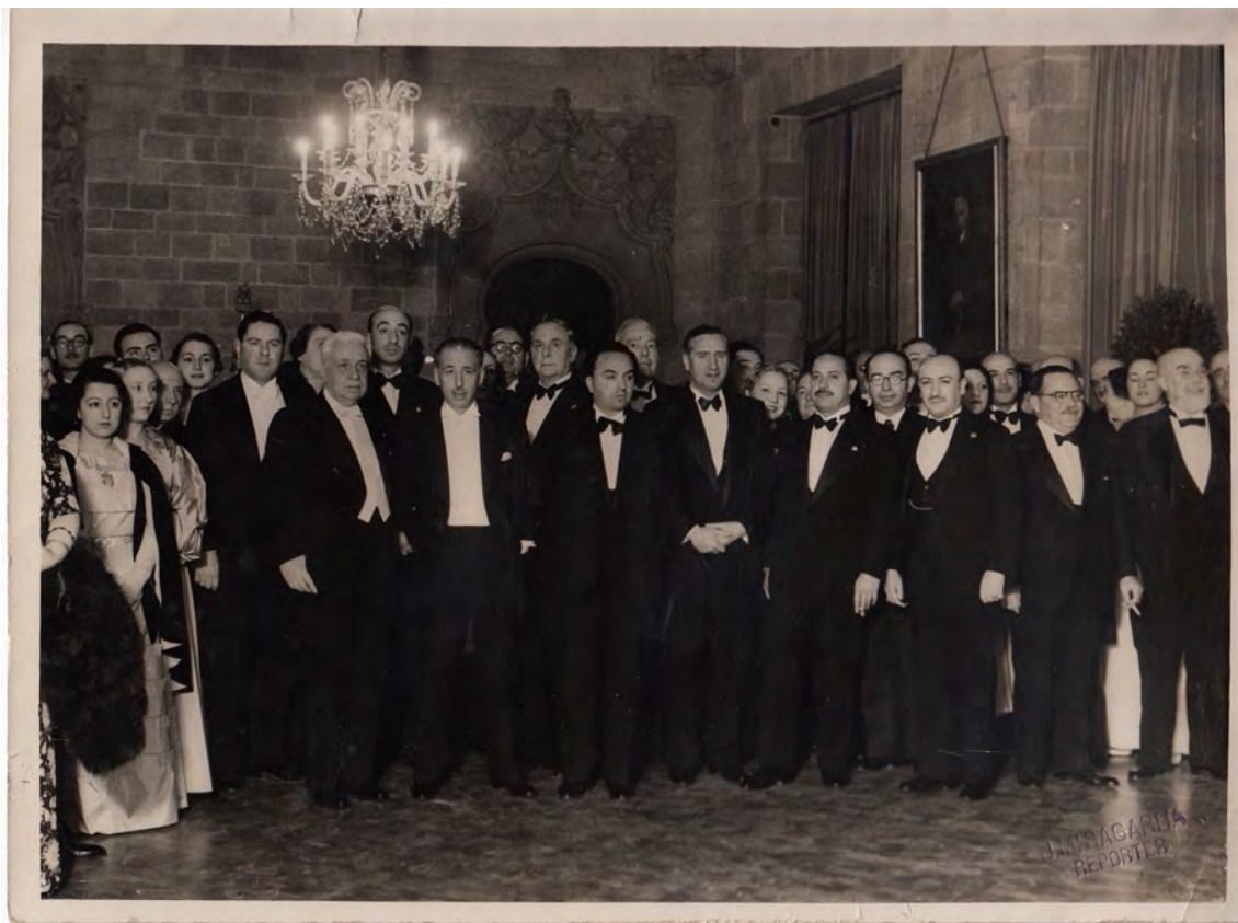
Recepció a la Generalitat en motiu del I Congrés Jurídic Català (AHH).