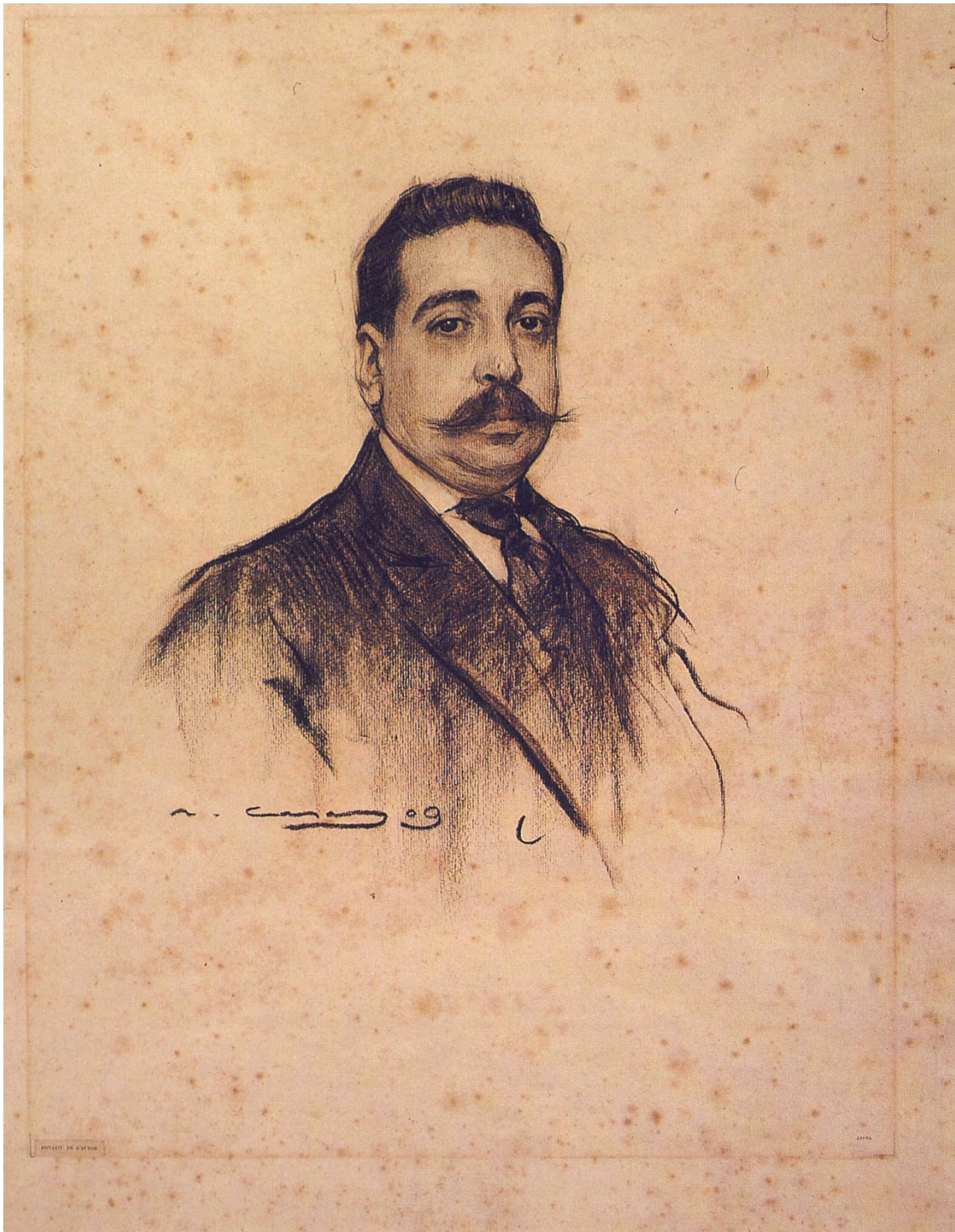
Amadeu Hurtado retratat per Ramon Casas (Museu Nacional d'Art de Catalunya).