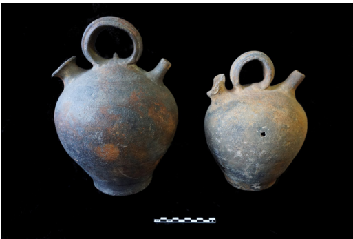
Figura 4. Selecció de càntirs.

És evident que la manca d'un registre arqueològic precís no permet descartar que els atuells del fons del pou, els més antics, fossin exclusivament poals, si bé aleshores caldria esperar un predomini d'aquests en el conjunt que no es produeix. Tot plegat ens permet concloure que, en realitat —i si prenem com a certa la premissa que el pou es va exhaurir íntegrament— s'ha de situar la seva construcció en un moment més avançat del que fins ara s'havia determinat, segurament ja dins de la segona meitat del XV i en paral·lel al procés de monumentalització del pati, també més tardà del que fins fa poc s'estimava. En qualsevol cas, les quantitats més o menys equilibrades de càntirs i poals confirmen la plena operativitat de l'estructura durant el segle XVI (fig. 4).