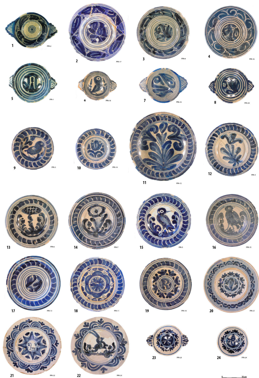
Figura 9. Peces de vaixel·la blava de fabricació barcelonina (segona meitat s. XVII — inicis s. XVIII).

plats comuns amb els següents dibuixos al fons: una flor (fig. 9, 12-14, PPA-4, 6-7), un ocell (fig. 9, 15-16, PPA-5 i 15), figues (fig. 9, 17, PPA-13), un medalló amb motiu floral inscrit (fig. 9, 18, PPA-11), i un medalló amb la lletra «R» a l'interior (fig. 9, 19, PPA-10), aquesta darrera potser una peça personalitzada per encàrrec (Miró 2012, 292-294). El darrer grup, ja més tardà, està format per peces de la sèrie denominada de Poblet , fabricada entre el darrer terç del segle XVII i inicis del XVIII (Cerdà 2012, 48-54). Hi comptem tres plats comuns, amb el fons decorat amb un medalló amb motiu floral interior —un sol amb fesomia humana i una llebre o conill respectivament (fig. 9, 20-22, PPA-21-23)— i dues escudelles —una amb orelles i una creu de malta al fons (fig. 9, 23, PPA-25)— i l'altra sense i amb un motiu vegetal central (fig. 9, 24, PPA-24).