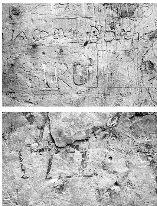
Figura 10. Detall dels gravats i inscripcions trobats a la sala J.M. Corominas en les obres efectuades l'any 1980.

La base d'aquesta teoria són els múltiples grafits i inscripcions dels segles XVII i XVIII, entre ells noms i dates (fig. 10), apareguts durant les obres de rehabilitació que es feren els anys vuitanta del segle passat per eliminar les divisions internes de la sala Corominas o sala Major, un saló noble on es creu que en origen es reunien els jurats municipals. La presència d'aquests gravats no sembla correspondre a un ús solemne o oficial de l'espai, si bé cap document permet donar suport, en aquest marc cronològic, a algun altre ús per l'edifici que no sigui el de Casa de la vila. Justament un dels pocs noms que es poden llegir a les fotografies que testimonien la troballa, ja que els envans foren desmuntats durant les esmentades obres, és el de Iacobus Bosch , un nom comú, però que qui sap si podria correspondre a Jaume Bosch, jurat de la vila de Banyoles, que curiosament morí per un tret de pedrenyal l'any 1640, a l'inici de la guerra dels Segadors (Palmada 2008, 46). Si això fos així, els gravats i inscripcions no haurien estat fets per presoners o malalts, sinó per persones vinculades o properes al