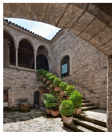
Figura 1. Vista del pati de la Pia Almoina amb el pou alçat prop de la paret.

El pou de la Pia Almoina es troba al pati de l'edifici número 11 de la plaça de la Font, coneguda antigament com a plaça Mitjana o de la Vila, situada al bell mig de la trama urbana de la Banyoles medieval, entre la plaça Nova i la plaça Vella (les actuals plaça Major i plaça del Teatre respectivament). Es tracta d'un dels edificis més emblemàtics del nucli urbà, que des del segle XIV va acollir de manera paral·lela la Universitat o seu del Comú —que s'hi mantingué fins al 1928, quan l'Ajuntament passà a la seva ubicació actual— i la Pia Almoina dels Prohoms, que hi pervisqué fins al 1833. La instal·lació d'aquestes institucions va modificar la fisonomia de les cases precedents, les quals s'unificaren per a conformar un únic edifici que tingué una evolució arquitectònica singular. Després del canvi d'ubicació de l'Ajuntament, a l'edifici s'hi instal·là l'Escola d'Arts i Oficis i al voltant de 1932 s'hi començaren a concentrar els diferents materials arqueològics que esdevingueren la gènesi del Museu Arqueològic Comarcal de Banyoles, situat avui dia al mateix edifici de la Pia Almoina i a les cases limítrofes de Can Fornells, Can Paulí i Can Xueta (fig. 1).