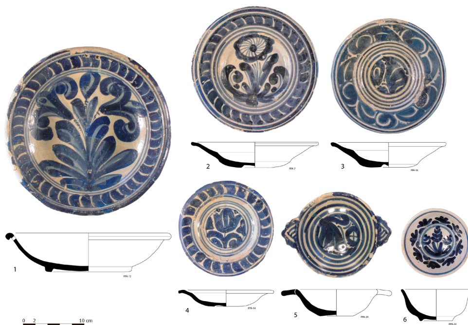
Figura 8. Repertori formal del lot de vaixel·la blava catalana compresa entre el 1655 i inicis del segle XVIII. 1. Plata o servidora, 2 i 3. Plats comuns o de pam, 4. Plat petit o de tres quarts de pam, 5. Escudella amb orelles, 6. Escudella sense orelles.

de les quals ja publicades per Telese (1991), que responen a les següents formes: set escudelles —sis amb ala i una sense—, d'entre 11 i 15 cm de diàmetre; dos plats petits o de tres quarts de pam , d'entre 15 i 16 cm de diàmetre (Cerdà 2012, 44); 14 plats comuns o de pam , d'entre 19 i 22 cm de diàmetre; i una única plata fonda o servidora de 27 cm de diàmetre, en aquest cas amb dos forats fets ante coctem a la vora que servien per penjar-la a la paret quan no estava en ús, qui sap si també amb finalitats decoratives (Miró 2012, 288-289).