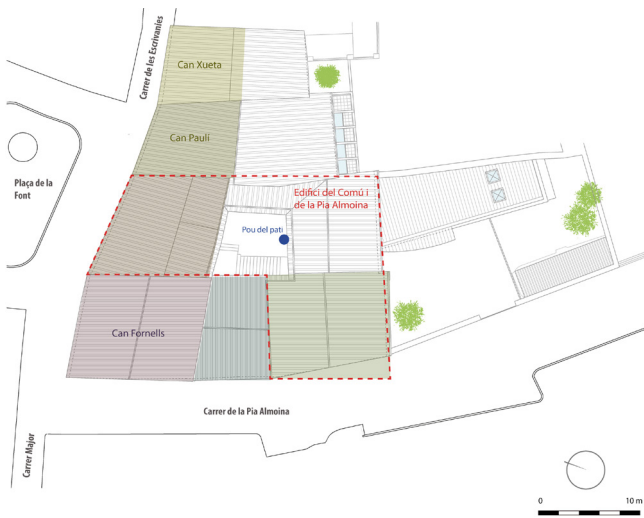
Figura 2. Sobre una planimetria actual es marca el conjunt d'edificis situats a la banda de migdia de la plaça de la Font, alguns dels quals conserven encara les arcuacions construïdes al voltant del 1300. En línia vermella discontinua es delimita l'espai ocupat per la seu del Comú i la Pia Almoïna (planimetria base: Callís, Moner, Riera 2019).

localitzats al primer pis de la casa que esdevindrà la Pia Almoïna, concretament a la paret mitgera que separa la finca amb Can Fornells i ubicats per sobre les traces del parament en spicatum —corresponents a l'aresta superior de la teulada—, van fer decantar a la historiadora Rosa Lluch a pensar que aquests s'havien efectuat al voltant del segle XIII, quan ja s'hauria construït el primer pis amb el corresponent arc diafragmàtic (Lluch 1994, 114-115). Altres historiadors com Cobos i Tremoleda, després d'estudiar el grafit que correspon a un cavaller medieval armat muntant el seu cavall a carrera, pel tipus d'indumentària, el situen en un moment imprecís del segle XIV (Cobos, Tremoleda 2013, 166).