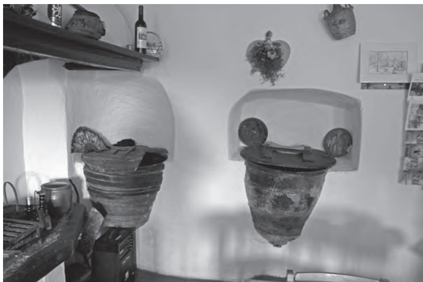
Figura 2: Cuina de l'hostatgeria del santuari del Coral a Prats de Molló abans i en l'actualitat, amb dos cossis lleixiners.

de la roda on s'obraven la majoria dels altres atuells. Encara avui se'n pot veure, ja en desús, per molts llocs, generalment reutilitzats com a decoració