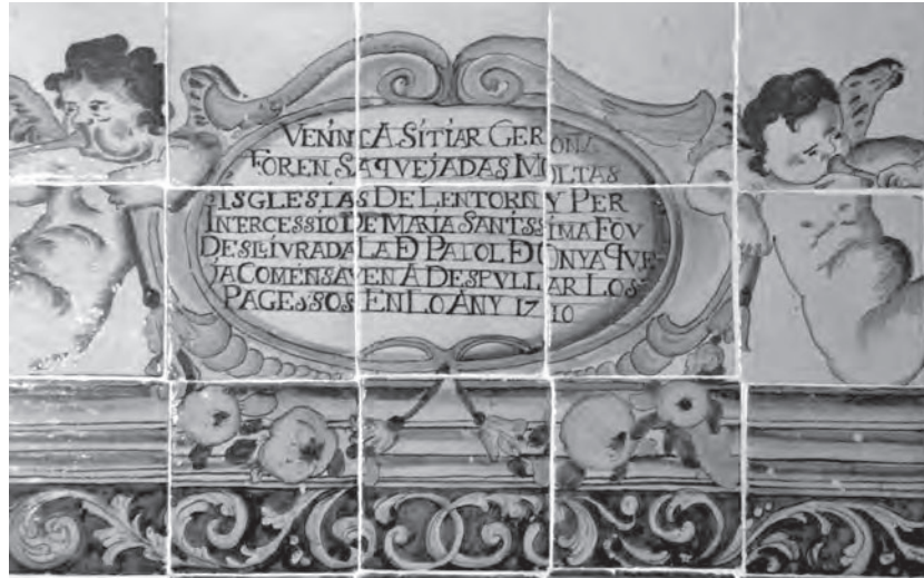
Figura 7: Escrit a les rajoles de la capella del Roser de l'església de Palol d'Onyar que fa referència al setge de Girona de l'any 1710, posat damunt de l'escena on es veuen soldats filipistes davant de l'església.

policroma que decoren tota la capella del Roser de la parròquia de Palol d'Onyar, municipi de Quart, rajoles que són obra d'un escudeller barceloní, segurament fetes pocs anys després de l'última data, la de 1716, que s'hi esmenta. Tracten de miracles fets per la Mare de Déu del Roser, dos dels quals són locals. En un preservà el terme d'una pedregada el 1716. En l'altre, que és el que aquí ens interessa, va evitar el saqueig de l'església de Palol d'Onyar per la soldadesca filipista. En la representació del miracle es veu la Mare de Déu ennuvolada davant d'una església que no s'assembla gens a la de Palol. El paisatge llunyà també és idealitzat. Davant l'església es veu el rector acompanyat de dos nois o escolans que veuen com un soldat armat amb una espasa encaça tres pagesos que fugen 42 . Damunt de l'escena s'hi llegeix: "VENINT A SITIAR GERONA FOREN SAQUEJADES MOLTES ISGLÉSIES DE L'ENTORN Y PER INTERCESSIÓ DE MARIA SANTÍSSIMA FOU DESLLIURADA LA DE PALOL DE ONYÀ QUE JA COMENÇAVEN A DESPULLAR LOS PAGESOS EN LO ANY 1710" (fig. 7).