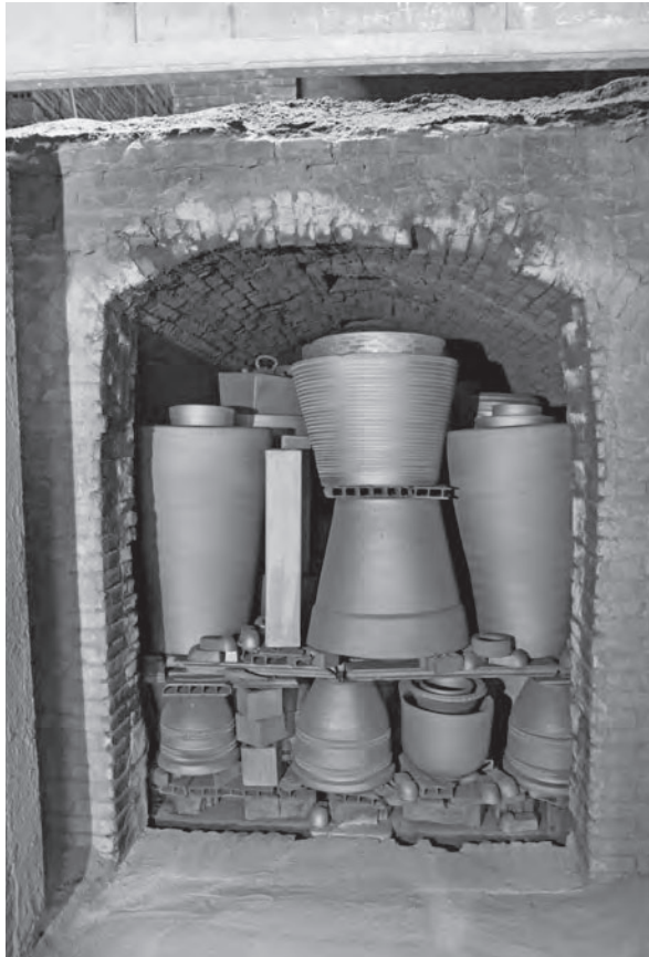
Figura 5: Fornada de terrissa negra al forn de l'obrador Bonadona, vista des de l'eixida, a punt per ésser desenformada.

Girona i mostassaf, afirmava, quan el 1678 es va donar el cas de l'arrendament de tota la terrissa de Quart per Lluís Mateu, que d'aquest poble en sortien cada any 1.500 càrregues. Si això fos mes o menys exacte, cadascuna de les 157 fornades anuals hauria pogut contenir unes deu càrregues de terrissa. A dotze dotzenes de peces per càrrega una formada podia contenir 1.440 peces. Estaria formada per atuell grossos i petits combinats, cosa que permetria aprofitar bé l'espai del forn. Per fer-nos una idea general de com eren aquestes fornades, pensem que deu càrregues per fornada equivaldrien a vint cossis dels més grans, de quatre botes (240 litres), que valia cadascun sis dotzenes de peces, a 240 olles de mitja bota (30 litres) que eren sisenes (valien 6 peces), a 480 mallals, que tots valien nou peces, a 960 barrals de quartó i mig (2,67 litres) que eren comptats a peça i mitja, a 2.880 ansats mitjans d'un quartó (1,78 litres) dels quals dos feien peça, o a 4.320 ansats petits de fins a mig quartó (0,9 litres), dels que valien tres una peça.