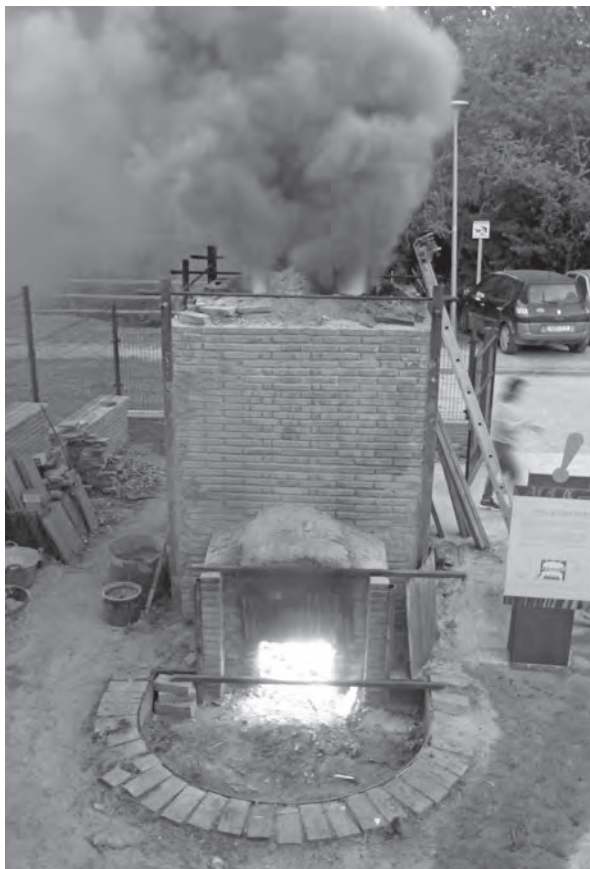
Figura 6: El forn experimental del Museu de la Terrissa de Quart en plena cocció d'una fornada de terrissa negra.

Al forn de la família Bonadona vint cossis dels més grans que ell fa, que són de més de 400 litres, no hi cabrien. Ben segur que cada fornada combinava atuellers grans amb altres de mitjans i petits per tal d'aprofitar de la millor manera l'espai.