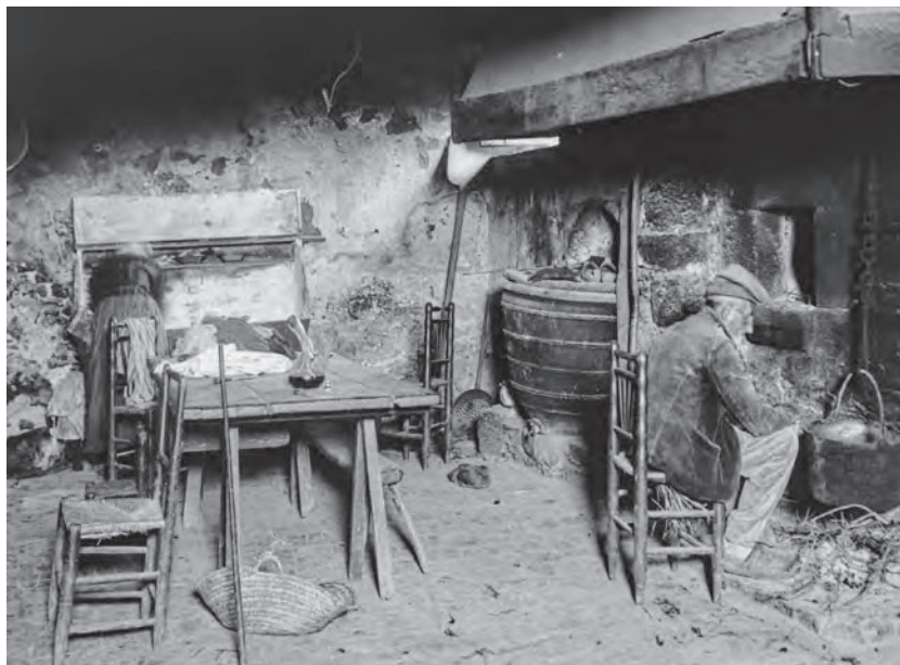
Figura 1: Cuina d'una casa de Palol d'Onyar amb un cossi lleixiner encastat ( Revista de Girona 316, setembre-octubre de 2019).

sortien de Quart, i amb el transport s'encarien molt més. Com que eren molt valuosos, si s'esquerdaven eren adobats, generalment amb grapes de metall 5 , com encara podem veure en molts dels conservats. S'escampaven per tot el bisbat de Girona, per part dels bisbats de Vic i de la Seu 6 , per tot el Rosselló, el Vallespir i Conflent, i entraven a Occitània. S'utilitzaven també per recollir el vi de la tina, per conservar l'oli i com a dipòsits d'aigua per a la casa, per ensulfatar la vinya al camp o per regar el planter a l'hort. N'hi havia amb una forma específica per decantar l'oli 7 . Es feien en un torn manual baix, diferent