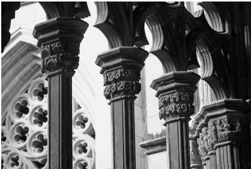
Claustre de la catedral de Vic, detall d'algunes columnes i capitells de l'andana sud. (Foto Miquel Àngel Fumanal).