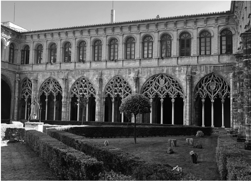
Claustre del convent de Sant Domènec de València, andana est. La participació de Ramon Marenjà en el claustre degué arrancar el 1367 amb l'encàrrec de 26 columnes, amb els corresponents capitells, bases i àbacs (Foto Pere Freixas).