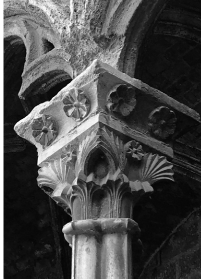
Claustre de Sant Domènec de València, detall d'un capitell de fulla de palma.