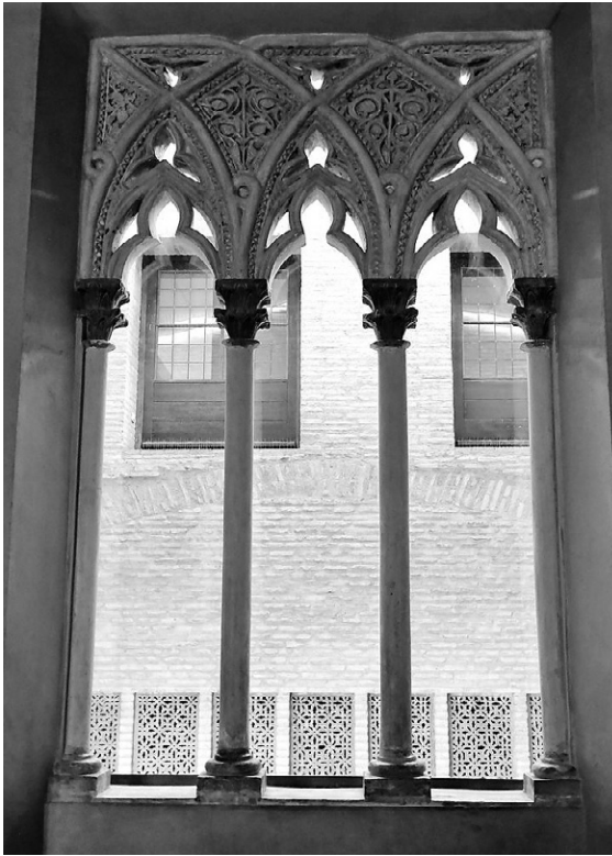
Finestra del palau reial de l'Aljaferia de Saragossa. Ramon Marenyà realitzà les columnes per a diverses finestres cap a l'any 1358.

En la dècada de 1350 l'interès del monarca se centrà en el palau de l'Aljaferia de Saragossa. L'encàrrec de dotze columnes per a finestrals de les estances reials d'Aljaferia, amb les seves bases i capitells, obeeix a una comanda ja coneguda, feta pel rei Pere al batlle general de Catalunya, Pere Sacosta, el dia 7 de febrer de 1357 (López de Meneses, 1952, doc. 39). 47 Gairebé un any i mig més tard, és coneguda també una doble petició del rei Pere referida al pagament dels finestrals de l'Aljaferia, amb l'afegit de tres peces de teixit d'or comprades a Perpinyà, on aleshores s'hi trobava el rei i des d'on mana fer els pagaments “Item don ea-n Ramon Maranyà pedrer de Gerona per preu de XII colones ab lurs capitells les quals lo dit senyor manà que fossen comprades per obs de la Alfajaria de Saragoça CCLXX solidos Barchoninenses” (Madurell, 1961, p. 523;