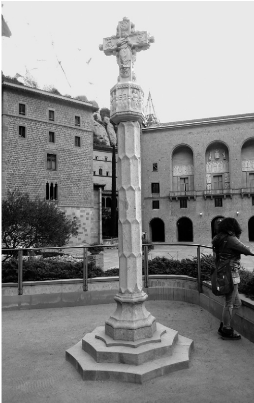
Creu de Montserrat, a l'esplanada exterior del monestir