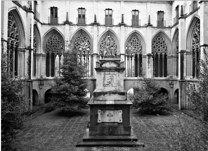
Vista general del claustre de la catedral de Vic. La intervenció de Ramon Marenyà se situa a la darrera de la dècada dels cinquanta del segle XIV, bé sigui simplement amb la venda dels materials petris, o bé amb la participació directa en la construcció de l'andana.