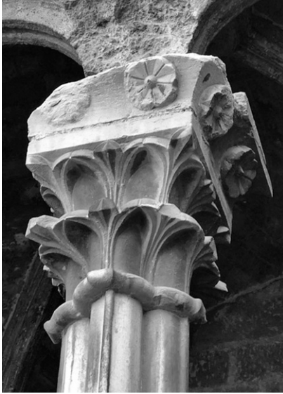
Claustre de Sant Domènec de València, detall d'un capitell de flor de lliri.