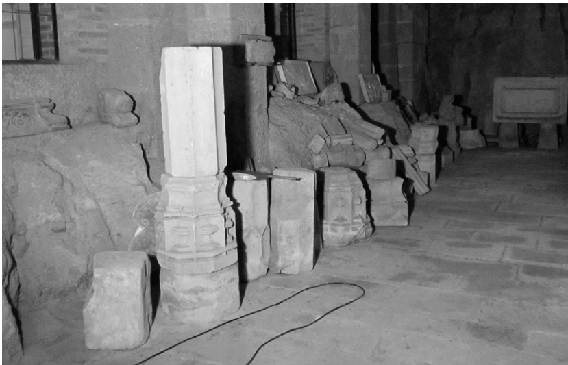
Restes de bases i columnes de creus diverses, al dipòsit lapidari del Museu de Montserrat.