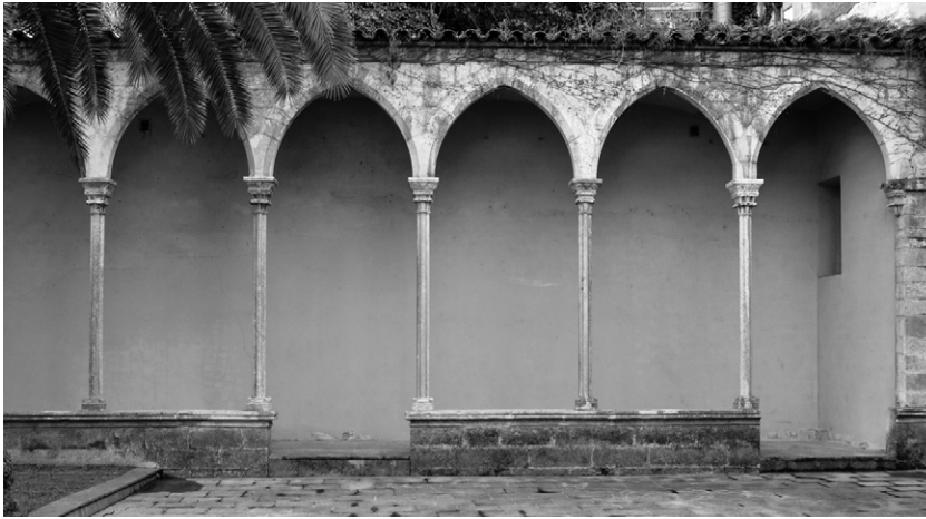
Ala del claustre gran del convent Sant Francesc de Girona, avui remuntada al palau Solterra, al carrer Ciutadans. Les mesures i la tipologia de les columnes són idèntiques amb les del claustre del convent de Sant Domènec de València.

Castelló d'Empúries (Freixas, 1983, p. 341, núm. 10). 32 No seria desencaminat pensar que el destí d'aquestes columnes hagués estat el de sostenir el baldaquí que cobria l'ara de l'altar major de l'església conventual, com tenia també el convent homònim de Girona, del qual tenim notícia datada el 1424, quan el mestre d'obres i escultor Antoni Canet en fa un de fusta, potser per substituir-ne un altre d'anterior (Freixas, 1983, p. 261; 2015, p. 67).