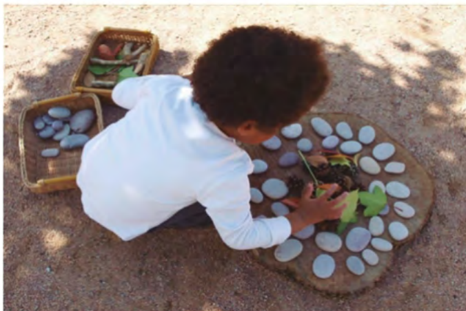
Espacio de Juego heurístico