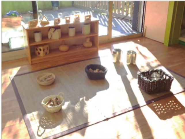
Espacio de juego heurístico