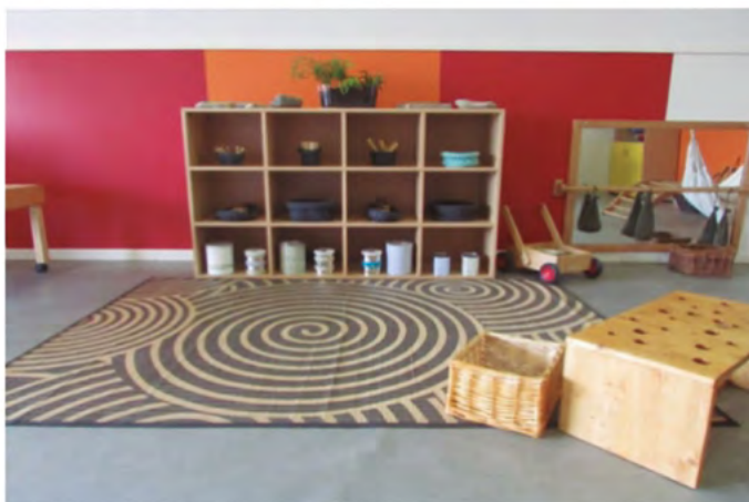
Espacio de juego simbólico