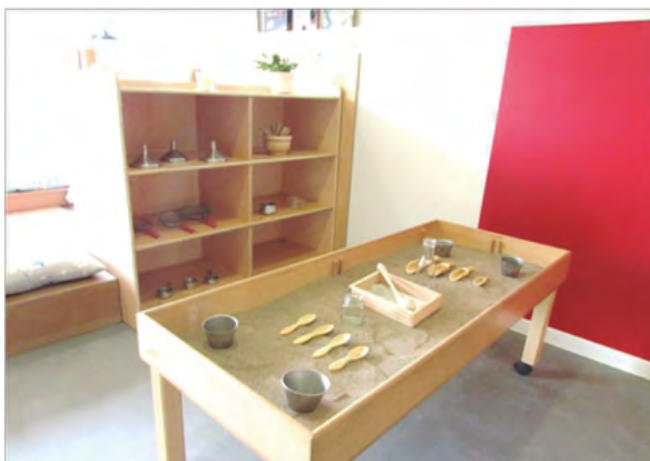
Mesa de experimentación