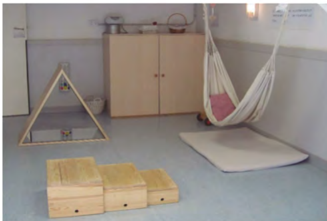
Espacio de movimiento