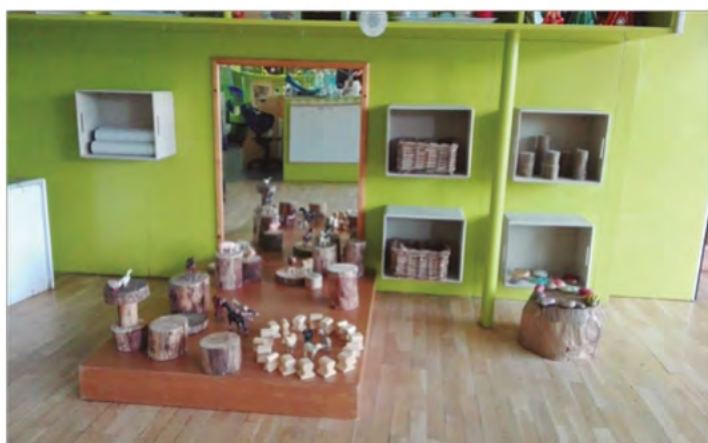
Espacio de construcción