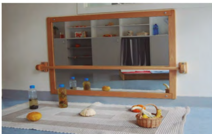
Espacio de exploración