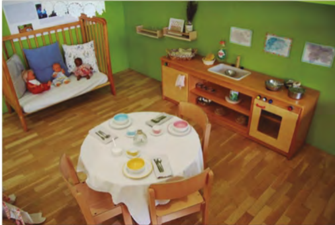
Espacio de Land Art