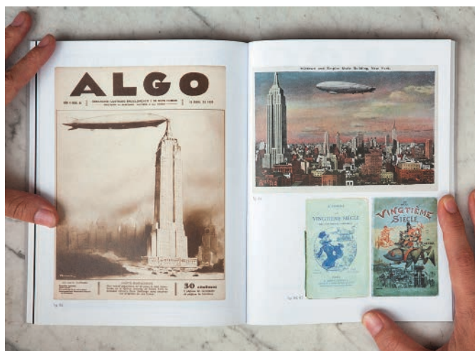
FIGURA 4. JUAN JOSÉ LAHUERTA. 'PHOTOGRAPHY OR LIFE' & 'POPULAR MIES'. COLUMNS OF SMOKE VOL. I. TENOV. BARCELONA.

MGV. Ahora, cada poco tiempo se montan escándalos mediáticos que se producen por los que se atreven a hablar de los lazos de Le Corbusier con el fascismo y otros similares. Como si fuera un anatema decir lo evidente.