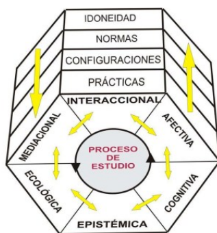
Figura 2: Facetas y niveles del conocimiento del profesor (Godino, 2009, p. 21)

Como se muestra en la Figura 2, el conocimiento didáctico-matemático del profesor se encuentra constituido por las siguientes categorías de conocimientos fundamentales necesarios para que un profesor lleve a cabo el proceso de enseñanza y aprendizaje: