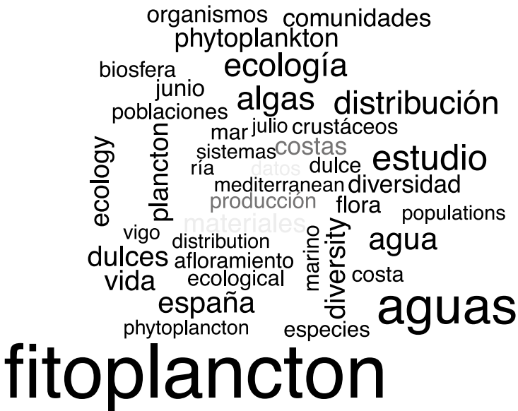
Figura 1. Núvol de paraules dels títols de les publicacions del professor Margalef. Els títols s'han extret de les 640 publicacions (28 d'agost 2020) de Google Scholar Citations ( https://scholar.google.com/citations?user=d3w4mPIAAAAAJ ) i s'han processat mitjançant el programa R (R Core Team, 2020) i els paquets wordcloud (Fellows, 2018) i tm (Feinerer, Hornik i Meyer, 2008). Només es mostren les paraules que apareixen deu cops o més i s'han omès paraules buides («stop words», com articles, preposicions i altres).