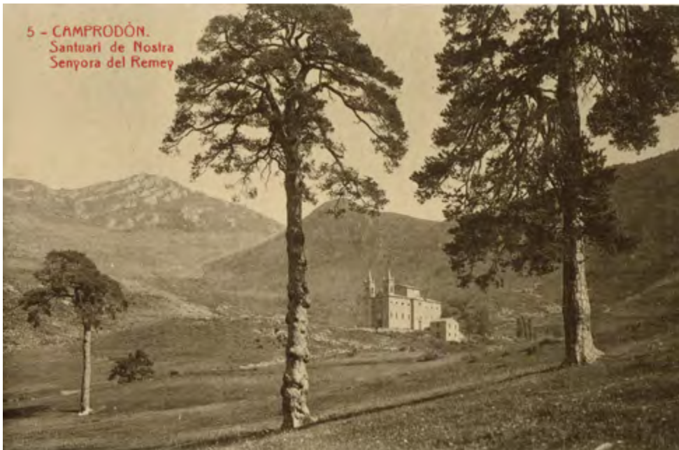
Postal del Santuari del Remei de Creixenturri editada per Thomas, SA (dècada del 1910).

A la vegada, i buscant la màxima optimització de recursos, les imatges emprades a les vinyetes també es van utilitzar per elaborar postals editades per Thomas i Hijos de J. Thomas. Cal assenyalar que la majoria dels originals d'aquestes postals es conserven en diferents arxius, com ara l'Arxiu Històric