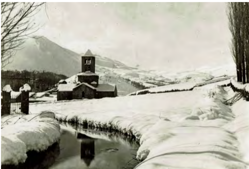
Fotografia de Valentí Planesas del Monestir de Sant Pere de Camprodon nevad (dècada del 1930).