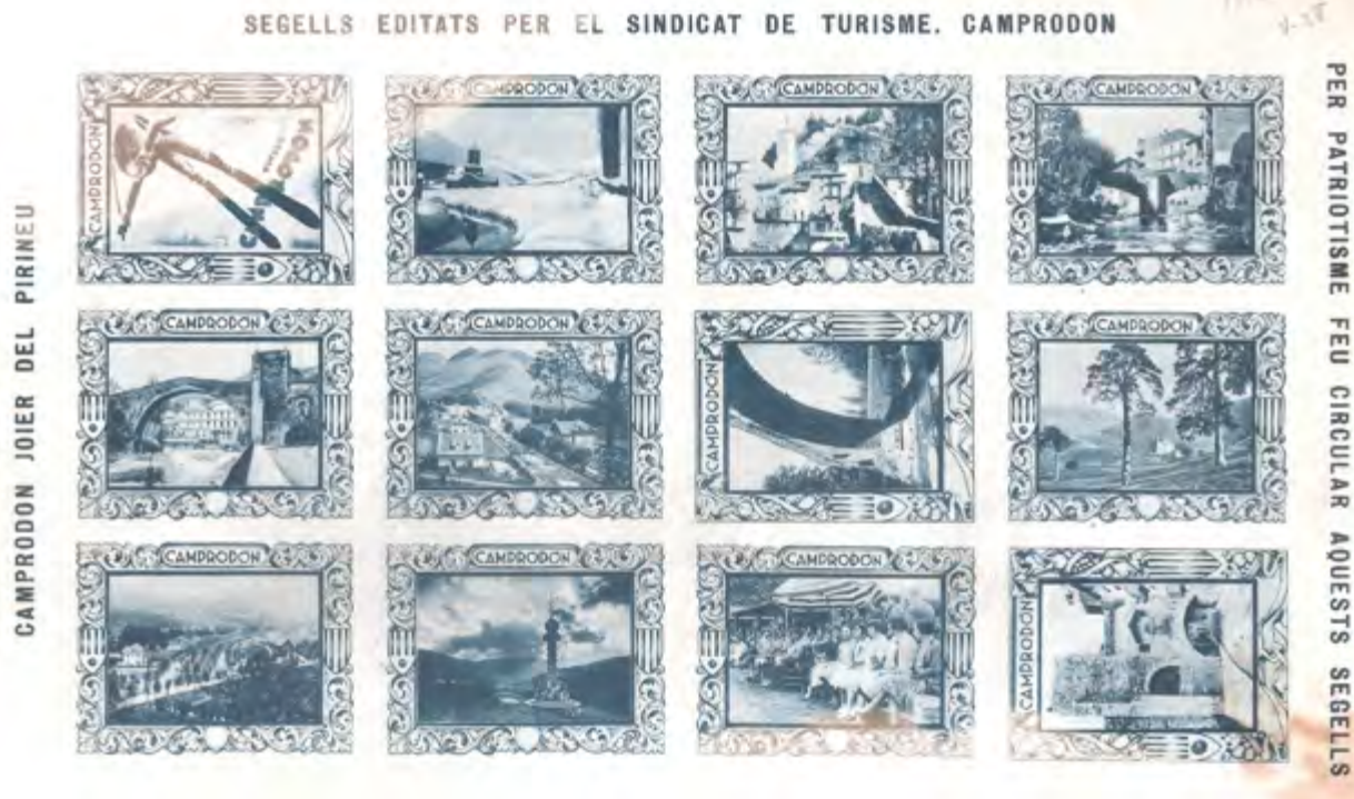
Segon full de vinyetes del Sindicat d'Iniciatives Turístiques de Camprodon (vers el 1930). El full no està dentat; entenem que va ser una prova d'impremta.