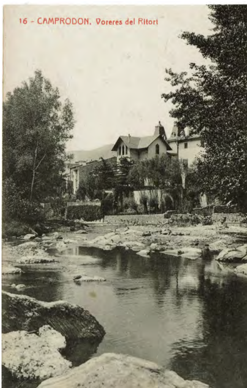
Postal de les voreres del riu Ritort des del passeig de la Font Nova i amb la casa dels Oliveda en primer pla editada per Thomas, SA (dècada del 1910)

Cal esmentar que, malgrat la democratització dels viatges i el desenvolupament d'eines digitals, algunes de les imatges projectades per les vinyetes i altres materials publicitaris dels primers trenta anys del segle xx s'han anat repetint al llarg dels anys i han perdurat fins a l'actualitat, gairebé de manera idèntica,