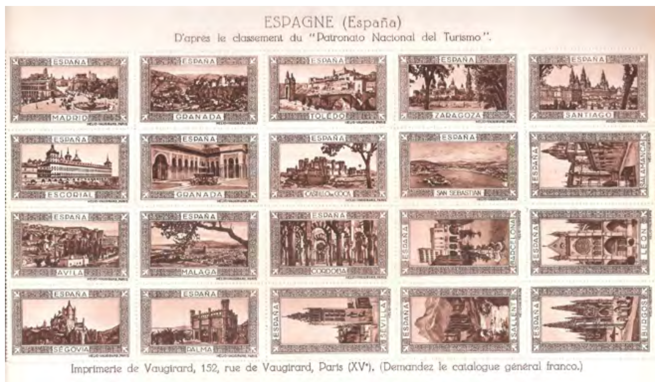
Mostra d'un dels fulls sencers impresos per Imprimerie de Vaugirard (1928).