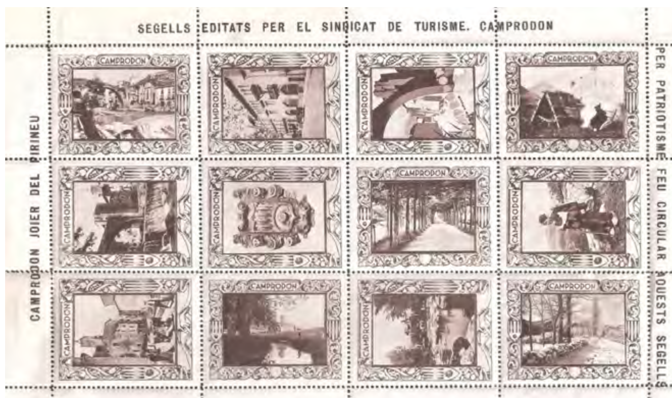
Primer full de vinyetes del Sindicat d'Iniciatives Turístiques de Camprodon (vers el 1930).