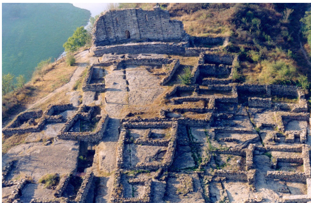
Figura 4. Vista aèria del poble medieval de Roda-l'Esquerda.

De fet, amb excepció de la reforma entorn la nova església per acotar la zona cementirial, la resta d'edificis es van bastir tot seguint l'entramat urbanístic preexistent, fet indicatiu que les línies bàsiques ortogonals devien continuar existint. Com també es devien fer servir els materials abandonats o enrunats, igual que a la muralla. L'única cosa que no es va recuperar ni reutilitzar va ser la xarxa de cisternes d'aigua, comunicades entre elles mitjançant canals o beis naturals a la roca, que a l'edat mitjana es van anul·lar, tot construint-hi cases al damunt. Tanmateix, com veurem més endavant, es va respectar un jub o cisterna central que funcionava com una font de biot enmig del poble, per aportació subterrània d'aigua de la pluja (Serrat et al. 2015a i 2015b) (fig. 4 i 5).