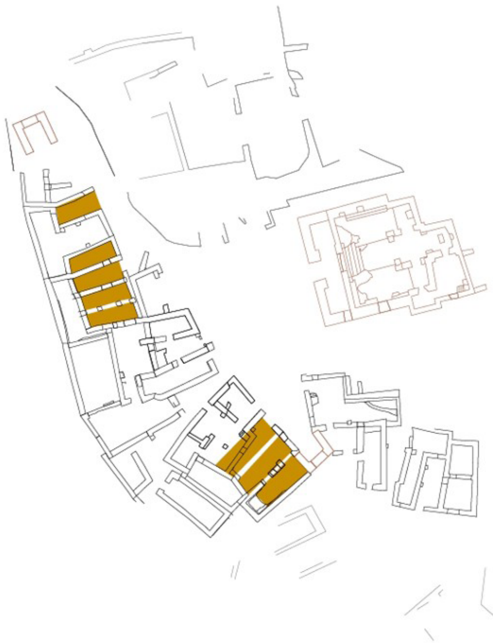
Figura 13. Modulació de l'urbanisme de la fase 2.

percep en la planta dels edificis tal com ens han arribat, i que consisteix en una ordenació i una repartició de l'espai habitable en un mòdul de planta rectangular, llarga i estreta, que s'ajusta a la necessitat de cobrir el sostre amb un sistema d'embigat no gaire llarg (fig. 13). Els nivells associats a aquesta fase venen datats per una presència notable de ceràmica catalana decorada en verd-i-manganès, fet força insòlit atès que aquest tipus ceràmic, que sovint trobem acompanyat de pisa blanca, no apareix en altres jaciments de la zona amb l'abundància que aquí es dona. Pensem que la presència notable d'aquest tipus ceràmic ens pot caracteritzar la importància del jaciment en el període baixmedieval, sens dubte gràcies a la seva estreta vinculació al monestir.