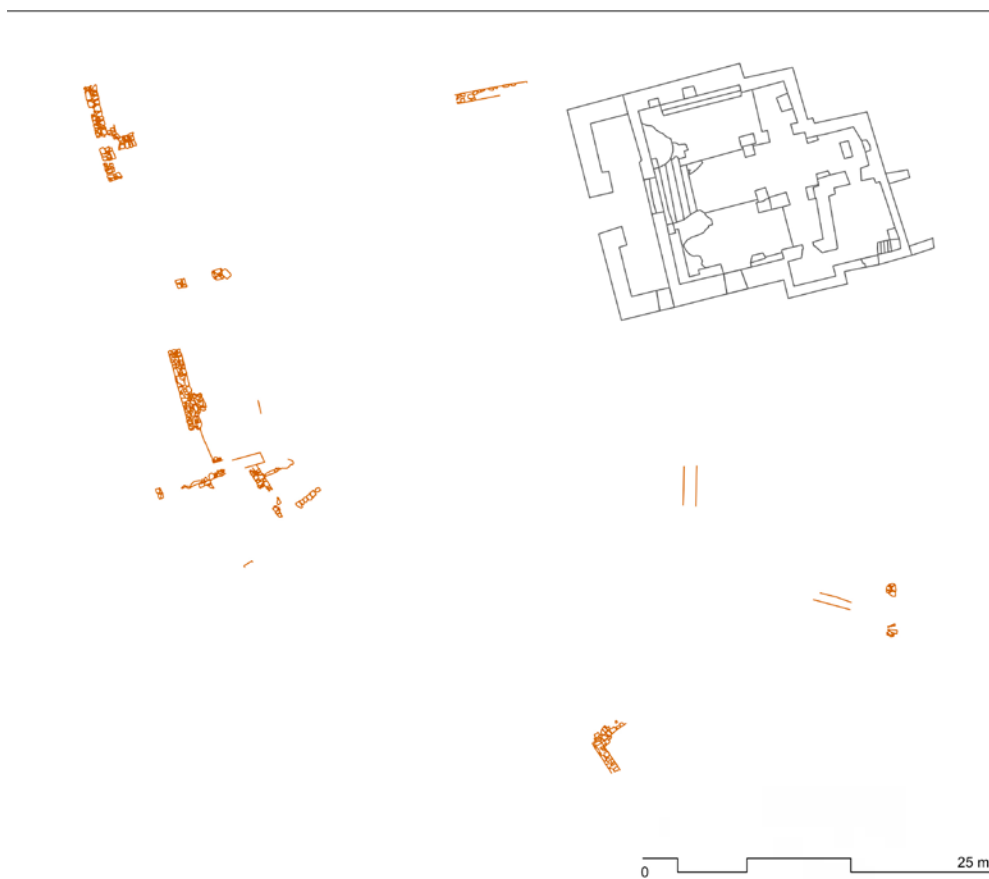
Figura 12. Planta de les restes constructives que corresponen a la fase 1, amb la planta de l'església ampliada.

La fase 2 (segles XIII-XIV) arrenca en una etapa d'expansió i creixement urbà, que coincideix amb el moment baixmedieval d'explosió demogràfica i creixement econòmic. Com bé sabem, aquesta situació es produeix en moltes altres poblacions de la zona, que creixen i s'amplien fins al punt de formar-se barris o raval fora murs. Sembla que és també llavors quan el poble de Santa Creu supera els límits de l'antic clos. És complex precisar com serien les cases en aquesta fase, ateses les reformes que pateixen més tard, però hem observat una pauta urbana que es