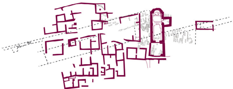
Figura 2. Planta del poble medieval de Sant Pere de Roda (l'Esquerda).

Una de les característiques del nucli medieval de l'Esquerda és la seva evident planificació entorn de dos espais: l'església romànica, i un llarg carrer que divideix i estructura el poble. L'església i la necròpolis a l'entorn ocupen el punt més alt de la península, amb una gran plaça al cantó nord on s'obren diverses edificacions, sobretot tallers i magatzems. El segon espai és un llarg carrer longitudinal de 2 m d'amplada que surt en direcció sud-nord des de la plaça al costat de l'església, i que actua d'eix de comunicació amb la part més baixa del poble, cap a la muralla. Tot i que a la part més baixa els nivells medievals s'han perdut per l'acció agrícola posterior, la presència de fons de sitges d'època visigòtica i l'encaix direccional perfecte del carrer medieval amb el carrer ibèric demostren una continuïtat d'ocupació i unes pautes urbanístiques constants que es van mantenir al llarg dels segles (Ollich, Rocafiguera 1992, 1993 i 2019). Tot plegat crea una trama urbana ortogonal, amb carrers rectilinis que es creuen entre ells perpendicularment (fig. 2).