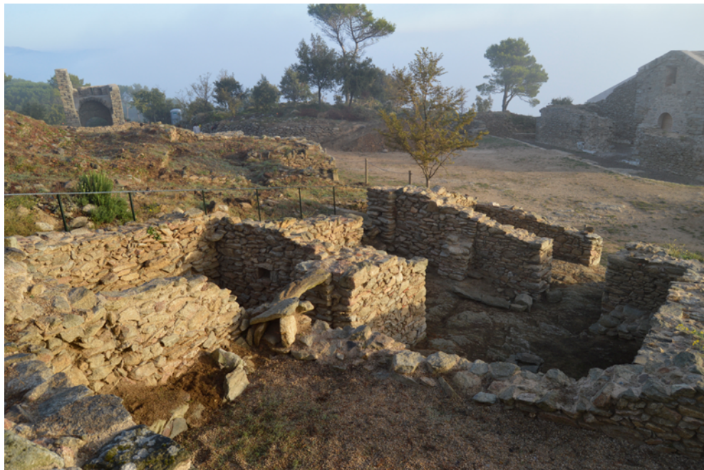
Figura 16. Conjunt de les cases del sector oest, on s'observa el desnivell del terreny i els diferents pisos esgraonats.

en quatre estances —una d'elles separada per un arc— i amb accés des del carrer principal (fig. 16).