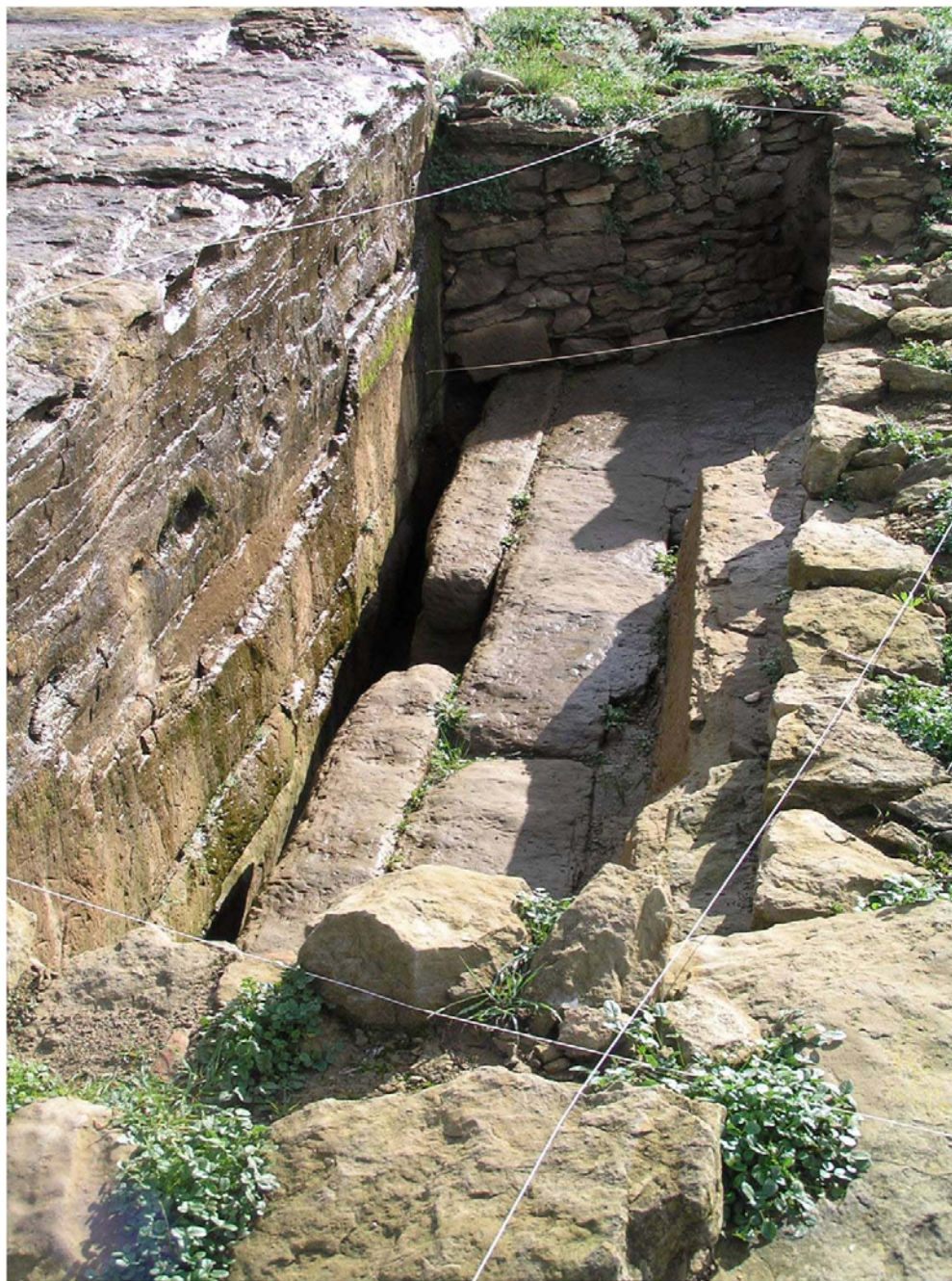
Figura 8. Cisterna o font de biot enmig del poble.

de la diàclasi que s'enfonsa, i que capta i canalitza l'aigua subterrània de la pluja escolada de més amunt a través de la roca viva. Tot plegat proporcionaria aigua potable directament al poble, evitant així haver de baixar al riu (fig. 8).