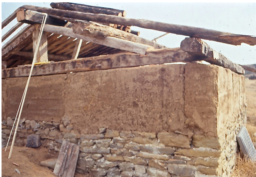
Figura 6. Graner medieval en procés de construcció a l'àrea experimental de l'Esquerda. Hom pot observar la base del mur feta amb carreus de pedra i, la resta de paret, de tàpia; la coberta amb bigues de roure i l'entramat de biguetes per sostenir les teules.

s'arrebossava per l'exterior amb una capa de calç. Altra vegada, aquest sistema sembla heretat dels temps ibèrics, amb la diferència d'afegir una mica de calç entre els murs i de l'arrebossat exterior. Aquestes parets combinades de pedra i tàpia només permetien pujar un pis com a màxim, tot i que moltes cases podien comptar amb un altell a un cantó, aprofitant el desnivell de la teulada (fig.6).