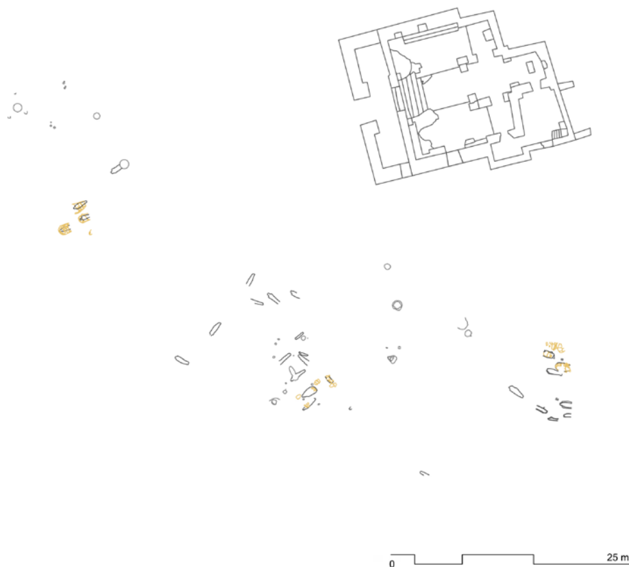
Figura 11. Planta en detall de la fase 0 o preliminar, amb l'emplaçament de les tombes de la necròpolis localitzades i altres retalls al subsol, amb l'església a l'est.

Les primeres restes constructives del poble de la fase 1 estan representades, bàsicament, per trams de murs, alterats per les reformes constructives posteriors, que es fonamenten sobre la roca i sobre les restes del cementiri anterior (fig. 12). Aquestes parets estan fetes de pedres locals disposades en sec. Les restes són tan escasses que es fa quasi impossible determinar com serien les cases en