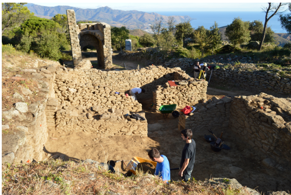
Figura 15. Procés d'excavació a Santa Creu de Rodes, a prop de la torre-portal nord.