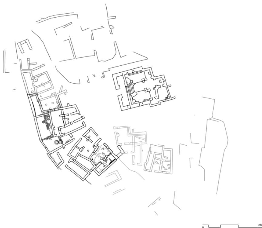
Figura 10. Planta general del jaciment de Santa Creu de Rodes amb els espais excavats entre els anys 2006 i 2017.