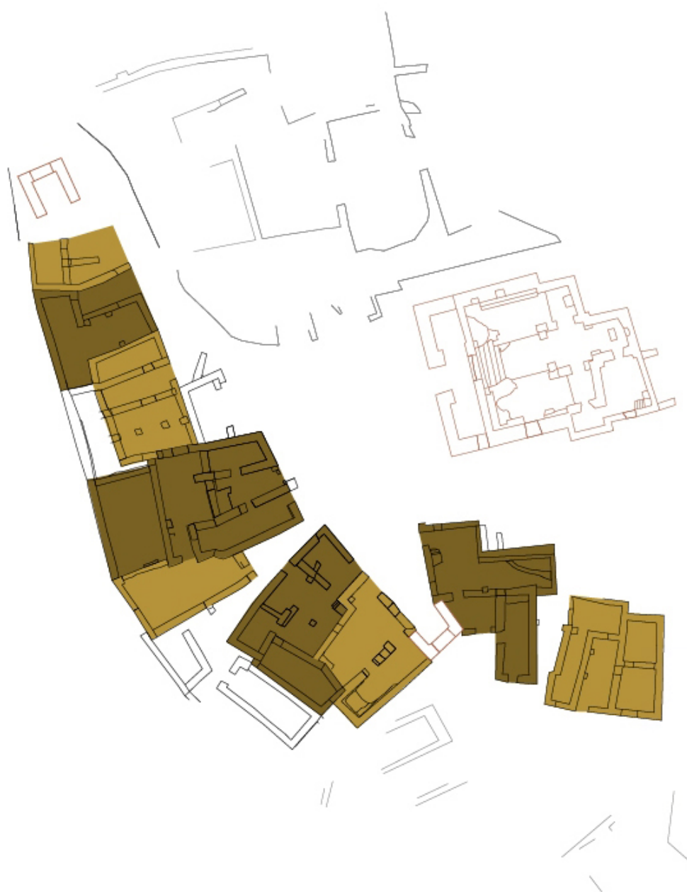
Figura 14. Conjunt de l'espai excavat amb la diferenciació de cadascuna de les cases, individualitzades.

de llegums, com ara faves, pèsols i lleties, aquestes potser en hortes, i vinya. També s'han trobat estris de pesca i restes de fauna marítima diversa, les quals fan valoritzar el paper de la pesca o les conserves de peix al poblat. També es practicava la ramaderia. Entre el mamífers domèstics, cal destacar els ovicaprins com els ramats més explotats de la zona, ja sigui pel consum de la seva carn o l'obtenció de la llet i la llana. Pel que fa a bòvids i suïds, s'ha observat que si bé els bòvids eren minoritaris abans del segle xv, al llarg del temps adquireixen una certa importància en detriment dels suïds, que sí que la tenien amb anterioritat. Com a curiositat, cal esmentar l'explotació de les mosteles, de les pells dels gats o de les vèrtebres de tauró com a denes de collar (fig. 15).