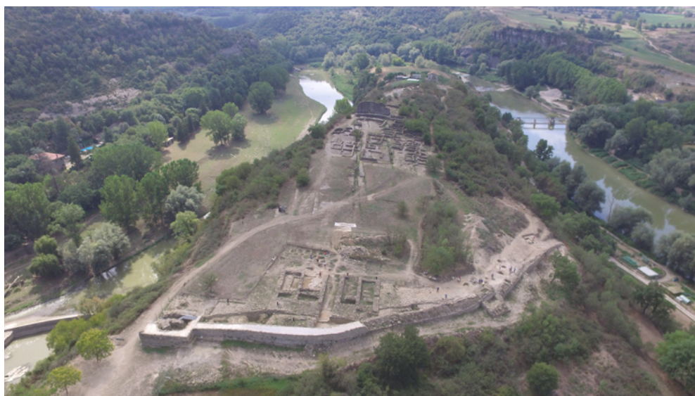
Figura 1. Vista aèria de la península de l'Esquerda, formada per un meandre del Ter al seu pas per la comarca d'Osona.

hereva dels Cabrera, amb Ponç Hug IV d'Empúries-Peralada suposava una clara amenaça per al poder reial centrat a la casa de Barcelona, i va ser la causa directa dels conflictes bèl·lics posteriors. A inicis del segle XIV, les fortaleses clau dels Cabrera van ser atacades sistemàticament per les tropes reials, entre elles l'Esquerda de Roda, i els castells de Cabrera i de Barrès. Després de la destrucció definitiva que li van infligir l'any 1314 les tropes del bisbe de Vic, aliat del rei Jaume II contra els Cabrera, la fortalesa de l'Esquerda va quedar abandonada i només es detecta algun ús posterior a la zona de la necròpolis. El poble va ser arrasat, i els que no hi van morir es van dispersar per la plana o es van traslladar al nou nucli al cap del pont, que donarà lloc a l'actual poble de Roda de Ter (Ollich et al. 1995 i Pratdesaba et al. 2020). Amb el temps, la vegetació va anar cobrint l'antic poble abandonat, deixant a la vista només la paret sud de l'església, que restava dempeus a la part més alta de la península. Paral·lelament, alguns marges del costat nord-oest es van arranjar amb aportació de terres de conreu al llarg dels segles XVI-XIX, i es van fer servir com a feixes de cultiu. Els treballs agrícoles van seguir fins al 1981, fet que explica la destrucció dels estrats medievals superiors en aquestes zones de darrere i sobre la muralla, al costat nord.