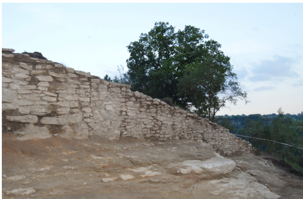
Figura 3. Vista cap a ponent de la muralla visigòtica-carolíngia.