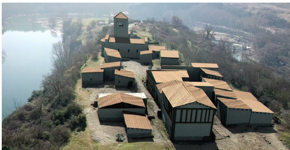
Figura 5. Restitució virtual del poble medieval de Roda-l'Esquerda.