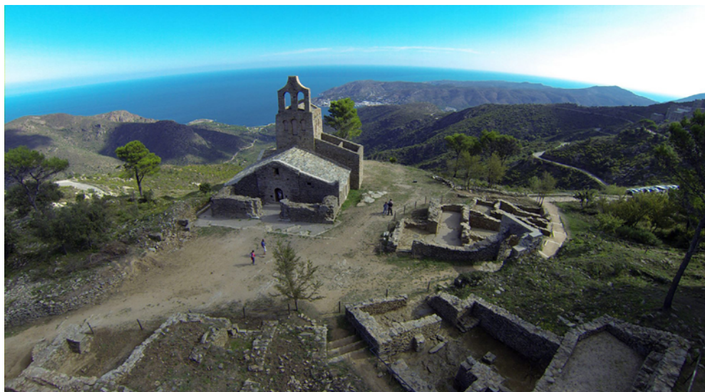
Figura 9. Vista aèria del jaciment de Santa Creu de Rodes, a la serra de Verdera, a l'Alt Empordà, amb les cases en primer terme i l'església de Santa Helena. Al fons, el Port de la Selva i el cap de Creus.

costat nord com al sud-est. 2 A l'extrem est, on s'alça l'església, l'espai és abrupte i no sembla que hagués estat ocupat per habitatges, tot i que aquesta zona es va alterar notablement quan es va fer la carretera que mena al monestir a final dels anys setanta del segle passat.