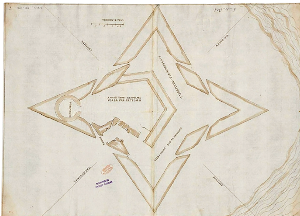
Figura 2. Projecte del castell de la Trinitat elaborat per Pizaño (De la Fuente, 2016, 183).